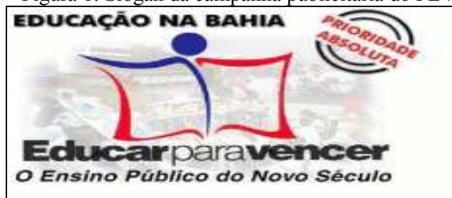
Figura 1: Slogan da campanha publicitária do PEV.

A Figura 1 evidencia que a educação foi eleita prioridade absoluta pelo governo César Borges.