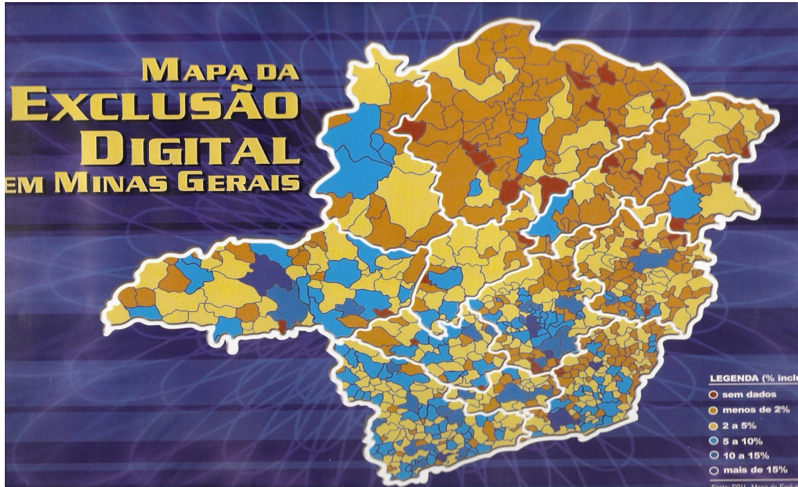
Figura 1 – Mapa da exclusão digital em Minas Gerais