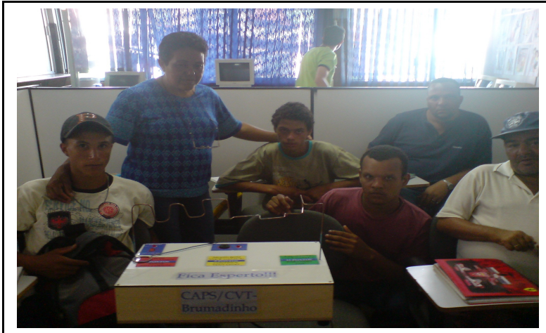
Figura 7 – Laboratório de Eletroeletrônica do CVT de Brumadinho Disponível em: < http://dweb01.inclusaodigital.mg.gov.br/ >. Acesso em: 6 jul. 2008.