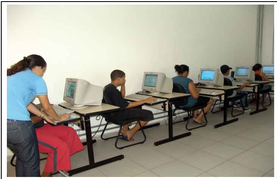
Figura 5 – Sala de inclusão digital de Vespasiano

É relevante ressaltar que as salas de incubadoras de empresas, desde meados de 2008, tiveram seus espaços renomeados para Núcleo de Apoio ao Empreendedor (NAE), mudando também sua finalidade. A inexistência de alguns parâmetros legais para se fazer um espaço de incubação de empresas e, por outro lado, a amplitude das demandas surgidas em relação ao fomento, capacitação e apoio a novos empreendedores motivaram a mudança desta proposta.