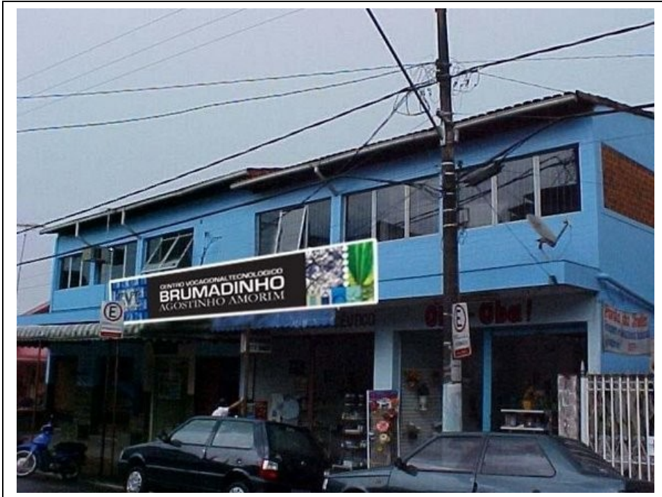
Figura 6 – CVT Brumadinho