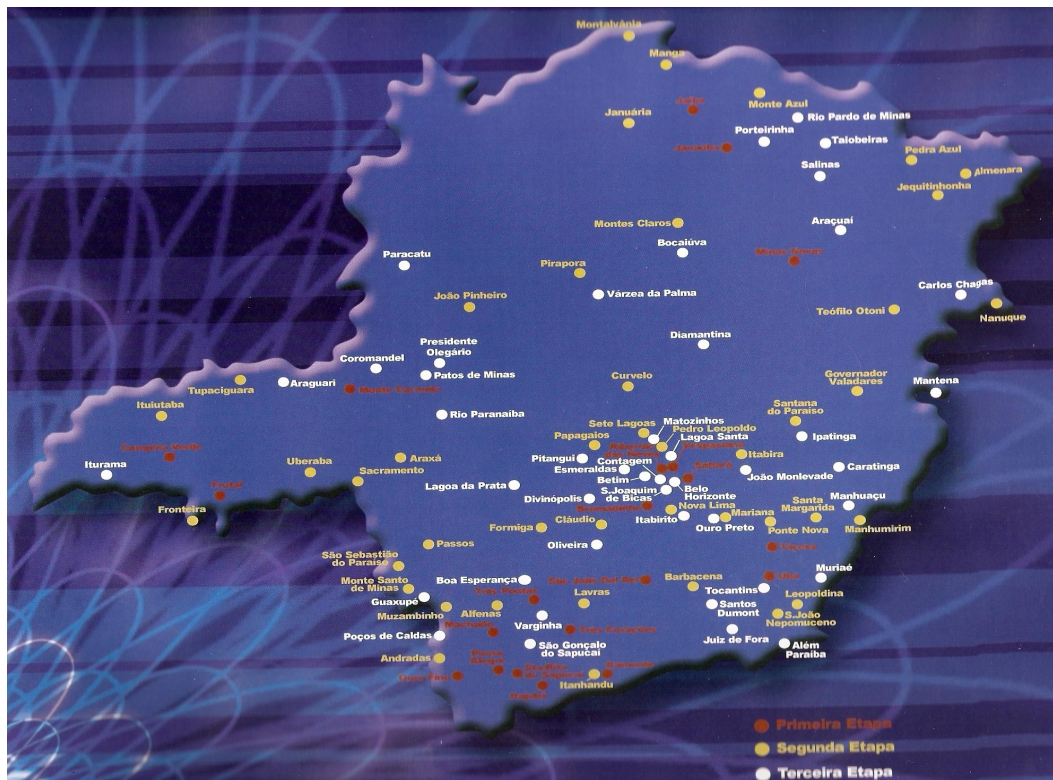
Figura 3 – Localização dos CVTs implantados em Minas Gerais

O projeto Rede Mineira de CVTs prevê a instalação dos Centros Vocacionais em 108 municípios mineiros. Até 2008, a previsão é que sejam implantados CVTs. Até o momento, foram instalados 57 (FIG. 3).