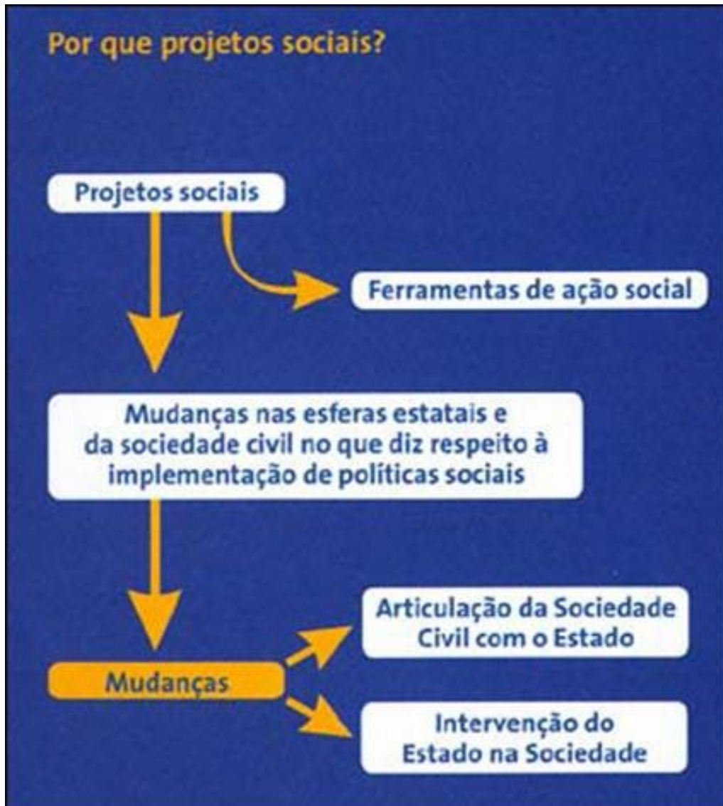
Figura 2 – Ciclo dos projetos sociais enquanto ferramentas de Gestão Social

Na figura 2, os autores apresentam a coerência do conceito de projetos sociais com o surgimento das parcerias intersetoriais, criando um viés metodológico para sua implantação, enquanto ferramenta de gestão social.