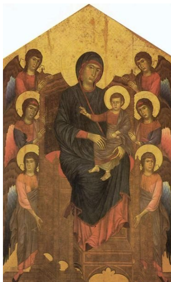
Figura 3: Cenni di Pietro Cimabue Madona , c.1270.

Têmpera sobre madeira, 375x220 cm; Museu do Louvre, Paris.