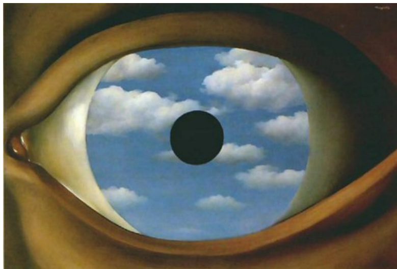
Figura 13: René Magritte

de objetos distintos, de elementos absurdos em contextos inesperados propicia uma nova visão da realidade para além da lógica racional.