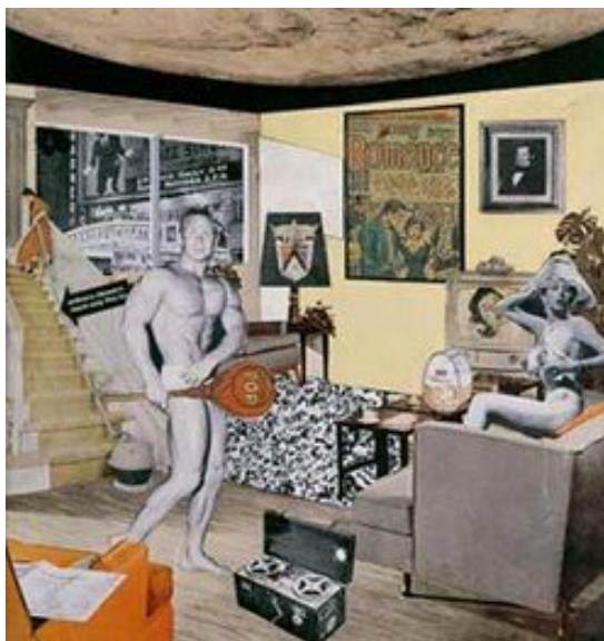
Figura 14: Richard Hamilton O que é que faz que nossos lares sejam hoje tão diferentes, tão encantadores , 1956. Colagem, 26x25 cm, Museu Kunsthalle, Alemanha.

A produção artística do inglês Richard Hamilton (1922-) exemplifica a proposta de um estilo artístico baseado no reprocessamento de imagens populares e de consumo, como podemos comprovar através da obra “O que é que faz que nossos lares sejam hoje tão diferentes, tão encantadores” ( Figura 14 ), considerada o marco do movimento. Hamilton imprimiu uma base intelectual às produções da Pop , problematizando a forma de ser de uma geração que fez do consumo um valor, levando ao extremo o culto à imagem.