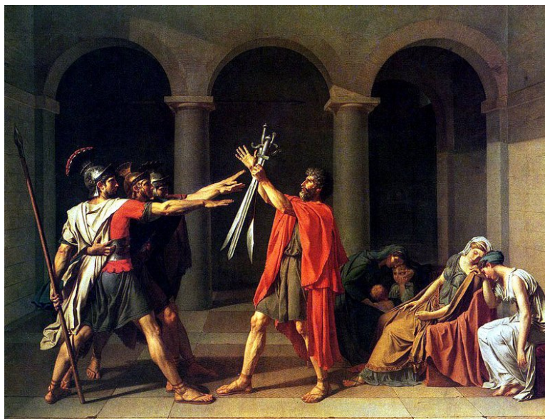
Figura 9: Jacques-Louis David Juramento dos Horácios , 1784. Óleo sobre tela, 330x425 cm; Museu do Louvre, Paris.