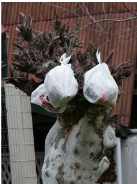
Figura 1: Claudia Tavares S/ título, 2008. Fotografia digital, Cassino.

A educação do olhar, do sensível, é apresentada como uma poderosa contribuição para o desenvolvimento de um pensamento crítico frente à cultura visual e suas relações socioambientais. Assim, almeja favorecer o autoconhecimento e o reconhecimento do Outro como constituinte do processo individual de aprendizagem.