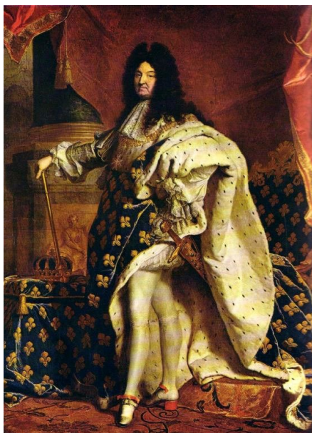
Figura 8: Hyacinthe Rigaud Retrato de Luís XIV , 1701. Óleo sobre tela, 279x190 cm; Museu do Louvre, Paris.

Com a revolução intelectual instaurada em meados do século XVIII 9 , surge uma outra visão de estética, influenciada por uma profunda convulsão social e cultural que permeia as sociedades europeias. A indiscutível autoridade do Clero e da Nobreza é influenciada pelo Iluminismo. Com a Revolução Francesa o quadro social e político francês é definitivamente modificado.