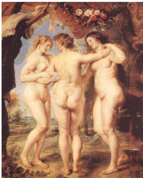
Figura 5: Peter Paul Rubens As três graças , 1639. Óleo sobre tela, 221x181 cm; Museu do Prado, Madri.

A beleza não era mais tratada como algo “perigoso”, mas sim como atributo necessário da posição social e do caráter moral, pois ela passou a ser reconhecida como reflexo exterior de uma “benevolência” interior. Ao captar a beleza física nas representações pictóricas, o homem renascentista acreditava alcançar a beleza espiritual . Devido à visão utilitarista que se instaurou nesse período histórico, assim como à ética antropocêntrica, a compreensão do ambiente restringia-se ao seu uso, à sua exploração contínua enquanto recurso inesgotável.