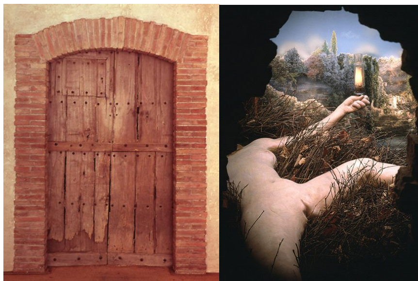
Figura 12: Marcel Duchamp Etant donnés: Dados 1. A queda de água, 2. O gás de iluminação , 1946-66, instalação Philadelphia Museum of Art.

A obra Etant Donnés (Figura 12) é constituída por um cenário tridimensional dentro de uma caixa preta em tamanho natural e por uma antiga porta de madeira que possui um pequeno furo. Esse furo permite que o espectador “espie” e descubra, como um voyeur , o que existe em seu interior. Os ilimitados significados atribuídos fazem do espectador parte da criação, segundo o próprio conceito de Duchamp descrito em “o ato criador” 12 , que entende o espectador como coparticipador da obra.