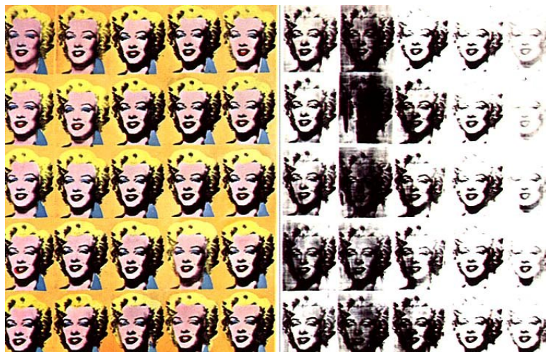
Figura 15: Andy Warhol Marilyn Diptych , 1962. Silkscreen, 208x145 cm, Tate Gallery, Londres.

Ao discutir a definição de arte e sua aproximação com a vida, os artistas da Pop Art , assim como Duchamp, deixam suas marcas para a Arte Contemporânea , num constante processo de questionamento sobre a própria arte, com o qual o artista tenta apagar cada vez mais os limites estabelecidos ao longo do tempo entre a vida e a arte.