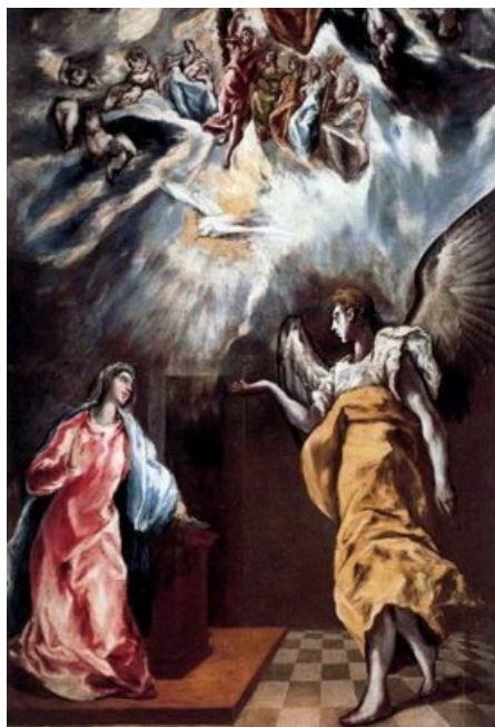
Figura 7: El Greco Anunciação , 1608-1614. Óleo sobre tela, 291x205 cm; Museu de Santa Cruz, Espanha.

A cosmovisão moderna conduz o ser humano ao culto à imagem, estabelecendo valores cada vez mais “umbigocêntricos”, individualistas, em discordância com a sua inerente relação dialógica para com o mundo exterior. Dentre uma gama de monarcas que se afirmam no poder de estados absolutistas, é possível citarmos Luís XIII como uma referência aos padrões de embelezamento do corpo e culto à imagem. Esse rei, em função da sua própria calvície, impôs uso de perucas como prática obrigatória na corte, uma nova moda seguida por mais de um século por seus sucessores ( Figura 8 ).