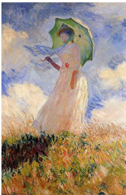
Figura 10: Claude Monet Mulher com sombrinha , 1886. Óleo sobre tela, 131x88 cm, Museu de Orsay, Paris.

Seu pensamento, ao tratar a tarefa da estética, como tendo o ponto de partida o próprio sensível para a observação da forma como nele se instaura a racionalidade, acaba por abrir espaço às especulações no âmbito estético, abafando o domínio das estéticas que prescreviam a idéia de imitação como cópia fiel à realidade externa. A primeira revolução artística é marcada pelo movimento conhecido como Impressionismo 11 , que se separou da tradição fiel à perspectiva, ao equilíbrio da composição para representar, através da cor e da luz, com pinceladas curtas e distintas, as sensações visuais para com o envolvimento no/pelo ambiente ( Figura 10 ). Os impressionistas registravam de forma direta a natureza, ou melhor, era por meio desse registro que transmitiam as impressões do momento imediato ao qual estavam submetidos/imersos; “aqueles pontos vivamente coloridos formavam um mosaico de borrões irregulares que vibravam de energia como o pulso da vida no brilho da luz sobre a água” (STRICKLAND, 2002, p. 96).