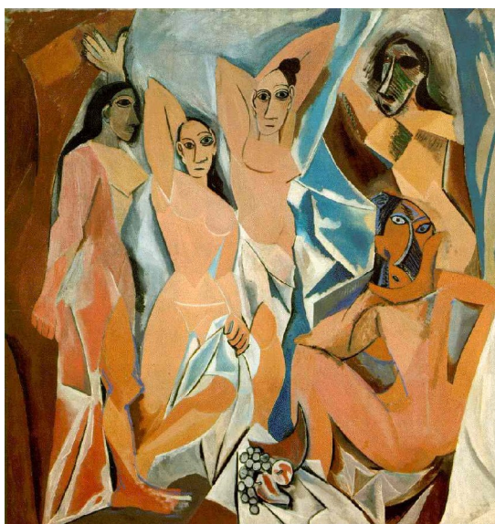
Figura 11: Pablo Picasso Les demoiselles d'Avignon , 1907. Óleo sobre tela, 243,9x233,7 cm, Museu de Arte Moderna, Nova Iorque.

O conceito de espaço pictórico imposto pelo Renascimento foi desconstruído e as figuras eram apresentadas em suas múltiplas vistas simultaneamente, colocadas ao mesmo tempo de frente, de perfil e de costas (STRICKLAND, 2002).