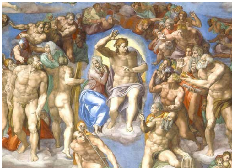
Figura 6: Michelangelo Buonarroti Juízo Final (detalhe), 1534-1541. Afresco; Capela Sistina, Vaticano.

Como resultado, estabeleceu-se, além do conflito espiritual, uma crise estética, a nova idéia de religião e suas conseqüências para a sociedade como um todo destruíram o prestígio dos artistas como criadores autônomos, independentes. Alguns artistas encaminharam-se para o puro esteticismo; para outros, a saída foi o abandono da arte, assim como a aceitação do conflito como não resolvido. O Maneirismo surge nesse conflito entre a consciência individual do artista e as forças externas que demandam atitudes pré-estabelecidas. Provocou rompimento com os cânones clássicos de ordem, proporção, equilíbrio, racionalismo e clareza, e revolucionou a história da Arte ao criar paradigmas novos como a arte divergindo da natureza. A procura do inesperado, do extravagante, as proporções do corpo humano alongadas – carga emocional do corpo ( Figura 7 ), como nas pinturas de Doménikos Theotokópoulos, El Greco (1541-1614) e o capricho nos detalhes estabeleceram-se como uma tônica desse período (GOMBRICH, 1999).