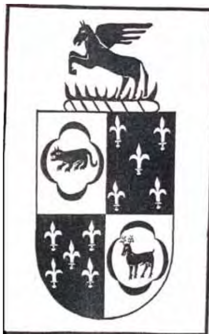
ESCUDO DE ARMAS DE DOM PEDRO DINIS QUADERNA 12º CONDE DA PEDRA DO REINO E 7º REI DO QUINTO IMPÉRIO E DO QUINTO NAPE DO SETE-ESTRELO DO ESCORPIÃO.