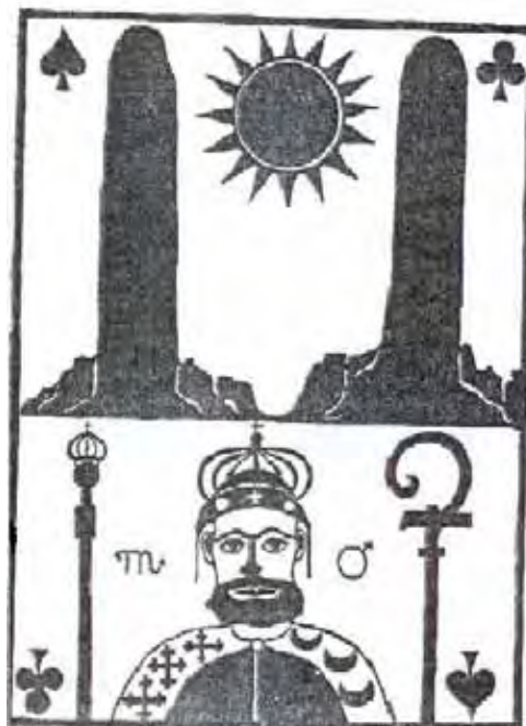
Figura 1 - A segunda gravura feita por Taparica sobre as pedras do reino:

SEGUNDA GRAVURA FEITA POR TAPARICA SOBRE AS PEDRAS DO REINO E COM MEU BISAVÔ APROXIMADO, TUDO A PARTIR DO DESENHO DO PADRE, VÊ-SE, PERFEITAMENTE, COM ABSOLUTO RIGOR HISTÓRICO, A COROA DOS QUADERNAS, MONTADA SOBRE UM CHAPÉU DE COURO.