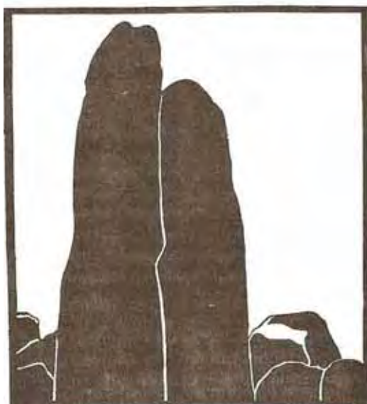
GRAVURA FEITA POR TAPARICA QUADERNA A PARTIR DA FOTOGRAFIA DE EUCLYDES VILLAR.

Entretanto, é cabível assinalar que o modo pelo qual é tematizado o ato de produção das xilogravuras, no plano fabular, vem demarcado por um distanciamento crítico que, ao abrir espaço para o estabelecimento de um tom gracioso e irreverente, acaba permitindo a interpretação maliciosa da pedra mais alta que, segundo o ponto de vista do xilógrafo, figurava-lhe indecente como o diabo (PR, 2005, p.153). Com efeito, quando nos deparamos com a representação gráfica das pedras, o riso aflorado já na cena descrita é, ainda, reforçado pela imagem elaborada por Taparica, de acordo com o que é possível visualizar em: