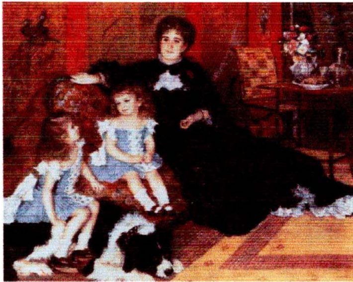
Renoir (Madame Charpentier e suas filhas)