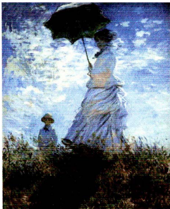
Claude Monet (La promenade)

Feito mãe, que dorme olhando os filhos, com os olhos na estrada... Djavan (Ferrugem)