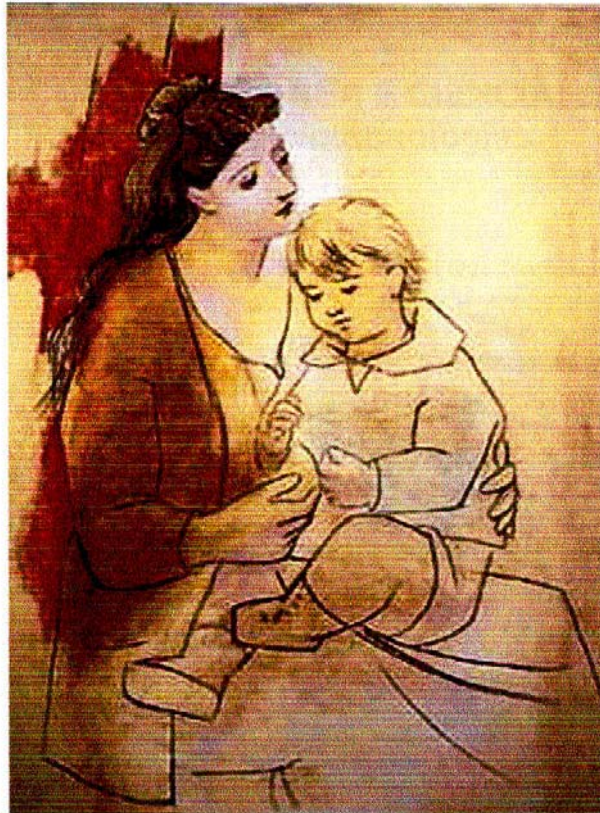
Pablo Picasso (Mãe com criança)