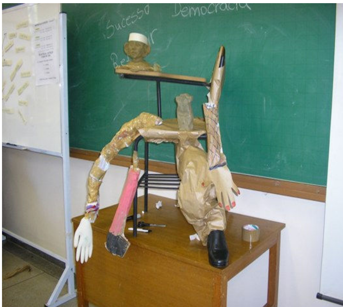
Foto 2: Trabalhos de artesanato realizado durante as Oficinas de Sensibilização, dos Trabalhadores e Trabalhadoras, e Avaliação das Necessidades de Formação para Ações Estratégicas em VISAPAF da Região Centro – Oeste - Goiânia.