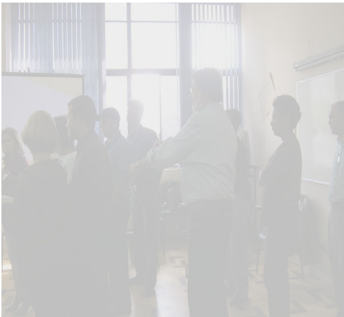
Foto 7: Trabalhos realizados durante a Oficina de Sensibilização, dos Trabalhadores e Trabalhadoras, e Avaliação das Necessidades de Formação para Ações Estratégicas em VISAPAF, etapa Nacional – Porto Alegre.