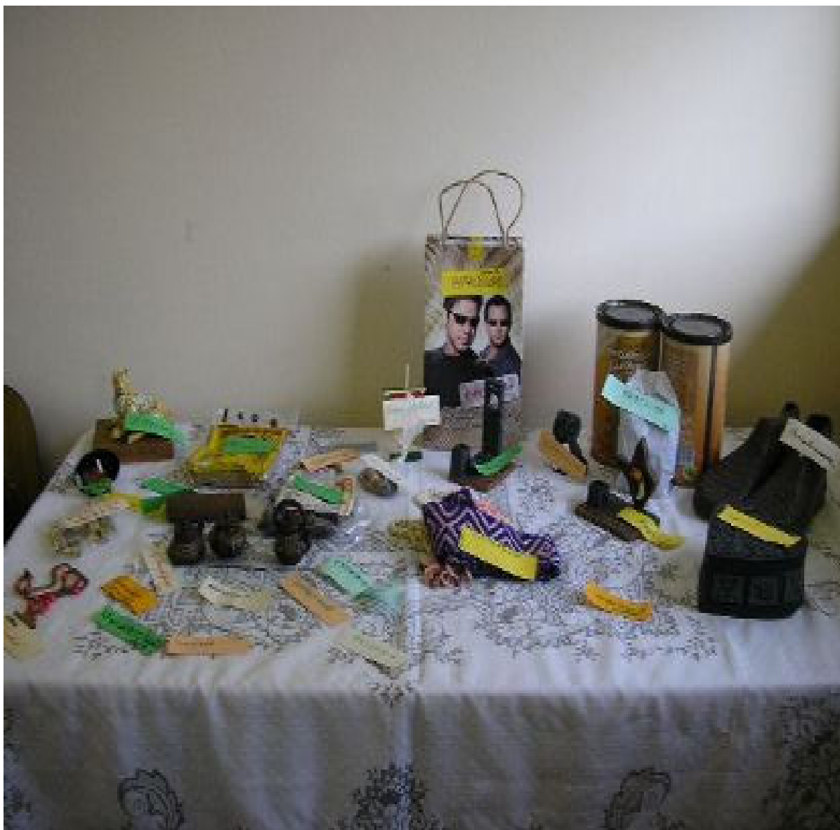
Foto 6: Trabalhos de artesanato realizado durante as Oficinas de Sensibilização, dos Trabalhadores e Trabalhadoras, e Avaliação das Necessidades de Formação para Ações Estratégicas em VISAPAF da Região Norte – Belém.