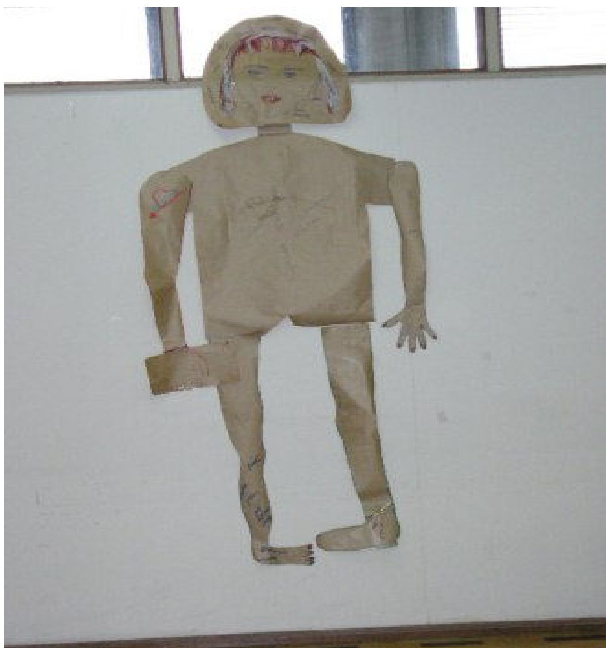
Foto 5: Trabalhos de artesanato realizado durante as Oficinas de Sensibilização, dos Trabalhadores e Trabalhadoras, e Avaliação das Necessidades de Formação para Ações Estratégicas em VISAPAF da Região Sul – Porto Alegre.