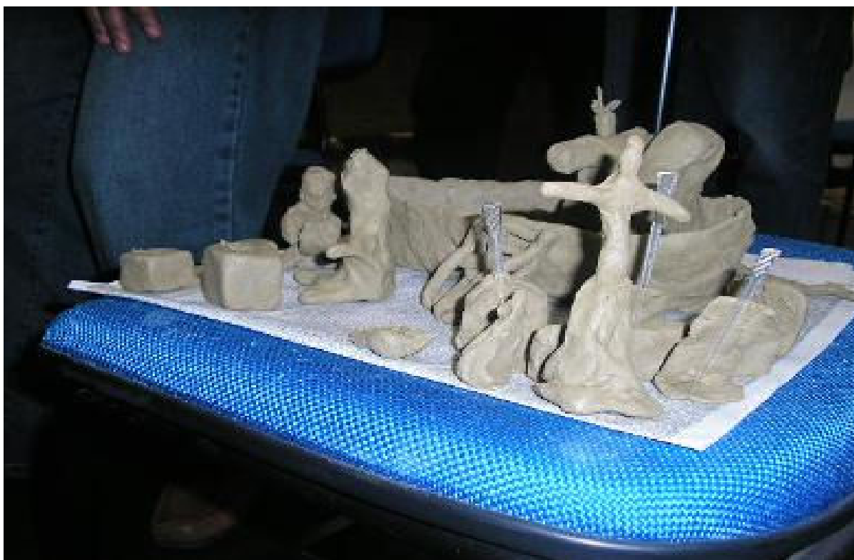
Foto 1: Trabalhos de artesanato realizado durante as Oficinas de Sensibilização, dos Trabalhadores e Trabalhadoras, e Avaliação das Necessidades de Formação para Ações Estratégicas em VISAPAF da Região Sudeste – Rio de Janeiro.