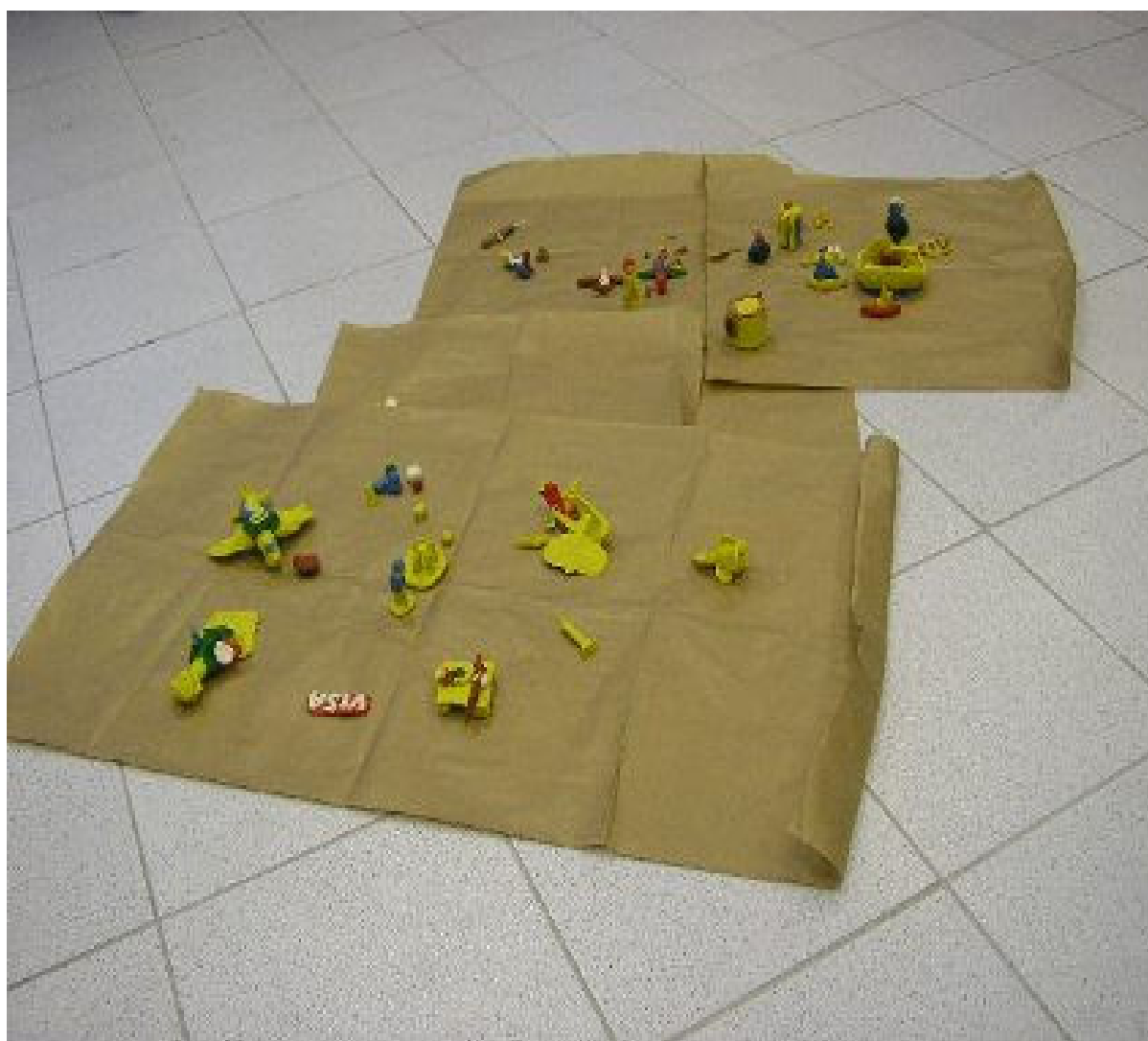
Foto 4: Trabalhos de artesanato realizado durante as Oficinas de Sensibilização, dos Trabalhadores e Trabalhadoras, e Avaliação das Necessidades de Formação para Ações Estratégicas em VISAPAF da Região Nordeste - Recife.