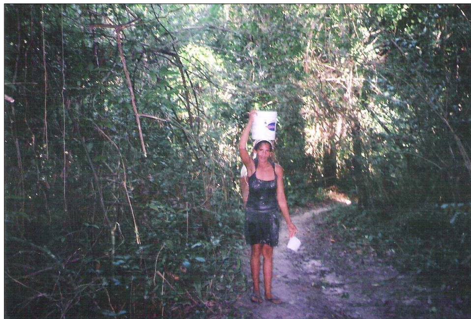
FIGURA 2 - A força de Trabalho na Comunidade ribeirinha de Nossa Senhora do Livramento. Com destaque, a força do trabalho da mulher na preparação e no transporte da farinha.

O ideal espaço amazônico e o pensamento estratégico: a cidade irreal sem conflitos e embates sociais.