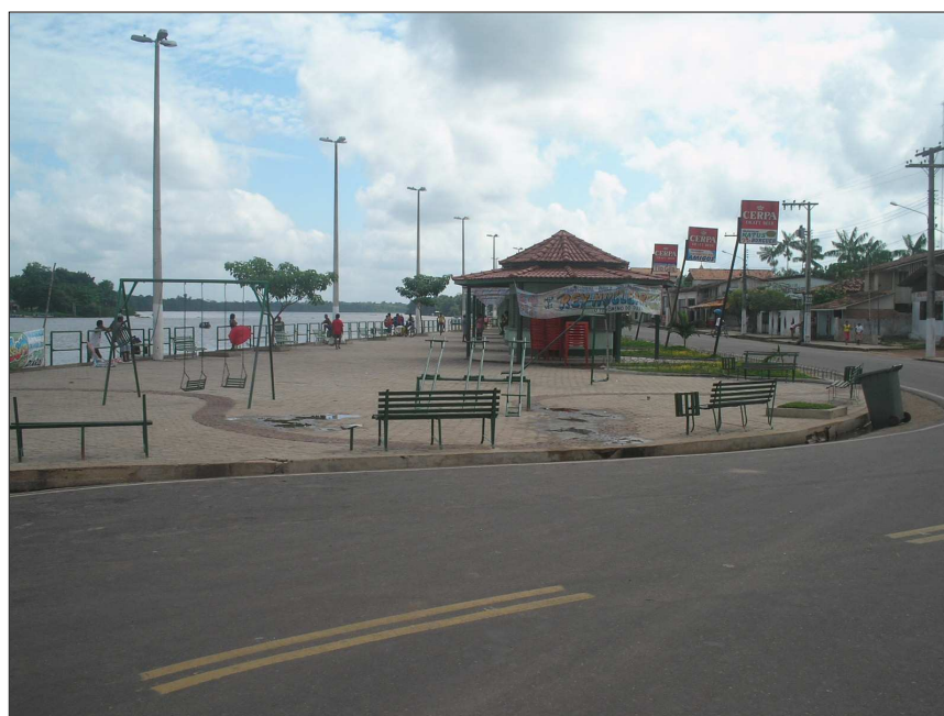
FIGURA 16 - Paisagem beira-rio depois do turismo: a reestruturação sócio-espacial impulsionada pela atividade turística, transformou a paisagem em novas formas e novos usos do espaço local, a fim de atender às necessidades dos visitantes e dos turistas. Rua Lauro Sodré, Bairro Nazaré.