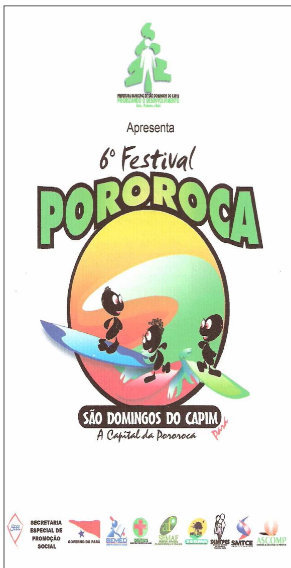
FIGURA 9 - Folheto de propaganda do 6º Festival da Pororoca. Diante da abrangência mercadológica do evento no território brasileiro e internacional, muitas empresas viram no fenômeno da pororoca uma oportunidade de veicular sua marca à imagem criada para Amazônia.

O ideal espaço amazônico e o pensamento estratégico: a cidade irreal sem conflitos e embates sociais.