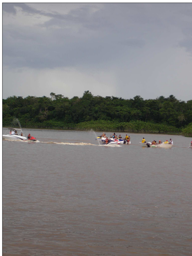
FIGURA 13 - Lanchas, voadeiras e jet ski. Novos objetos tecnológicos e novas especialidades substituem, no período do festival, referências ribeirinhas no rio Capim, na medida em que os rios têm significados sociais diferentes do cotidiano local.