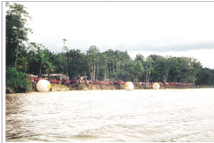
FIGURA 12 – Localidade do Toio. Como grande encenação da natureza, o público aguarda a pororoca. As pessoas ansiosas esperam a passagem da “natureza espetáculo”.

O ideal espaço amazônico e o pensamento estratégico: a cidade irreal sem conflitos e embates sociais.