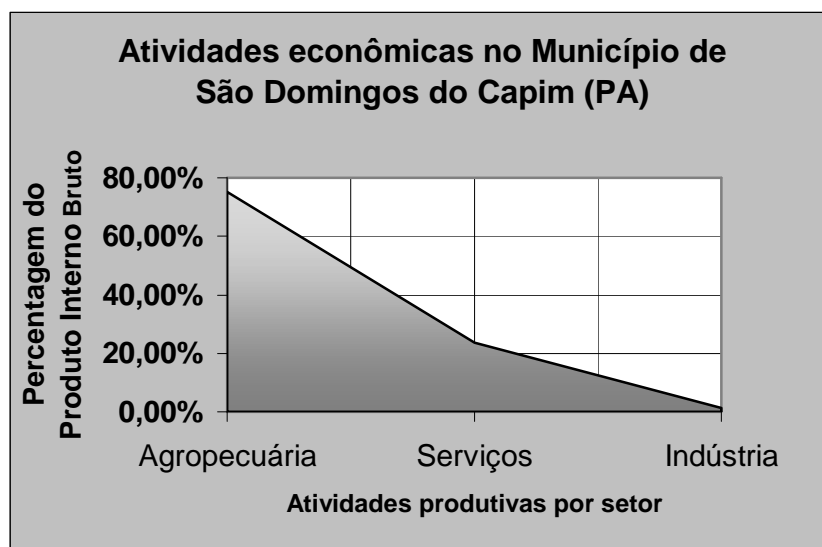
GRÁFICO - 2 Atividades econômicas do Município.

O ideal espaço amazônico e o pensamento estratégico: a cidade irreal sem conflitos e embates sociais.