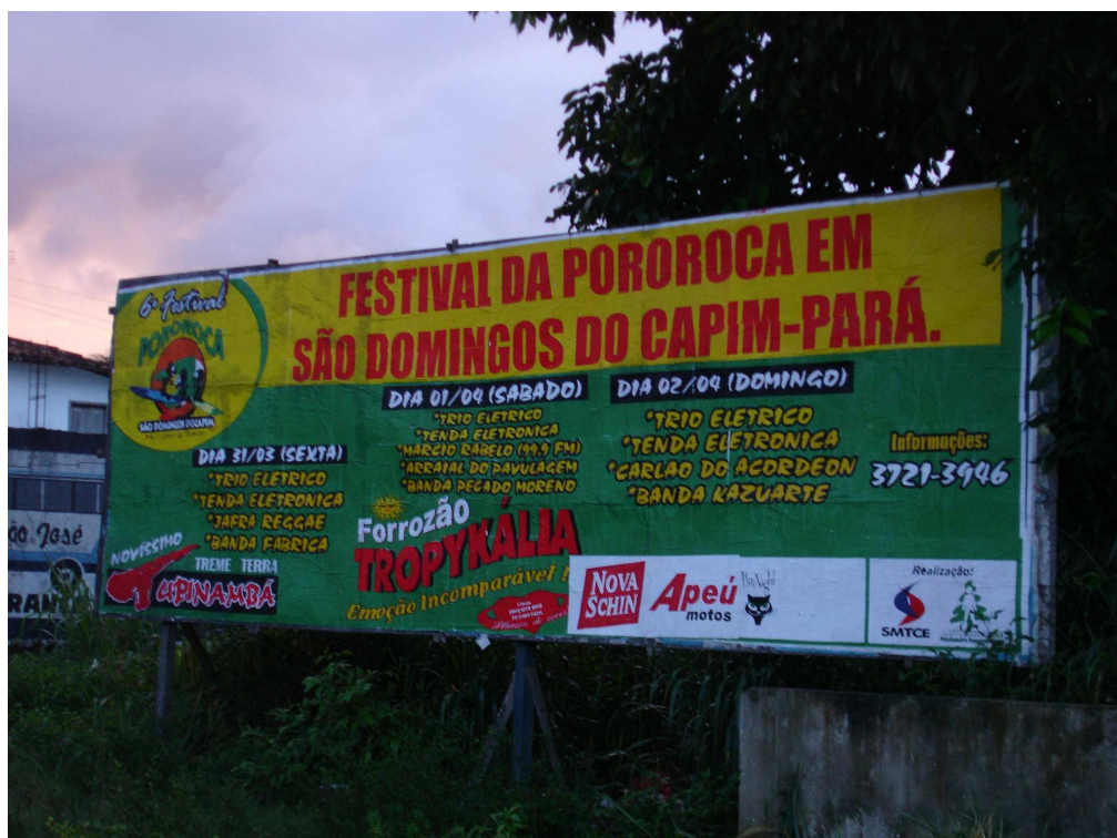
FIGURA 17 - Outdoor do festival. veiculados em várias meios de imprensa e afixados em vários locais de municípios, os instrumentos do marketing turístico restringem a realidade sócio-espacial de São Domingos do Capim a uma natureza criada para as necessidades da vida urbana. No outdoor, a programação privilegia os finais de semana. Fonte: Trindade Jr., abril/2006.

O ideal espaço amazônico e o pensamento estratégico: a cidade irreal sem conflitos e embates sociais.