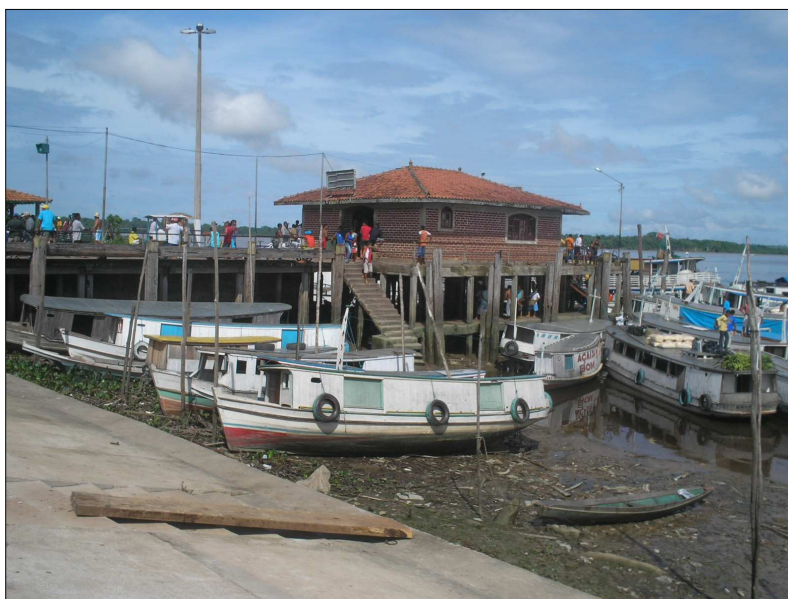
FIGURA 7 - Paisagem ribeirinha. Fotografia com ênfase na movimentação das pessoas à espera de transportar e/ou vender seus produtos agrícolas. É pelo trapiche municipal que as embarcações levam e trazem sobrevivências, vivências e esperanças diante do ritmo urbano da metrópole paraense. Fonte: Trabalho de campo, fevereiro/2006.

As relações sociais na sede urbana também compõem o cotidiano de São Domingos do Capim. Na frente da cidade, às margens dos rios Capim e Guamá, localizam-se as tabernas, baiúcas, casas de refeições e quiosques, além de outros estabelecimentos e espaços que