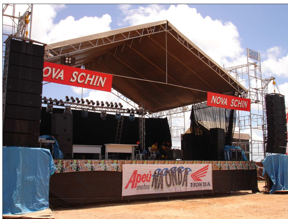
FIGURA 14 - Palco armado para o evento. Ao lado da igreja matriz, ergue-se a estrutura de show para o Festival da Pororoca. De infra-estrutura para manifestações culturais, o palco torna-se “haste” para as empresas afixarem suas marcas.

A beira do rio é ocupada por um contingente de pessoas à procura de diversão, e, sobretudo, da natureza espetáculo e hiperbólica recheada de desafios, aventuras e mitos. A organização do evento instala rapidamente um imenso palco, ao lado da Igreja matriz, no qual será realizado o show cultural com atrações de artistas locais e regionais, vendas de comidas e bebidas (FIG. 14). O Festival da Pororoca é realizado no mês de março ou abril e dura aproximadamente três a quatro dias. Nesses dias ocorrem programações culturais e esportivas, o que faz o evento iniciar de manhã e prolongar-se à noite.