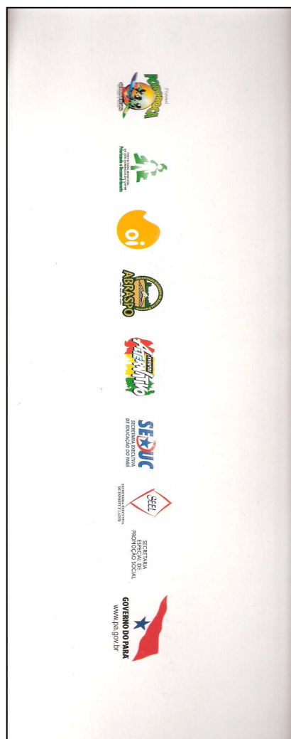
FIGURA 10 - Folder de propaganda do 7º Campeonato de Surf na pororoca. Os patrocinadores associam suas marcas ao fenômeno da pororoca. Usam das representações criadas pelo marketing uma estratégia de mercado. Com a saída da SEEL vários patrocinadores deixaram de veicular suas marcas durante o festival.

O ideal espaço amazônico e o pensamento estratégico: a cidade irreal sem conflitos e embates sociais.