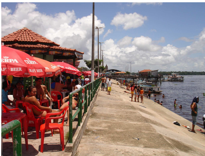
FIGURA 11 - Paisagem beira-rio no período de festival da pororoca. No espaço local, às margens dos rios Capim e Guamá, novas práticas sociais e novos estilos de vida são marcantes no cotidiano local.

Em contraste com um tempo sagrado, chegam os outros, os estranhos na cidade, cujo cumprimento “cordial” dessa relação são as buzinas das motocicletas, dos carros, as músicas em alto volume, a “aglomeração automotora” na orla atrapalhando o passeio, as voadeiras e jet ski cortando as marolas dos rios Capim e Guamá, as conversas nos bares e as bebidas servidas à vontade aos turistas, a moda e hábitos diferentes (FIG. 11) É o encontro de tempos diferentes inscritos na espacialidade local. De um lado, um tempo de reflexão e religioso, de outro, o avanço da modernidade 22 , do efêmero, do consumo, do status em viajar e conhecer lugares, um modo de vida cujo instrumento consiste numa válvula-de-escape contra as neuroses e rotinas urbanas. Da beira se vê chegando a balsa “pinhada” de carros; no rio, lanchas, voadeiras pranchas de surf, jet ski, catamarãs que pertencem às mais variadas empresas, cujas marcas estão expostas visualmente em diversos lugares na cidade, fazendo do espaço uma apropriação turística (FIG. 12 e 13, p. 100).