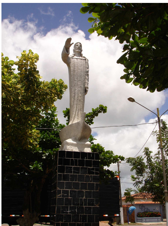
FIGURA 6 - Imagem de Cristo na paisagem beira-rio. No cotidiano ribeirinho do Município esta referência simbólica sagrada compõe as representações sócio-espaciais diante as explicações sobre o fenômeno.