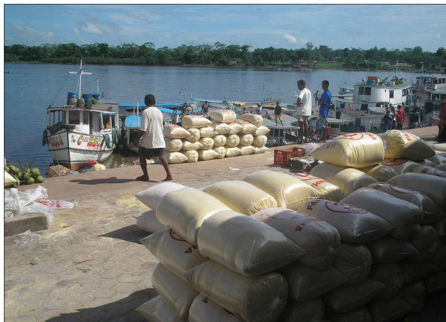
FIGURA 3 - escoamento da produção de farinha realizado no espaço beira-rio. Muitos produtores rurais e ribeirinhos saem de suas comunidades em direção à sede municipal para comercialização de seus produtos. A farinha de mandioca é a principal atividade produtiva do Município.

O ideal espaço amazônico e o pensamento estratégico: a cidade irreal sem conflitos e embates sociais.