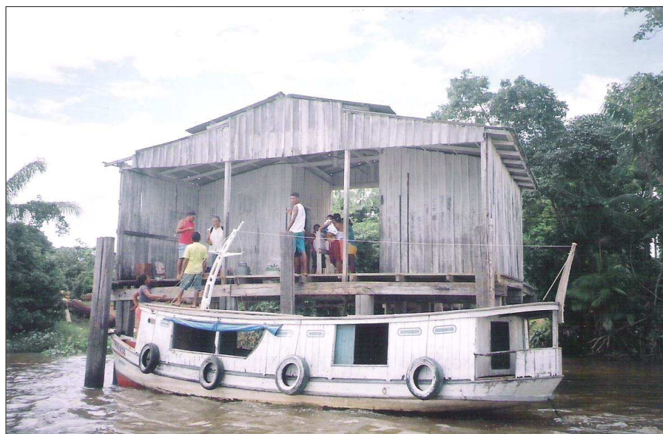
FIGURA 4 - Comunidade ribeirinha de São José do “S”. Ao longo do rio Capim, podem ser observadas várias comunidades ribeirinhas, cujo acesso é feito através de pontes. Cada comunidade possui sua respectiva ponte ou trapiche. Em destaque, moradores trazendo da sede municipal mantimentos necessários ao consumo diário.