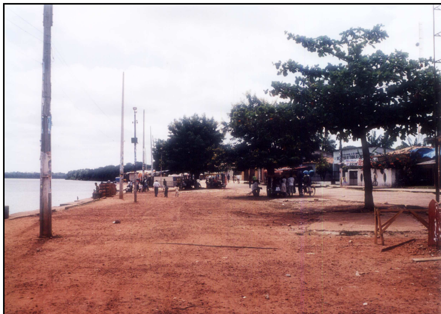
FIGURA 15 - Paisagem beira-rio antes do turismo. Antes da intensificação do turismo no Município as formas espaciais apresentavam outros conteúdos sociais relacionados aos objetos ali presentes. Em destaque, acácias e mangueiras como referências do cotidiano beira-rio. Rua Lauro Sodré, Bairro Nazaré.

1999). Nesse sentido, Trindade Jr. (2004), ao discutir a condição da vida cotidiana em formações urbanas, elucida que apesar dos tempos e agentes hegemônicos delinarem as expressões espaciais imediatas, há, ainda, que considerar ações, tempos curtos e lentos nas dinâmicas sócio-espaciais.