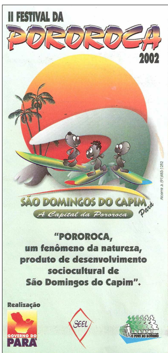
FIGURA 8 - Folder turístico da pororoca. A necessidade de criar uma imagem do Município fez o marketing usar a tradição e o lazer local como mercadoria, transformando vivências ribeirinhas em estilos e modos de vida urbanos.