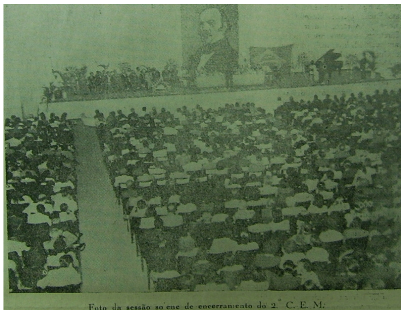
Figura 1. Vista parcial da sessão solene do encerramento do 2º Congresso Espírita Mineiro.

movimentos espíritas estaduais. Enfim, foi neste contexto que a União passou a impor a representação de que “Minas Espírita” era uma “Usina de Luz”, cujos raios celestiais, de tão intensos, irradiavam-se, levando o espiritismo para além das fronteiras do país.