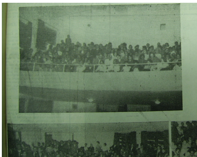
Figura 9. Tribuna da sessão solene na instalação da sede da União .