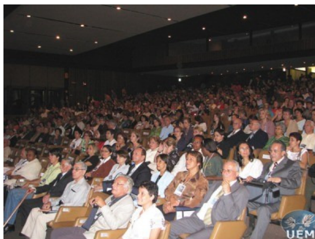
Figura 16. Vista parcial da tribuna no 4º Congresso Espírita Mineira.