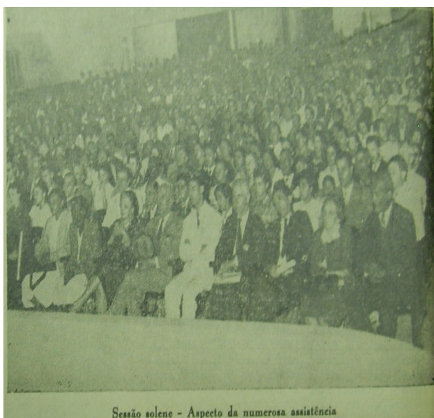
Figura 2. Tribuna na sessão do encerramento do 2º Congresso Espírita Mineiro.