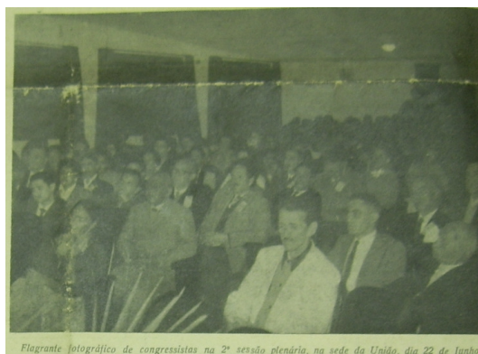
Flagrante fotográfico de congressistas na 2ª sessão plenária, na sede da União, dia 22 de Junho