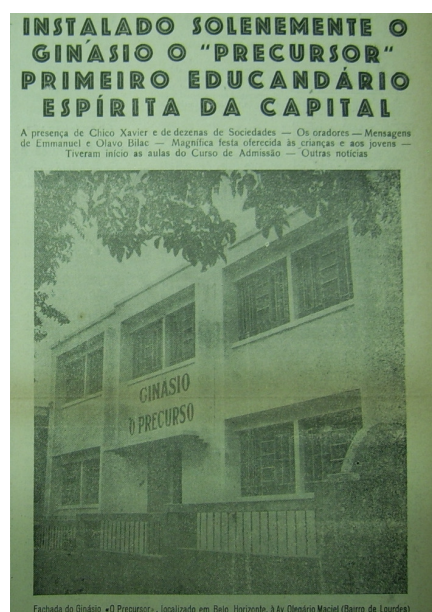
Figura 3. Fachada do prédio do Ginásio O Precursor .