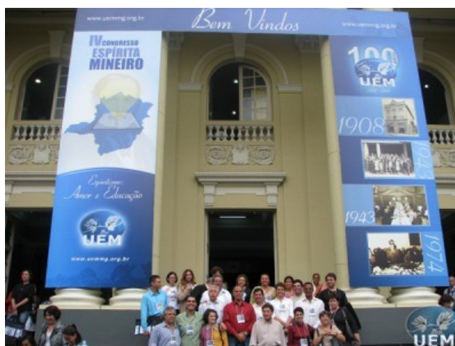
Figura 15. Congressistas na abertura do 4º Congresso Espírita Mineiro.