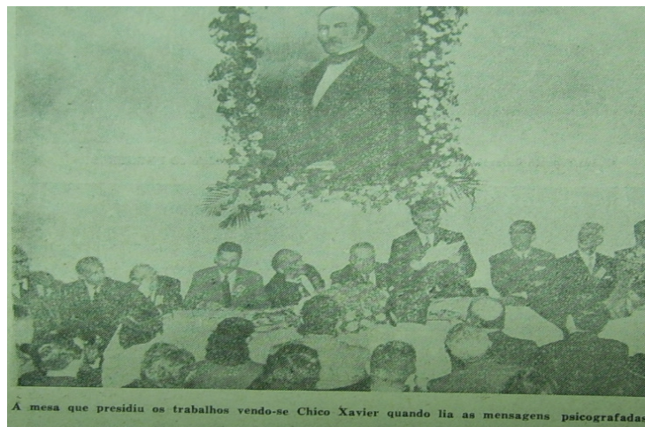
Figura 5. Mesa que instalou o Ginásio O Precursor . Chico Xavier lê mensagens psicografadas.