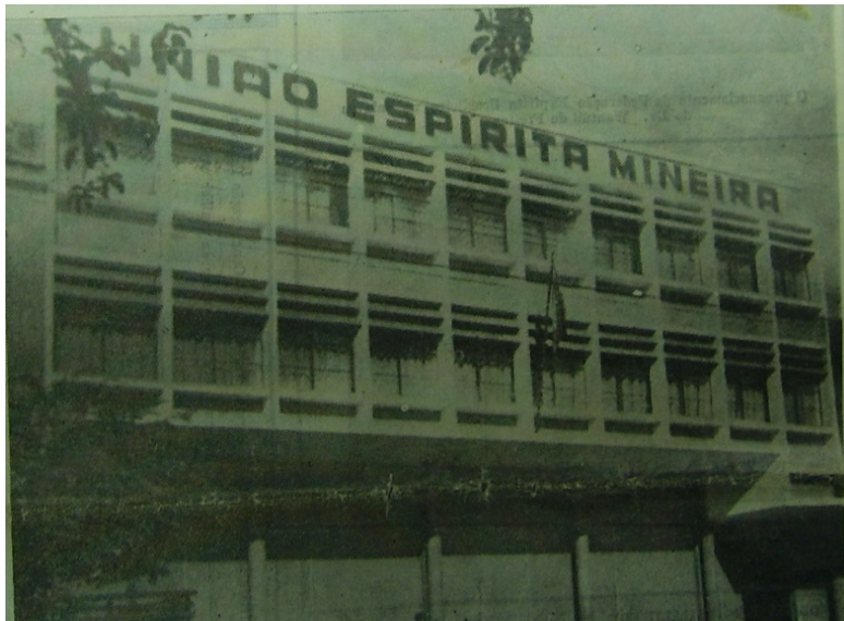
Figura 7. Fachada da sede da União Espírita Mineira inaugurada em abril de 1956.

Em suma, esse discurso pronunciado por Wantuil parecia atender a jogos de interesses recíprocos entre FEB , União e Chico Xavier, possibilitando que O Espírita Mineiro , ao divulgá-lo, procurasse endossar a seguinte representação: na inauguração daquela nova sede (onde também se comemorava o aniversário d’ O Livro dos Espíritos ) o presidente da FEB (por sinal, um mineiro) proporcionava à União o reconhecimento da sua condição de “instituição exemplar”. Isto, em função da sua capacidade de construir tal sede, pela audaciosa comemoração do livro de Kardec proposta para aquela noite, e ainda, por ser ela a líder legítima de um movimento que tinha o privilégio de possuir como bem simbólico mundial Chico Xavier, que irradiava a doutrina espírita por meio de seus livros. Desta maneira, Minas, em virtude do trabalho missionário dos seus filhos, possuía a missão de irradiar a doutrina espírita para além da “Pátria do Evangelho”. Assim, a União , ao contar com a presença deste médium em sua casa, e, ao apoiar seu trabalho, estava contribuindo para Minas cumprir o seu “papel missionário” com o Brasil. Esta “pátria”, representada ali pelo presidente da FEB , reconhecia e anuía essa “missão de Minas”. Enfim, essa parecia ser a representação que O Espírita Mineiro pretendia construir e divulgar em cima deste discurso pronunciado pelo presidente da FEB , naquela “noite solene” de 18 de abril de 1956.