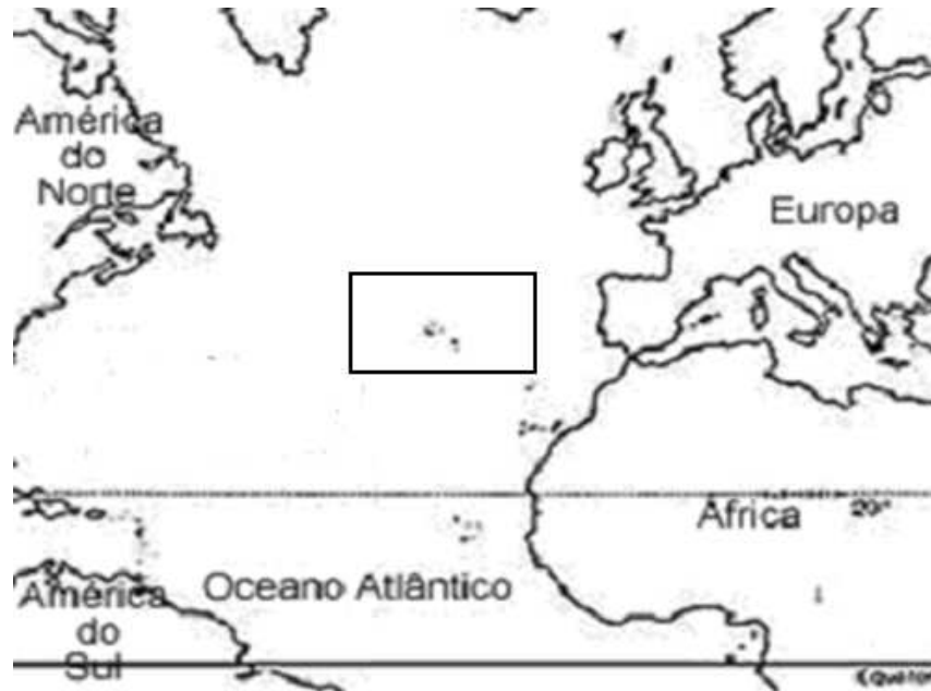
Mapa 5: Mapa das nove ilhas dos Açores