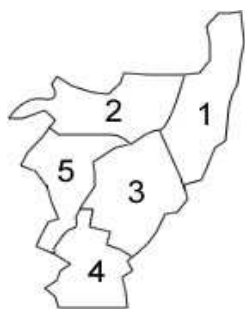
Mapa 1: Evolução geográfica de Santo Antônio de Lisboa.