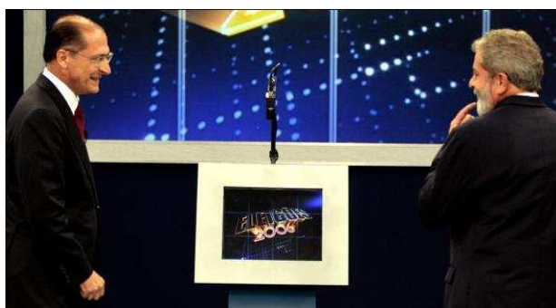
Figura 5– Cenário debate na TV Globo – Segundo turno

Nos três primeiros blocos os candidatos responderam a perguntas formuladas pessoalmente pelos eleitores indecisos ao serem escolhidos pelo candidato através do dispositivo eletrônico. No último bloco, Lula e Alckmin puderam fazer perguntas entre si com tema livre.