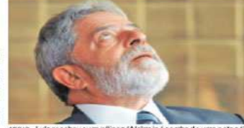
APRÍLIO - Lula recebeu evangelistas. Alckmin é o sombra de uma nota só

pela TV Gazeta para dia 17, mas ainda sem confirmação da presença de Lula. Sem dúvida com seu desempenho no debate, Alckmin afirmou ontem que o tom que adotou foi reflexo da indignação de toda a sociedade com a corrupção: "Isso estava parando na garganta de todo mundo. Fui um instrumento do povo, não com raiva, mas com indignação". ■ PÁG. A14 E A15