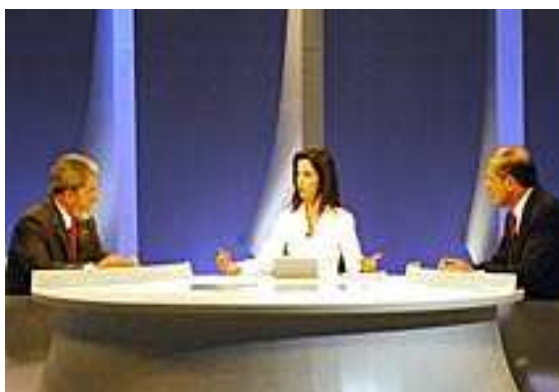
Figura 3 – Cenário SBT – Segundo turno

No primeiro bloco, os candidatos falaram de suas propostas de governo a partir de quatro temas sorteados pela mediadora. No segundo e no terceiro blocos, os candidatos fizeram perguntas entre si. O quarto bloco foi dedicado às considerações finais dos candidatos.