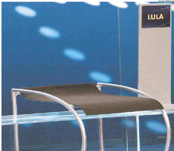
LUGAR VAZIO - A cadeira que seria ocupada por Lula ficou vazia no estúdio: só no início da noite presidente avisou que não compareceria

A ausência do presidente Luiz Inácio Lula da Silva (PT) foi o maior destaque no debate na TV Globo entre candidatos à Presidência, encerrado na madrugada de hoje. A cadeira que deveria ser ocupada pelo petista foi esvaziada, vazia, e o mediador, jornalista Willison Bonner, observou que só por volta de 19 horas Lula avisou que não iria. Ele alegou que os adversários pretendiam transformar o debate em "sessão de agressões", embora, como disse Bonner, as regras não permitissem grosserias. Os candidatos presentes - Geraldo Alckmin (PSDB), Heloisa Helena (PSOL) e Cristovam Buarque (PDT) - criticaram a ausência de Lula e quiseram fazer perguntas a ele. Cristovam apelou aos eleitores para que votem de forma a promover um segundo turno, para dar tempo de se esclarecer o caso do dossiê Vedolin. Alckmin e Heloisa anunciaram um conflito, quando ela disse que o PSDB e o PT erraram na área da segurança - foi uma preocupação dela todo o tempo criticar os governos desses dois partidos. "Eu não sei o que a senadora Heloisa fez pela segurança pública, mas eu fiz", respondeu Alckmin. (PÁG. A10 e A11)