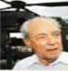
O ministro Waldir Freixo