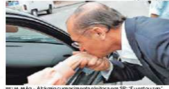
BEIJÁ, MAÍO - Alckmin cumprimenta eleitor em SP: "Eu estou aqui"

Parte do dinheiro que petistas levantaram para comprar o dossiê Vockler saiu dos cofres do jogo do bicho. A revelação foi feita pela Polícia Federal a um grupo de deputados que investigaram a CPI dos Sangueses, que o tucano estava em Mato Grosso. Os indícios são recentes: o tucano e de pagou valor no R$ 1,75 milhão apreendido com petistas. ■ PÁG. A14