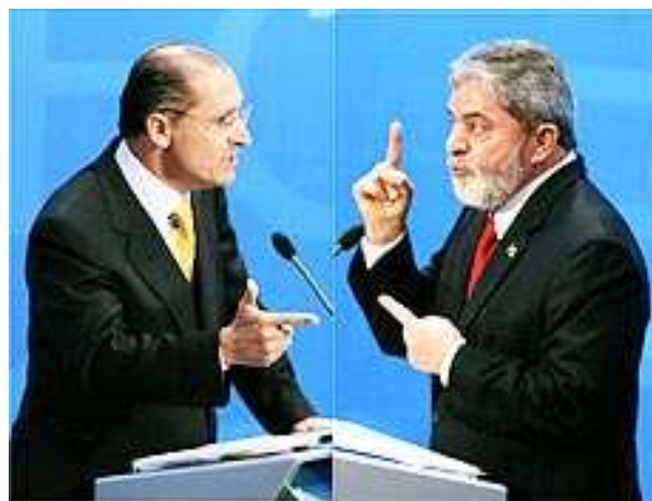
Figura 11 – Lula e Alckmin “frente a frente” na TV Bandeirantes – Segundo turno Fonte: Souza (2007b)

No primeiro confronto (Figura 11) uma surpresa, Alckmin aparece agressivo, bem diferente do comportamento adotado até então na campanha. Seria uma estratégia para tentar reverter a vantagem de Lula que continuava à frente nas pesquisas? Se a intenção era essa foi mal sucedida, ao menos é o que retrata a pesquisa realizada após o debate. Segundo a pesquisa do Instituto Datafolha, publicada dia 10 de outubro, após o primeiro confronto a diferença entre os dois apontava 12 pontos, 56% para Lula e 44% para Alckmin.