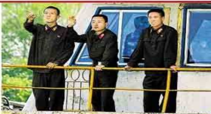
Soldados da Coreia do Norte acenam de saudação para a fronteira com a China, minutos depois do anúncio do teste nuclear

Os presidenciais reconheceram o dilema egípcio no debate. Lula (PT) errou ao dizer que pressionou o maior empresário econômico do Brasil, 20 anos. Alckmin (PSDB) disse que o crescimento em sua gestão em SP foi muito superior à média nacional, o que também não é verdade.