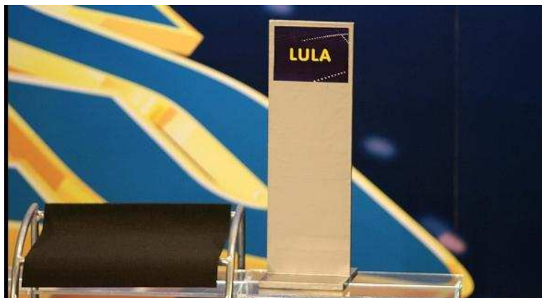
Figura 7– Cadeira de Lula - debate da Cadeira Vazia na TV Globo – Primeiro turno

Apesar de ter sido chamado de debate, o evento promovido pela TV Globo não apresentou as características de um. Já no primeiro bloco, foi possível notar que o evento, apesar de ter um formato de debate, não seria um confronto de idéias e sim um encontro com muitas cordialidades, troca de gentilezas e sorrisos entre os participantes presentes, as intervenções mais duras e agressivas foram destinadas ao ausente.