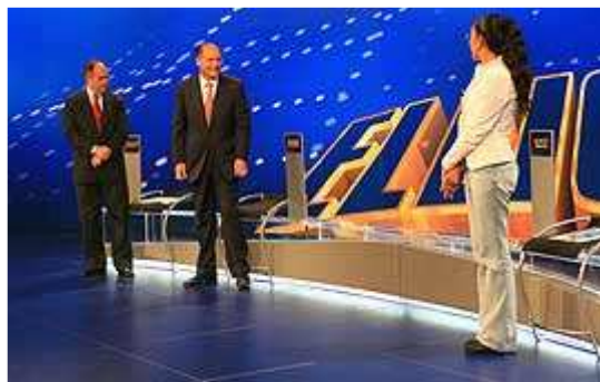
Figura 6– Cenário debate da Cadeira Vazia na TV Globo – Primeiro turno

O encontro foi mediado pelo editor-chefe e apresentador do Jornal Nacional, Willian Bonner (Bonner). O jornalista já havia comandado os debates na eleição de 2002.