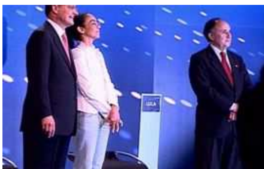
Figura 8 – Candidatos - debate da Cadeira Vazia na TV Globo – Primeiro turno

Os candidatos são mostrados ao lado da cadeira vazia (Figura 8). O texto dizia que os candidatos, antes do debate, pareciam muito à vontade, pois ainda nos camarins fizeram questão de se cumprimentar, “entre os candidatos, a conversa parecia boa”. A cadeira continuava o centro das atenções e personagem de destaque na reportagem “a reservada para o candidato Luiz Inácio Lula da Silva ficou vazia durante todo o debate”. A reportagem salientava também que “os candidatos não perderam nem uma chance de fazer perguntas que ficaram sem respostas: eram para o candidato Lula, que depois de um dia inteiro de expectativa, só avisou que não compareceria às 19h”. A matéria trouxe também a opinião dos candidatos participantes do debate sobre o encontro. Os três aproveitaram para criticar a ausência de Lula.