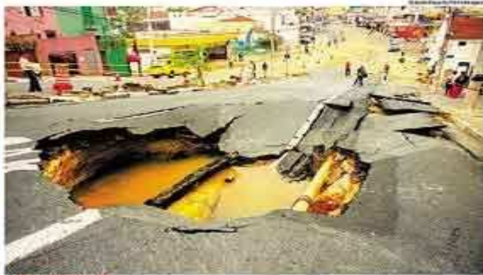
DESMONSTRUÇÃO: Cratera na rua. Prefeitura (Comunidade de São Paulo) pretende pela remoção do site adotar o isolamento de acesso e alagamento de locais e canais, proibição de trânsito no local e instalação de placas para cerca de 32 mil moradores

Para a Agência Internacional de Energia Atômica, o teste quebra a "inocuidade global que se tinha estabelecido há mais de 40 anos".