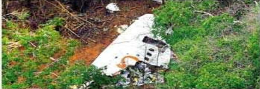
Detritos do Boeing da Gol em AM, pela primeira vez, milhares levaram jornalistas para a região onde o avião caiu