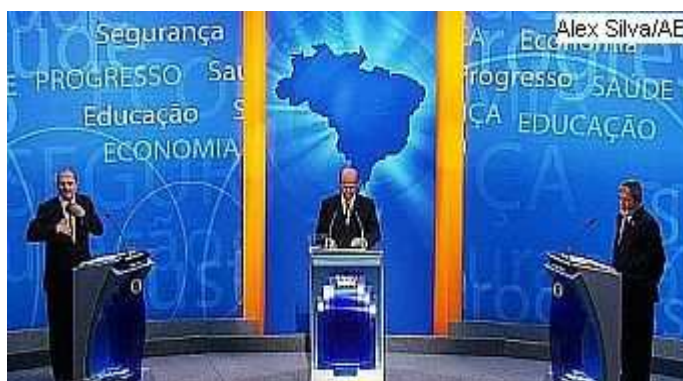
Figura 9 – Cenário debate do Duplo Combate na TV Bandeirantes – Segundo turno

O debate foi mediado pelo jornalista Ricardo Boechat (Boechat), apresentador do Jornal da Band. Ele já havia mediado o debate promovido pela emissora no primeiro turno.