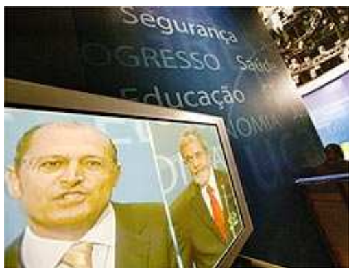
Figura 10 – Imagem da tela dividida no debate na TV Bandeirantes – Segundo turno

Neste espaço do debate quando candidato pergunta para candidato a tela é dividida (Figura 10) e os dois aparecem lado a lado, podendo-se assim visualizar as expressões do candidato que está sendo questionado. Enquanto Alckmin fala, Lula sacode a cabeça lentamente, aperta os lábios várias vezes e se movimenta de uma lado para outro, atrás da tribuna. Transparece irritação.