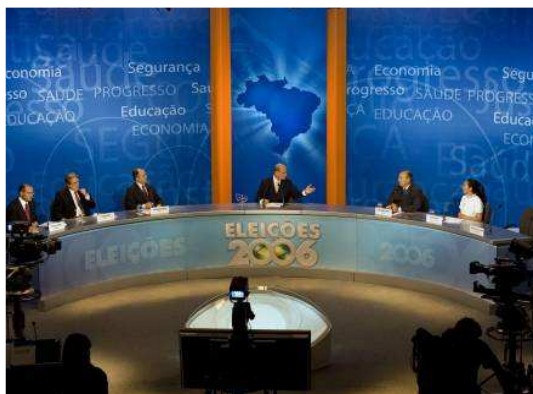
Figura 1 – Cenário debate na TV Bandeirantes – Primeiro turno

A TV Bandeirantes seguiu a tradição de realizar o primeiro debate entre os candidatos à presidência. Foi um encontro tranquilo sem muitas críticas e divergências entre os participantes. Apesar da cadeira vazia integrar o cenário do debate, como no primeiro debate da Rede Globo, perguntas não puderam ser direcionadas ao ausente. A ausência de Lula foi lembrada e criticada pelos presidenciáveis.