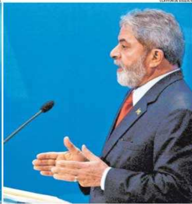
DUELLO - Alckmin e Lula no estúdio, trocando acusações. Do lado de fora, dois telões mostram o debate para cerca de 500 cabos eleitorais do PT, que empunhavam bandeiras

O primeiro debate do segundo turno da eleição presidencial, ontem, teve poucas propostas e muitas acusações, algumas vezes quase chegando ao bate-boca. "Não diz a verdade", "fraco", "arrogante" e "leviano" foram expressões usadas de lado a lado. O candidato PSDB, Geral-