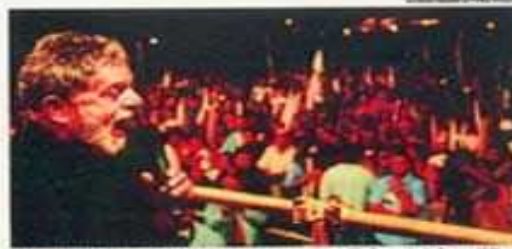
Na noite de debate, o presidente Lula dividiu o palco com o ex-vice Lula em São Bernardo do Campo (SP).