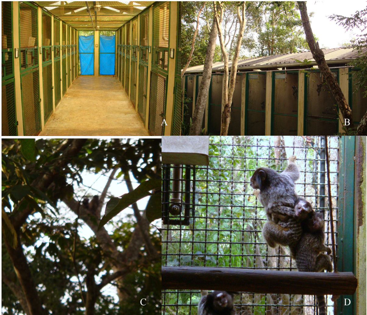
Figura 1. Galpão de calitriquídeos do Centro de Primatologia da UnB. (a) Corredor central, mostrando a entrada dos viveiros dos lados direito e esquerdo. (b) Visão externa. (c) C. penicillata na natureza que vivem na mata próxima aos galpões. (d) Grupo familiar em viveiro com puleiros e bebedouro.

uma dosagem de 14 mg via oral por animal. Tal medida foi adotada devido à dificuldade em fazer a dosagem com base no peso individual.