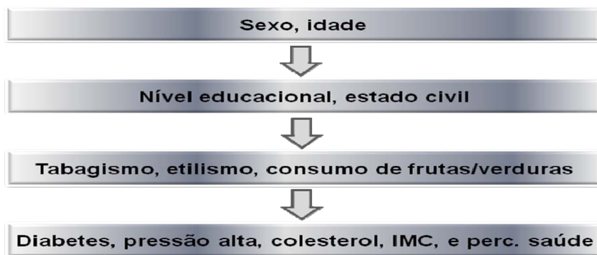
Figura 2 Apresenta-se o modelo hierárquico para análise de Regressão.

Os níveis de hierarquização, bem como, a ordem de entrada das variáveis no modelo são apresentados na Figura 2.