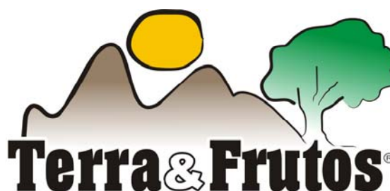
Figura 2 – Identidade visual da marca Terra e Frutos

A turma 9 TAC preparou, a partir da oficina de construção de marcas, várias propostas que foram estudadas em seu aspecto mercadológico por técnicos do GEPES. De fato, combinando os elementos oferecidos pelos alunos – a terra, os frutos, as plantas, pessoas oferecendo frutos da terra etc., chegou-se ao aspecto visual da marca, aprovada pelos educandos, conforme figura 2.