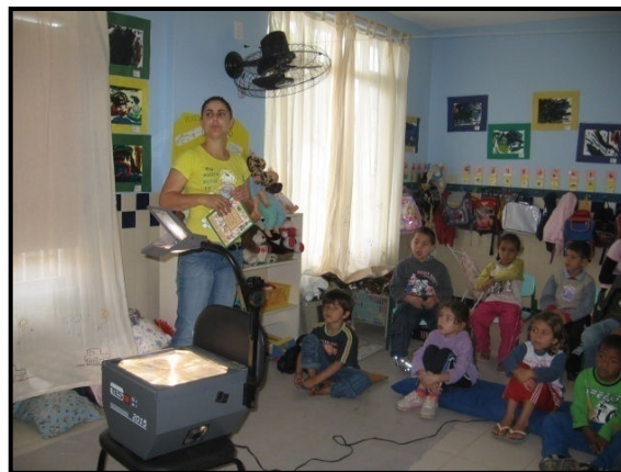
Figura 3- Contação de história com o retroprojektor.

A história que escolhi para contar foi “De Pergunta em Pergunta”, do livro “Gente, bicho e planta: o mundo me encanta” de Ana Maria Machado 36 . Este livro fala da importância de cuidarmos do eco-sistema do planeta. No entanto, quando contei a história dei mais ênfase a outra mensagem que estava no texto, que era a função do pesquisador de perguntar para desvendar um mistério. A história trata de uma cidade que ficava na Inglaterra e lá havia um mistério que ninguém conseguia desvendar. Esta cidade não ficava nem pobre, nem rica: