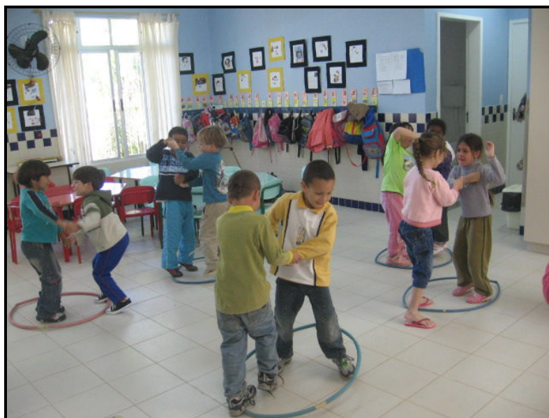
Figura 7- Meninos dançam com meninos e meninas dançam com meninas.