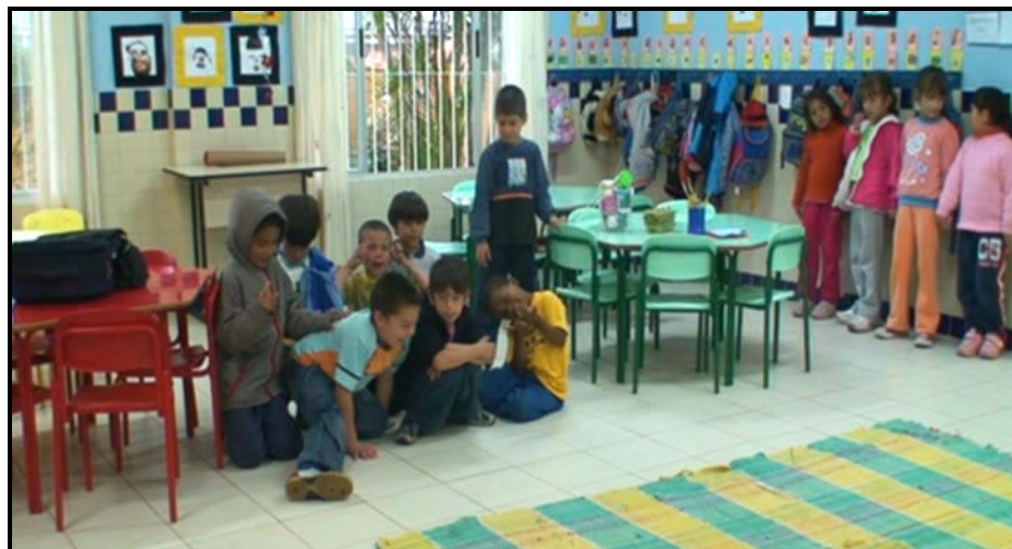
Figura 6- Separação entre meninos e meninas.

Outra situação evidencia a dificuldade de interação entre meninos e meninas, cuja proposta era para que todas as crianças dançassem a música “Aquarela”. Neste dia as crianças formaram grupos separados: um de meninas e outro de meninos. No final da música sugeri que da próxima vez deveriam misturar os grupos, formando grupos mistos de meninos e meninas. Como descrito pela professora Beth: