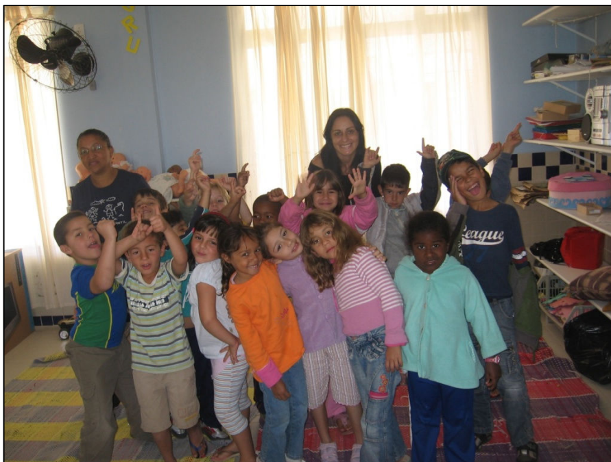
Figura 1- As crianças e as professoras do grupo 6.