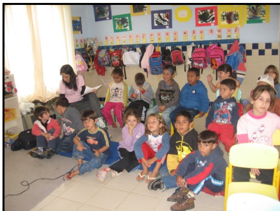
Figura 3- As crianças envolvidas com a história.