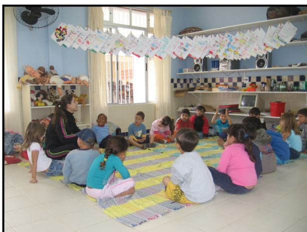
Figura 4- A roda para a conversa inicial no tapete.

1º momento- A conversa inicial acontecia sempre com todas as crianças sentadas em círculo no tapete, onde relembávamos o que havíamos feito no encontro anterior. Em seguida falávamos sobre a proposta de trabalho do dia, combinávamos o local onde iríamos realizar as tarefas, como elas seriam feitas, apresentávamos algum material que seria usado, falávamos sobre o tipo de música, etc.