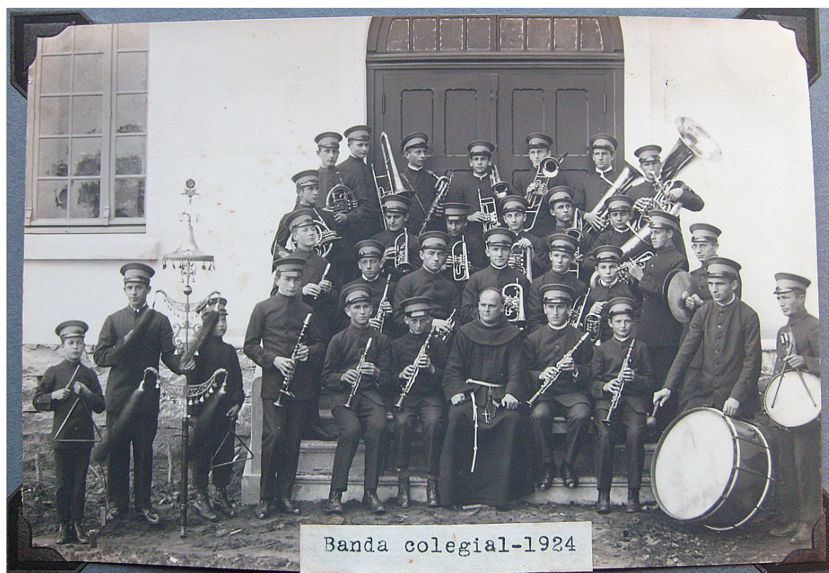
Figura 3: Banda colegial do Colégio São Luiz, Rio Negro, 1924