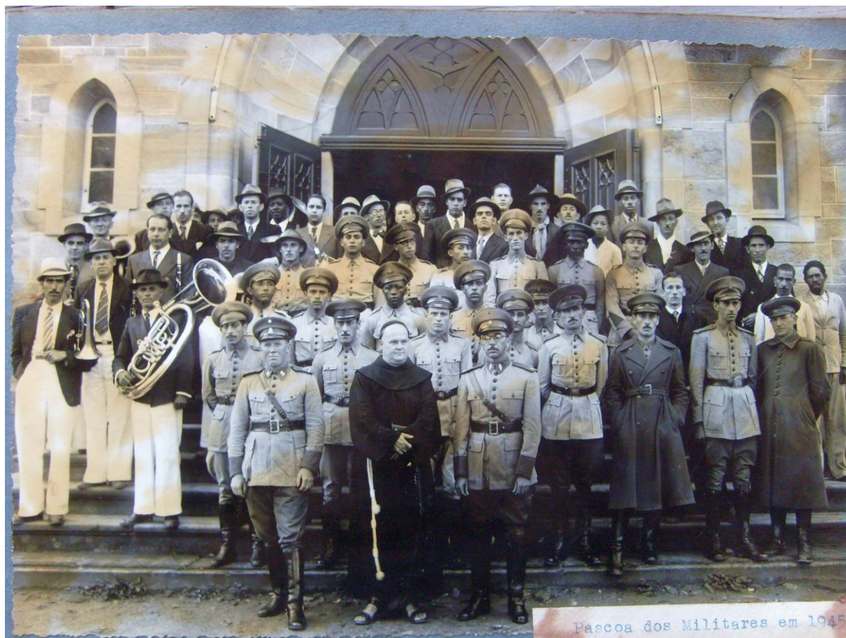
Figura 7: Cerimônias da “Páscoa dos Militares” (Catedral Diocesana, Lages, 1945)