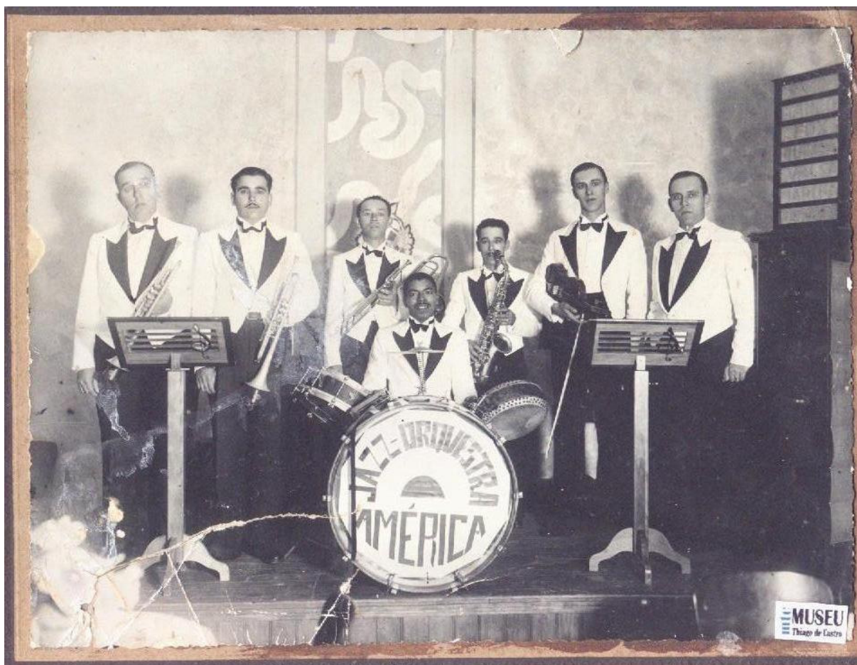
Figura 1: Jazz-Orquestra América (data e autoria da fotografia desconhecidas).