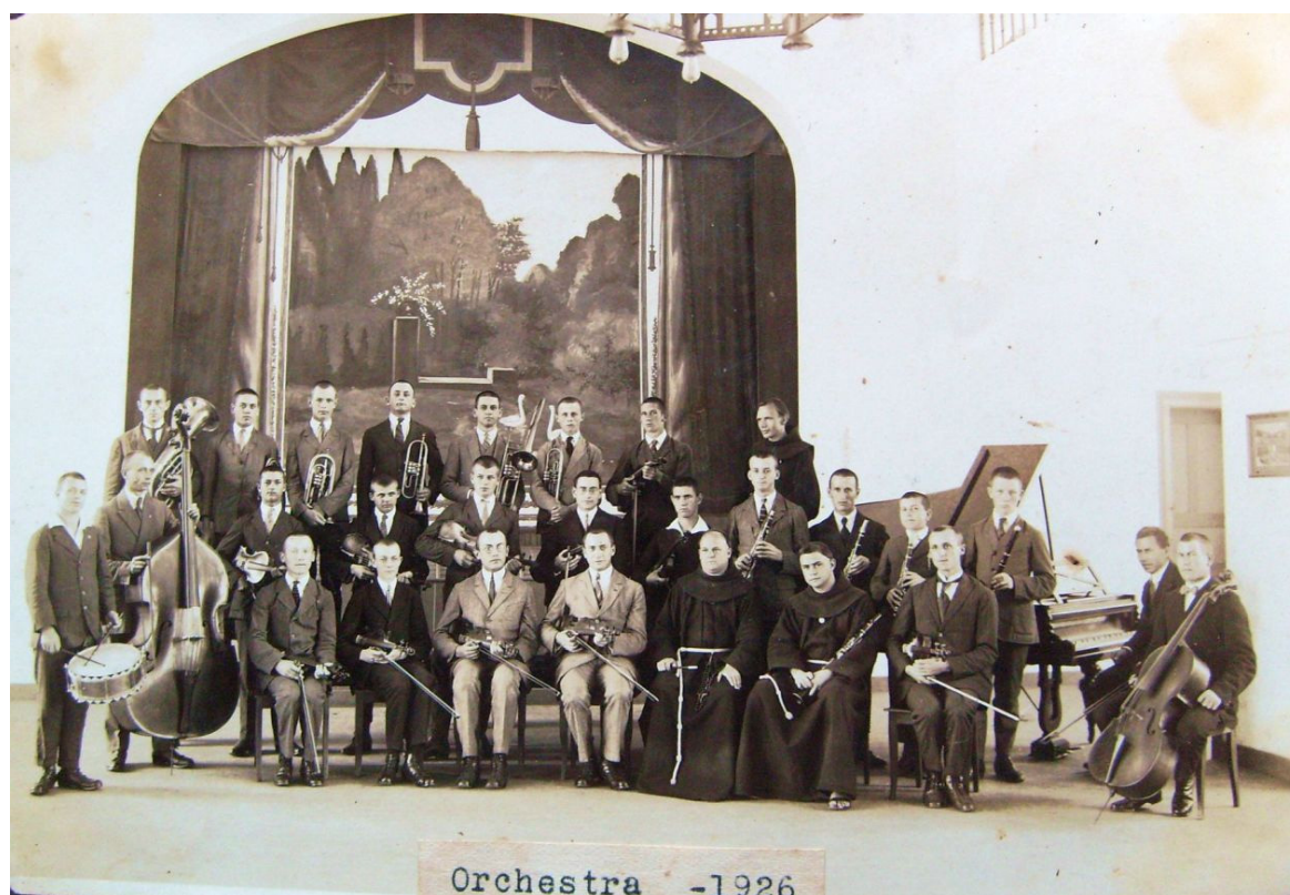
Figura 4: Orquestra do Colégio São Luiz, Rio Negro, 1926 (Autoria da foto desconhecida). Fonte: BCSJ1