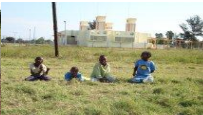
Figura 9: Campo de Futebol SONEF/ Província de Maputo.