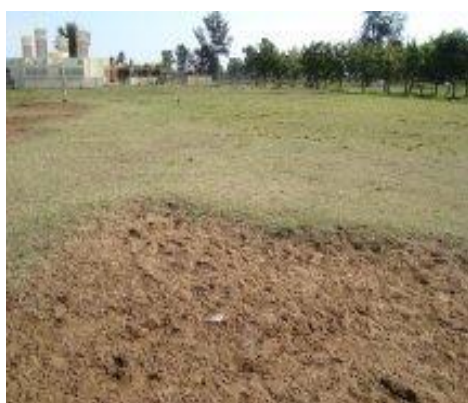
Figura 8: Campo de Futebol SONEF

O espaço do SONEF está situado nas proximidades da auto-estrada que liga Maputo - Wittbank, ficando próximo a uma estação de venda e produção de carvão. Também é possível identificar casas de alvenaria em seu redor. Assim como também comércio de bares e oficinas auto-mecânicas. Não há nenhum controle dos frequentadores do espaço e o grau de conservação é ruim. Não apresenta paredes com pichações , nem material impresso fixado. O grau de limpeza da área é precário, não existindo pessoa responsável pela área de vestiário/banheiro. Estes banheiros são pequenos e com um aspecto ruim de conservação e limpeza. Em geral os frequentadores costumam jogar uniformizados, sendo frequente a disputa amadora entre equipes que se encontram semanalmente aos finais de semana neste local, já que o espaço é usado por várias comunidades próximas. Aqui os convívios são rotativos, pois se realizam sempre no final de cada mês e sempre na casa de um dos EL, também aqui regada de cerveja e discussões sobre o esporte nacional e internacional. A faixa etária dos frequentadores desse espaço é em sua maioria de jovens e adultos que dividem o espaço para jogos de futebol e ocupando o campo as equipes que chegarem primeiro ao local.