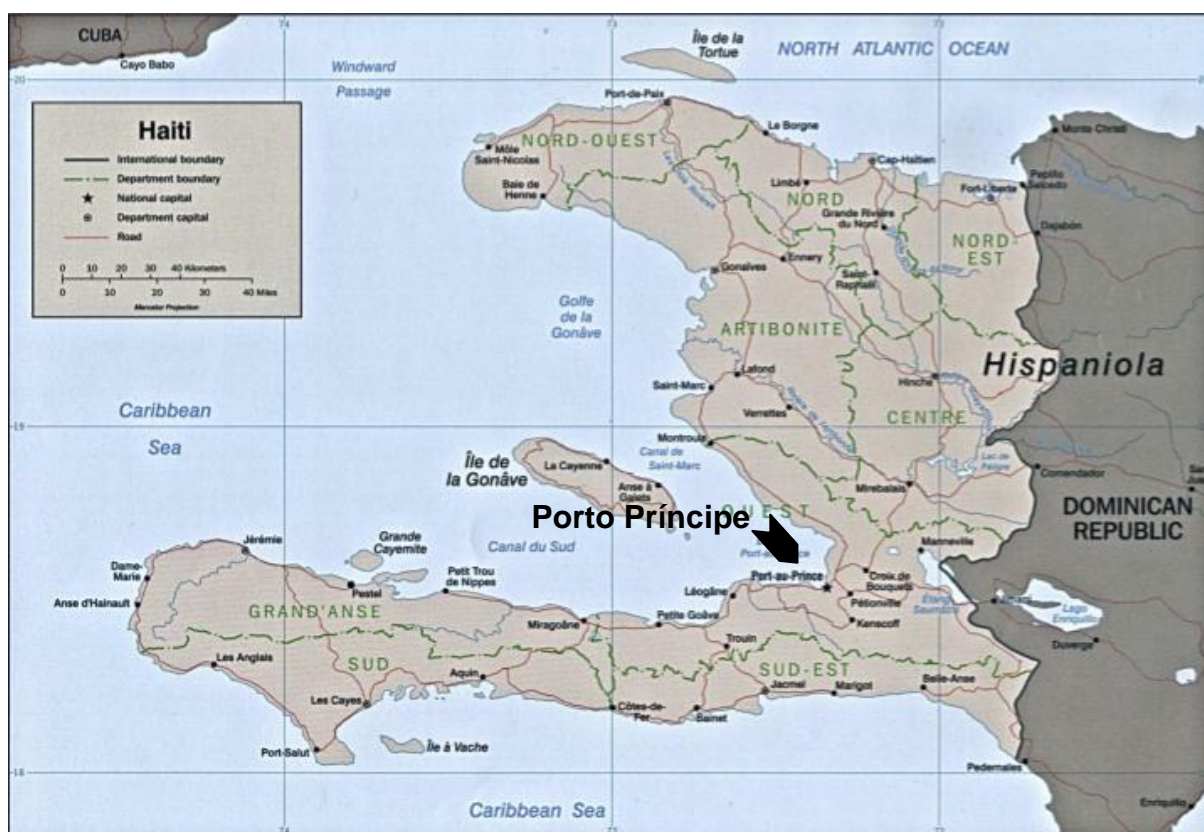
Figura 2: Mapa do Haiti.

A República do Haiti possui sua capital em Porto Príncipe (Port-au-Prince), e está dividida administrativamente em 10 departamentos. O clima do país é tropical e o relevo, montanhoso. Está sujeito a tempestades tropicais entre junho e outubro, e também a terremotos. Seus recursos naturais mais abundantes são a bauxita, o cobre, o carbonato de cálcio, o ouro e o mármore, bem como a força hidrelétrica.