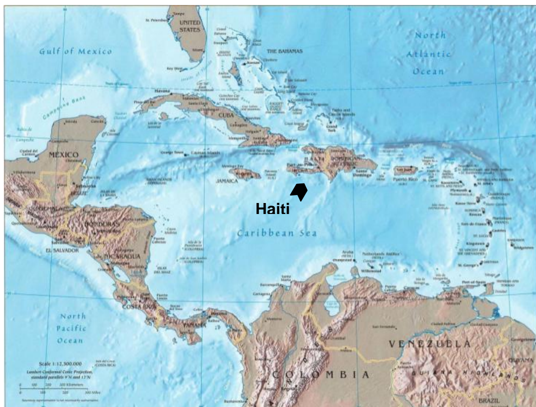
Figura 1: Mapa da América Central e o Caribe.

O Haiti é um pequeno país; sua área total é de apenas 27.750 km 2 – pouco menor que o estado brasileiro do Alagoas 2 . Localiza-se na parte oeste da ilha de Hispaníola – a qual divide com a República Dominicana – no Caribe. A ilha, de origem vulcânica, é banhada pelo Mar do Caribe e pelo Oceano Atlântico Norte.