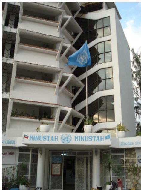
Hotel Christopher, Sede da MINUSTAH.