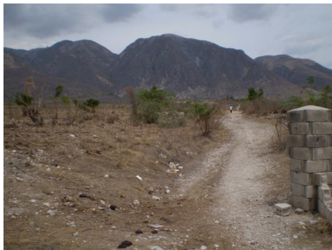
A paisagem de devastação é fruto do desmatamento com vistas à queima da madeira para produção de energia pouco eficiente e altamente poluidora.