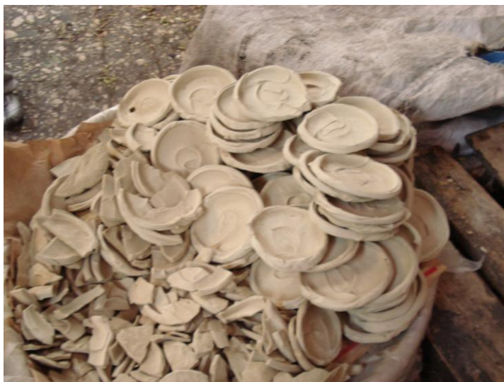
Bolachas feitas de barro servem de alimento no Haiti.