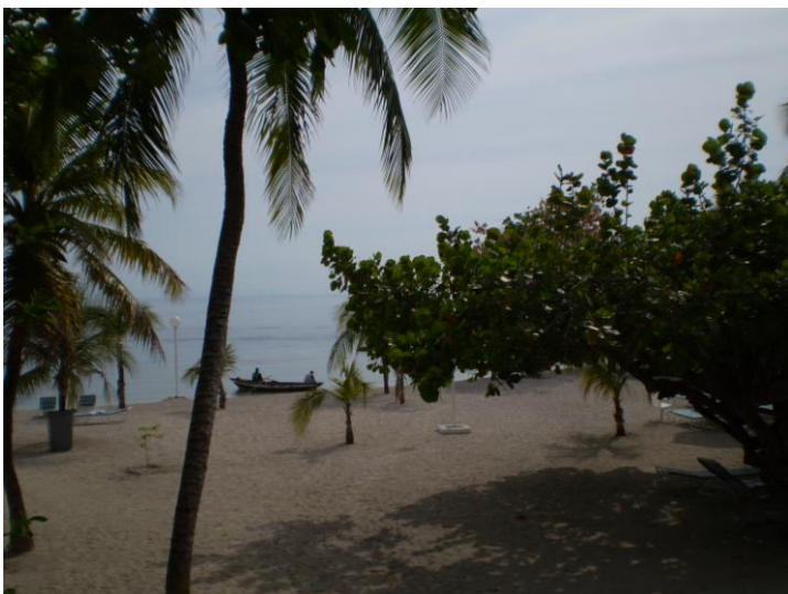
Imagem da praia de Kaliko, há apenas uma hora de Porto Príncipe.

Por fim, o contraste entre a típica paisagem de um país caribenho – com suas praias de água transparente – e a paisagem mais vista no Haiti – de devastação e poluição permanente – apenas reforçam a ideia de que se trata de um país marcado por gritantes diferenças.