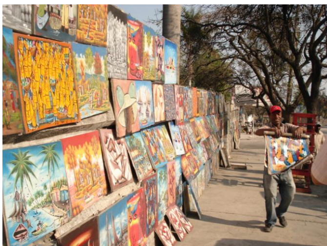
Pinturas em arte naïf são vendidas nas ruas.

Nas ruas, essa dicotomia também é visível. É comum encontrarmos haitianos vendendo pinturas em arte naïf nas ruas. Não há venda sem negociação; às vezes, o comprador pode ficar horas em meio a sete ou oito vendedores, discutindo preços. Em contraste, outro tipo de negociação acontece nos mercados de rua, onde 80% da população garante seu sustento por meio, basicamente, de trocas. Vende-se principalmente alimentos, desde frutas até carne. Muitos animais, ainda vivos, são carneados ali mesmo, na rua. As mulheres constituem a maior parte dos vendedores, e é comum vê-las nas ruas carregando desde baldes até televisores na cabeça.