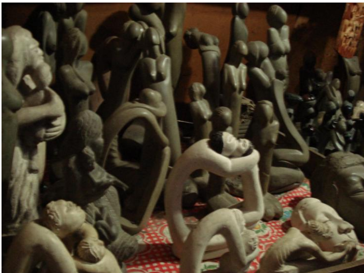
Estátuas, em todos os tamanhos, são vendidas no mercado de Porto Príncipe.

No mercado de Porto Príncipe, lindas pinturas em arte naïf , escola tradicional no Haiti, além de esculturas em todos os tamanhos, dividem espaço com carne putrefata, de odor nauseante, e bolachas feitas de barro, que saciam a fome das crianças.