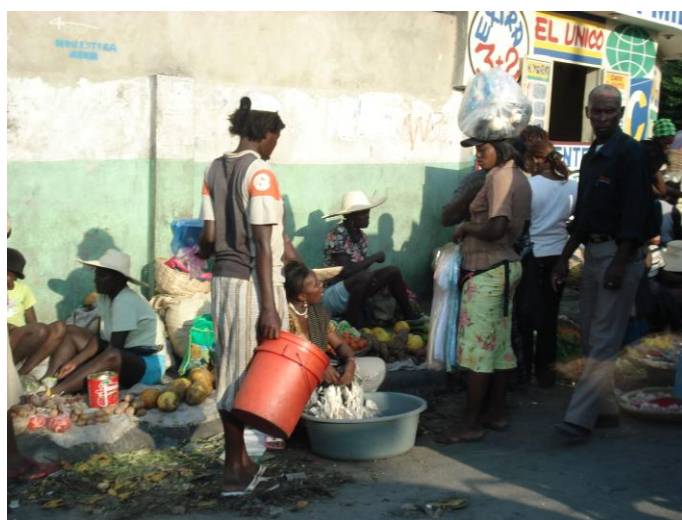
Nos mercados de rua são vendidos todos os tipos de produtos, desde alimentos até aparelhos eletrônicos.