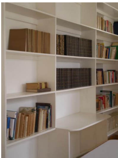
Biblioteca do Centro de Estudos Brasileiros Celso Ortega Terra.