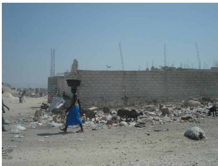
Na municipalidade de Delmas, moradores caminham entre o lixo.