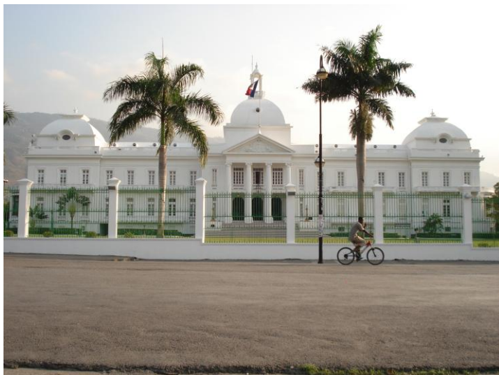
Imagem do Palácio Nacional haitiano.

Em contraste com a beleza dos prédios que abrigam as enfraquecidas instituições haitianas, a maior parte da população vive em casebres, em condições sub-humanas.