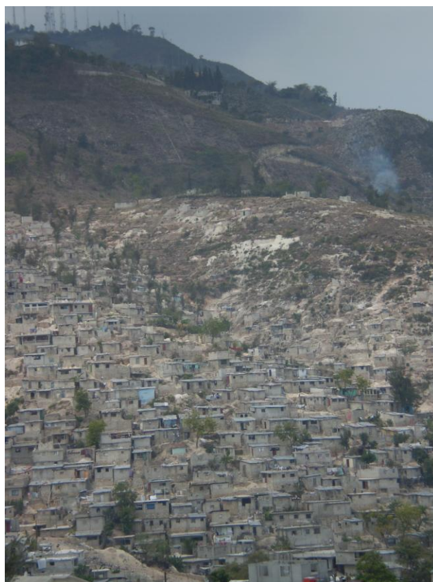
A maior parte da população haitiana vive em favelas.