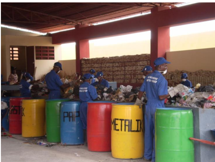
Moradores de Carrefour Feuilles trabalham na coleta, separação e transformação do lixo.