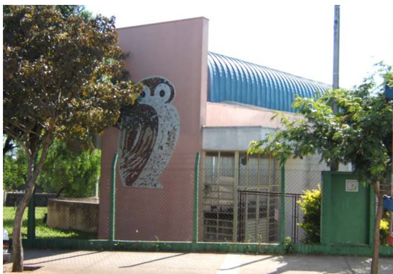
FIGURA 4: Escola do Futuro da EMEB “Antônio Stella Moruzzi”.

Na concepção do projeto foram observados os seguintes aspectos: uso de cores nos elementos arquitetônicos; conforto ambiental (acústico, térmico e de luminosidade); livre acesso ao acervo bibliográfico; sala multiuso para reuniões, cursos, palestras, oficinas; pátio externo integrado com mesas e bancos para leitura ao ar livre e jogos; facilidade de acesso aos portadores de deficiências físicas; uma porta para a escola e outra para a comunidade (ESCOLA do Futuro..., 2002, p. A3).