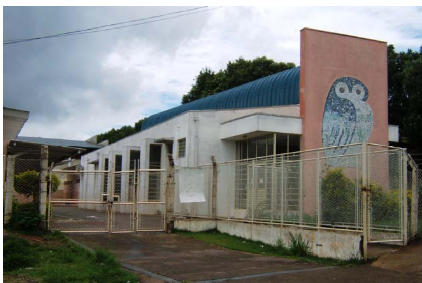
FIGURA 1: Escola do Futuro da EMEB “Janete Maria Martinelli Lia”.

Consoante ao objetivo de “Modernizar as estruturas escolares, oferecendo condições materiais para o desenvolvimento dos educandos” (PARTIDO DOS TRABALHADORES, 2001, p. 4), a SMEC lançou o projeto das Escolas do Futuro, que previa a construção de um prédio contíguo a todas as EMEBs da rede, onde funcionariam uma biblioteca e um laboratório de informática.