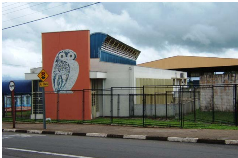
FIGURA 6: Escola do Futuro da EMEB “Angelina Dagnone de Melo”, sexta e última unidade inaugurada na primeira gestão petista.

Como parte integrante desse projeto, todas as EMEBs foram contempladas com laboratórios de informática, equipados com computadores e impressoras comprados com recursos do Fundo de Universalização dos Serviços de Telecomunicações (FUST). Por meio desses laboratórios, a expectativa da SMEC era promover a “alfabetização digital” de todos os alunos da rede municipal (PREFEITURA entrega..., 2002, p. A4).