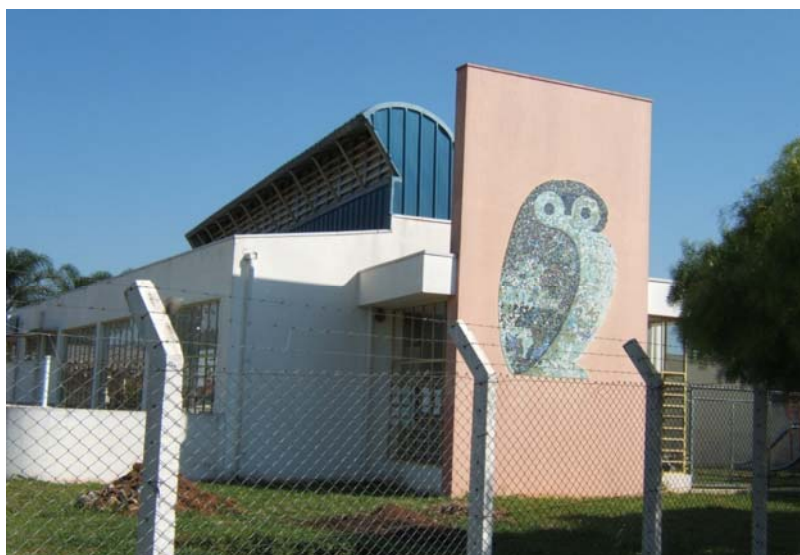
FIGURA 2: Escola do Futuro da EMEB “Dalila Galli”.

O respaldo legal do projeto veio por meio do Decreto nº 155, de novembro de 2001, que criou a biblioteca escolar nas oito EMEBs de São Carlos. Como justificativa, o Prefeito Municipal declarou ter considerado: a meta prioritária da SMEC de “enfrentamento da exclusão social através da democratização do acesso ao conhecimento e à informação”; “o reconhecimento social da escola como lócus privilegiado de produção e difusão do conhecimento”; o fato de que as EMEBs “situam-se em regiões de periferia da cidade, atendendo a população com dificuldade de acesso a bens culturais e educacionais”; e “o papel social que estas escolas desenvolvem em relação à comunidade de alunos, educadores e funcionários” (SÃO CARLOS, 2001b).