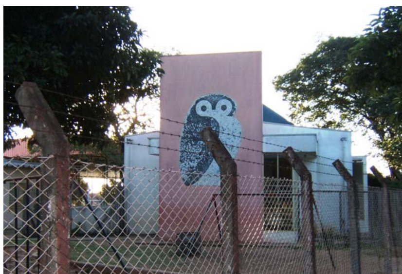
FIGURA 5: Escola do Futuro da EMEB “Carmine Botta”.

Como não havia disponibilidade orçamentária para a construção imediata das Escolas do Futuro nas oito EMEBs da rede, foram definidas, em discussão com os diretores das unidades, quais seriam as prioridades. De acordo com a localização das escolas, visando atender o maior número possível de alunos, optou-se pela construção das cinco primeiras Escolas do Futuro nas seguintes EMEBs: “Arthur Natalino Derigge” (bairro Antenor Garcia), “Dalila Galli” (bairro Jardim Jockey Clube), “Janete Maria Martinelli Lia” (bairro Pacaembu), “Antônio Stella Moruzzi” (bairro Jardim Tangará) e “Carmine Botta” (bairro Boa Vista).