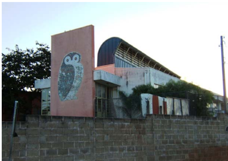
FIGURA 3: Escola do Futuro da EMEB “Arthur Natalino Derigge”.

Na concepção do projeto foram observados os seguintes aspectos: uso de cores nos elementos arquitetônicos; conforto ambiental (acústico, térmico e de luminosidade); livre acesso ao acervo bibliográfico; sala multiuso para reuniões, cursos, palestras, oficinas; pátio externo integrado com mesas e bancos para leitura ao ar livre e jogos; facilidade de acesso aos portadores de deficiências físicas; uma porta para a escola e outra para a comunidade (ESCOLA do Futuro..., 2002, p. A3).