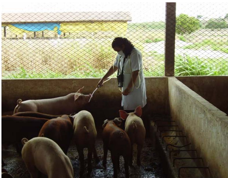
Figura 2. Monitor de gases digital portátil (PHD5 Biosystems®)