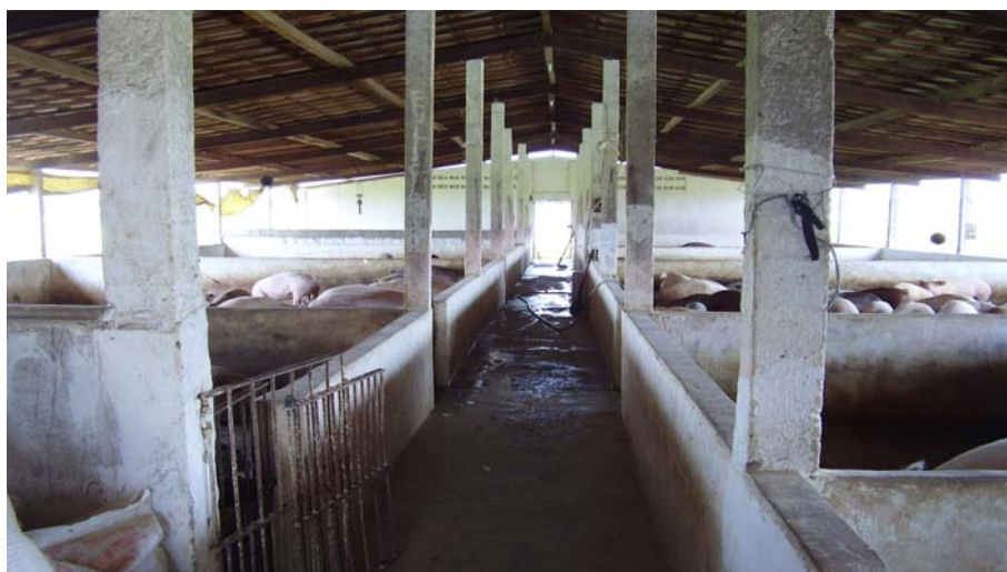
Figura 1. Vista do interior do galpão de creche e terminação

A edificação da instalação tinha orientação no sentido leste-oeste, construída em paredes de alvenaria, pilares de concreto armado, pé direito 2,45 m, telhado em duas águas, com cobertura de telha de cerâmica apoiada sobre treliças de madeira. O comprimento do galpão (Figura1) era de 31,1 m e largura de 13,55 m constituindo uma área total de 421,4 m 2 , situada a de 54 m do galpão de maternidade.