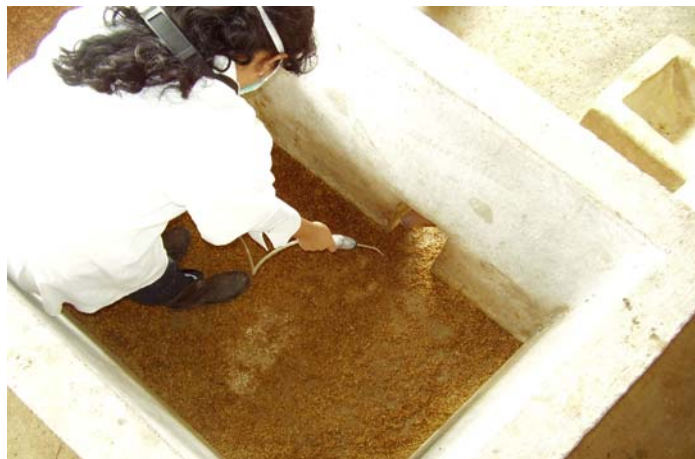
Figura 4. Monitor de gases portátil digital (Biosystems®)

Para avaliação da qualidade do ar na maternidade foram medidas as concentrações dos gases O_2 (oxigênio), NH_3 (amônia), CH_4 (metano) e CO (monóxido de carbono), no abrigo escamoteador (Figura 4) por apresentar um grande volume de dejetos dos leitões, utilizando-se um monitor de gases digital portátil (PHD5 Biosystems®), configurado para leitura contínua dos gases.