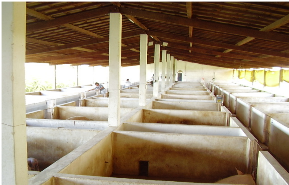
Figura 3 – interior da instalação de maternidade

O galpão era formado de 52 baias, cada baia possuía A piso= 9,1 \text{ m}^2 ( 2,60 \text{ m} \times 3,5 \text{ m} ) em comunicação com o abrigo escamoteador, este com A piso = 1,13 \text{ m}^2 ( 1,3 \text{ m} \times 0,87 \text{ m} ) de piso cimentado. Os comedouros eram de alvenaria, localizados junto ao corredor de serviço, que media 1,10 \text{ m} de largura e muretas internas com 0,80 \text{ m} de altura. A parte externa do galpão tinha muretas de 1,10 \text{ m} de altura com telas de arame galvanizado até a altura do telhado e cortinas de polietileno na cor amarela, com acionamento manual de cima para baixo; o piso interno e o passeio que circundava o