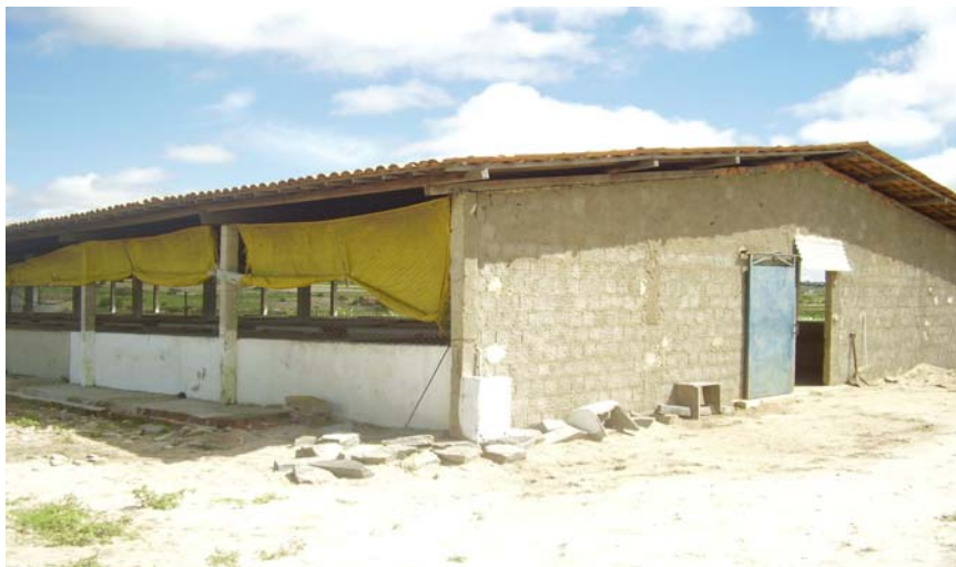
Figural. Vista geral do galpão de maternidade

A edificação da instalação de maternidade tinha orientação no sentido leste-oeste, construída em paredes de alvenaria, pilares de concreto armado, pé direito 2,7 m, telhado em duas águas, com cobertura telha cerâmica apoiada sobre treliças de madeira. O galpão (Figuras 1, 2 e 3) possui comprimento de 42,8 m e largura de 9,7 m, constituindo uma área total de 415,16 m 2 .