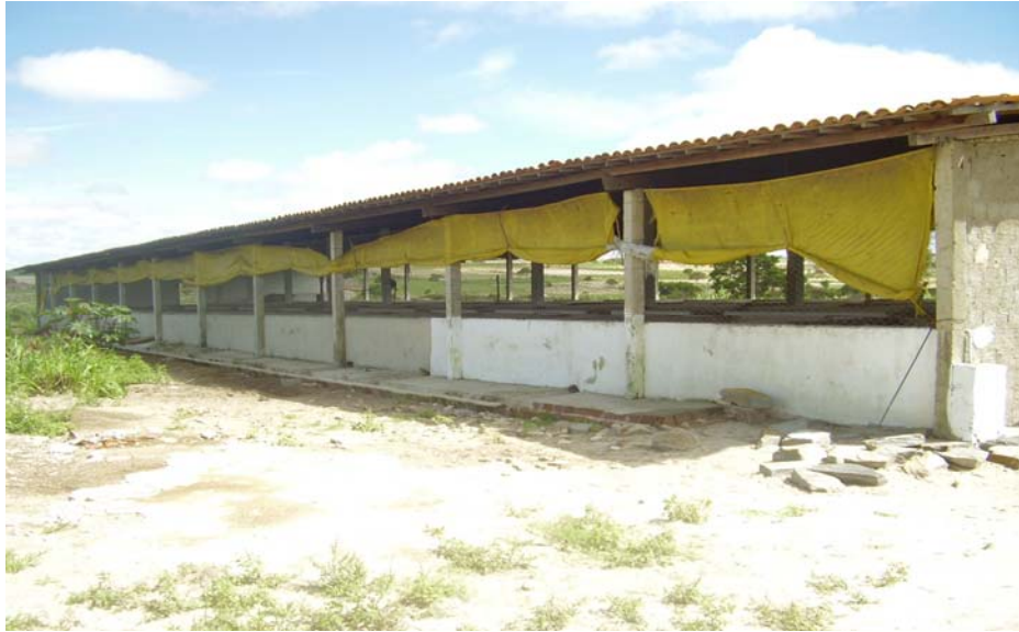
Figura 2. Vista lateral do galpão de maternidade