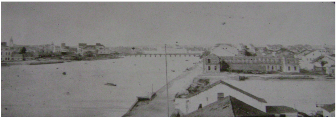
Panorama do Recife, 1855 – Foto: 2. Augusto Stahl.

Navegável por duas léguas a partir da sua foz, o Capibaribe por muito tempo continuaria sendo uma via de acesso privilegiada para os bairros mais distantes. Entre o final do século dezoito e início do dezenove, se realizavam nos bairros que circundavam o centro da cidade festas populares em pleno verão que atraíam muitas pessoas rio acima ao encontro dos fandangos, congos, bumbas-meu-boi, sambas presépios e até recitais de poesia. Tudo principalmente através das canoas. A demanda por essa atividade era tanta que ela chegou até a ser reconhecida pela justiça local e, de acordo com Cabral de Mello ( apud. CARVALHO, 1997), os canoeiros do Recife chegaram, inclusive, a ter uma capela própria, onde celebravam a festa de Nossa Senhora da Conceição, a padroeira da cidade, enquanto os de Olinda comemoravam o dia de Nossa Senhora do Rosário, a protetora dos negros.