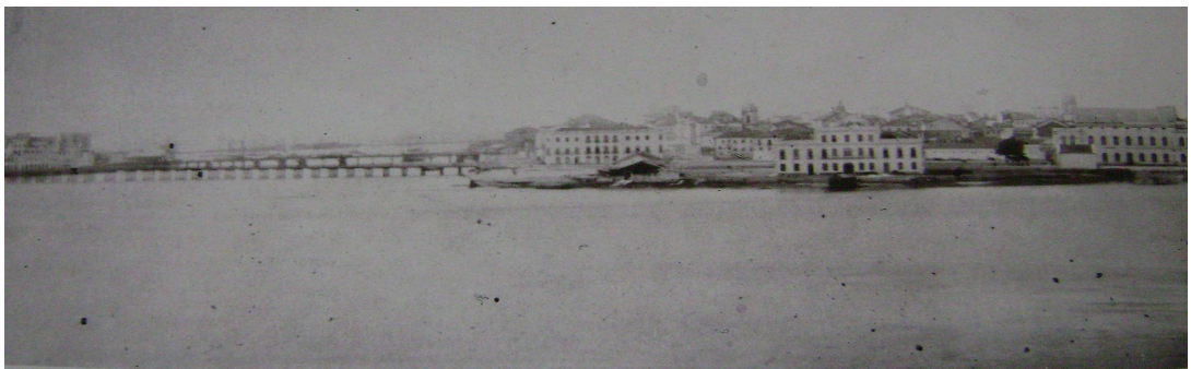
Panorama do Recife, 1855 – Foto: 1. Augusto Stahl.

Na capital pernambucana, assim como na maioria das cidades brasileiras dessa época, podia-se encontrar negros realizando os mais diversos tipos de trabalho. Em destaque, estavam os típicos canoeiros, fundamentais numa cidade recortada por rios e que por isso, devia ser uma profissão procurada por muitos libertos, negros e pardos livres, principalmente quando era possível ter uma canoa própria, pois era um negócio que poderia combinar com a pesca e a pega de caranguejo. E não havia como ser diferente, pois, principalmente na época pré-industrial, os rios do Recife eram as estradas por onde tudo e todos circulavam, o que marcava fortemente a personalidade da cidade. Segundo Carvalho (1997), por essas estradas d'água vinha o açúcar produzido na várzea do rio Capibaribe e, à medida que o tempo passou, a cidade foi crescendo seguindo as margens desse rio, sendo ocupadas por moradias de todos os tamanhos, intensificando-se o tráfego fluvial de pessoas, mercadorias e animais domésticos.