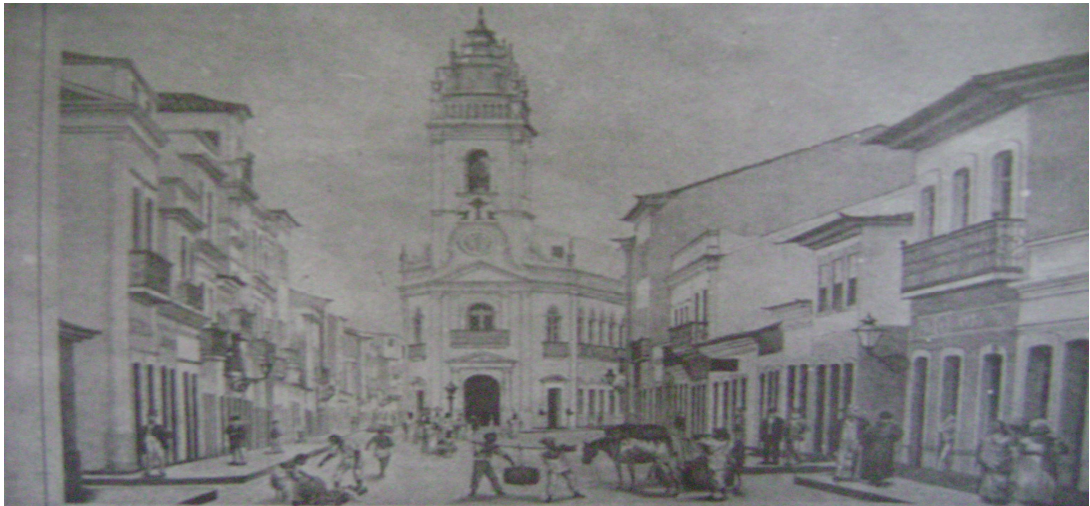
Pátio do Terço – L. Krauss – Carl, 1885.

Não se pode negar que era uma reivindicação um tanto pertinente a que fazia a Igreja de São José do Ribamar, uma vez que, além de sua localização central, como salientou o próprio Bispo, era o seu padroeiro que dava nome a “nova” freguesia. Apesar disso, sua pretensão esbarrou na questão da estrutura dita necessária para acomodar uma igreja matriz. Mesmo assim, as celebrações corriqueiras não deixaram de ser realizadas nas suas dependências, tanto que passaria a dividir algumas dessas atividades com outra igreja no pátio do Terço, também localizada no bairro de S. José e freqüentada basicamente por negros e que passara a ser, provisoriamente, a nova matriz da freguesia.