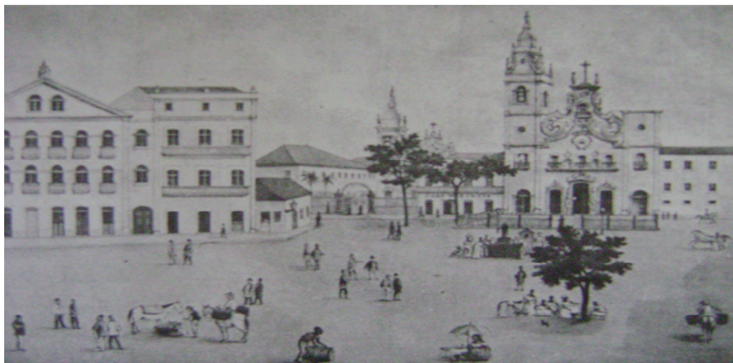
Pátio do Carmo: L. Krauss – Carl, 1885.

Mas esse mesmo comércio também empregava jornaleiros, artesãos, aprendizes livres e libertos, sem falar dos muitos ambulantes que vendiam de tudo, competindo até com os escravos. Na ilha de Santo Antônio, inclusive, havia uma certa divisão geográfica. A parte mais rica era ao norte e ao sul a mais pobre, que posteriormente viraria a freguesia de São José. Mas, além do comércio, era nas casas que a maioria dos cativos trabalhava mesmo. Tratava-se do único bairro que da cidade onde havia mais cativas do que cativos, o que sugere uma relativa intensidade de atividades femininas no bairro (CARVALHO, 2001).