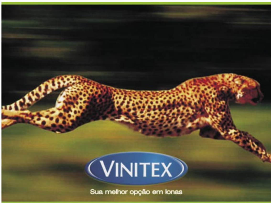
Figura 5 - Exercício de criação da agência Projeta Propaganda e Marketing para anúncio das Lonas Vinitex

Mas o que o ocorre com a construção de analogias na mensagem da peça publicitária exibida na figura 5.