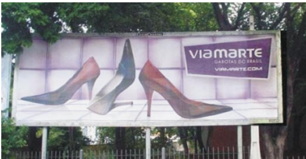
Figura 8 - Outdoor Viamarte

Os aspectos qualitativos permeiam as reflexões possíveis que emergem da associação via marte/celebridade. O nível de iconidade desta peça é mais acentuado que o da anterior.