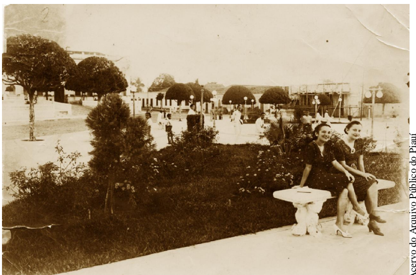
Foto 2 Pça. Pedro II

É um dos espaços públicos mais antigos e mais movimentados. Até os anos de 1920, chamava-se Praça Aquidabã. Na década de 1930, passou por alguns melhoramentos sendo reinaugurada como Pedro II, numa homenagem ao ex-imperador do Brasil e esposo da mulher (Teresa Cristina) que inspirou o nome da cidade. Para a Pedro II convergiam pessoas de todos os segmentos sociais e, por ser bem centralizada, era ponto de passagem, um não-lugar , para muitos que transitavam entre o lar e o trabalho, para outros, o principal lugar de entretenimento. Em torno dela ficava alguns dos lugares mais bem freqüentados dos teresinenses: O Teatro 4 de Setembro , o Cine Rex , o Bar Carnaúba , a Sorveteria Americana e nas adjacências, o Cine São Luíse o Clube dos Diários .