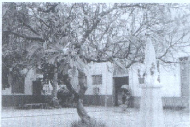
Foto 11 Santa Casa de Misericórdia de Teresina Pé de Jasmim, com mais de um século (1860?). Ao lado da Estátua de Nossa Senhora de Fátima

As doenças que se pegava era cavalo de crista e blenorragia .[...] O cavalo de crista é o condiloma venéreo . Era tratado da forma mais brutescas que pode existir: era com Ácido Fênico , pingando o ácido fênico em cima. Caía imediatamente, mas ficava a ferida... Um buraco terrível.[...] E depois passaram a tratar com podocilina , solução de podocilina , que ainda hoje existe. A blenorragia era uma infecção bacteriana que atacava principalmente a próstata . Então se tratava...Naquela época não existia antibiótico, o que existia era prodjetório . Naquele tempo, era a medicação salvadora; mas, era uma medicação para animal, pra cavalo.[...] Era injetável. Dava uma febre de quarenta, quarenta e um graus, como reação. Era uma coisa horrível, horrível, horrível mesmo! Então existia, também na época um profissional de idade mais antiga que pegava um dente de alho , picotava ele com um alfinete ou com uma agulha de costura e colocava no reto do paciente...Que dava uma febre de quarenta graus. Aí, se matava essa infecção. Era o que se fazia na época.