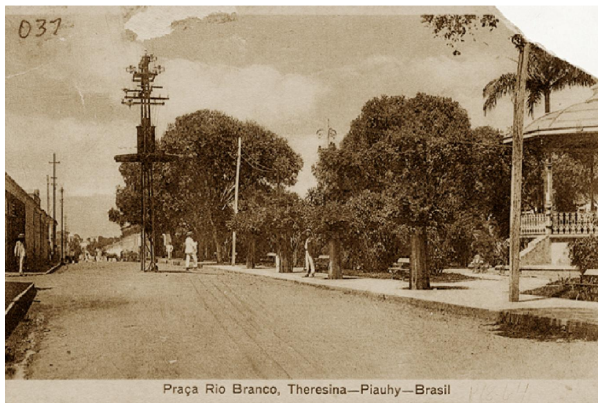
Foto 1 Pça. Rio Branco

Era uma casa grande. E ao lado tinha uma sinuca e uma torrefação de café. O café era torrado ali mesmo no recinto [...] Tinha restaurante, era um dos melhores restaurantes de Teresina. Ia família, muitas famílias. Motorista de táxi. Não era, táxi não existia, era carro de aluguel. [...] O Café Avenida era o mesmo estilo. Lá só não tinha restaurante, era o café do dinheiro, daqueles políticos... se destacava mais um pouco dali porque você sabe que um bar, um restaurante assim vai aquele pessoal da classe média, os mais ricos, sempre vão procurar um lugar mais destacado que era o Café Avenida, né? 5