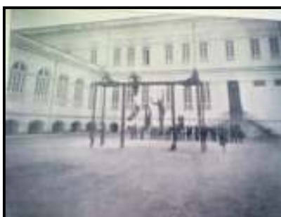
Fig. 10 recreio dos menores – XIX

O Instituto Lauro Sodré, com fim exclusivo de formar crianças com ofícios profissionais, tem o olhar direcionado para o recreio como tempo e espaço de poder e ordem em relação às crianças. O recreio é dividido em três momentos e espaços diferenciados: dos alunos maiores, dos médios e dos menores. Este espaço é cercado de grades elegantes e mede de 10,50 m 2 para o recreio dos médios e