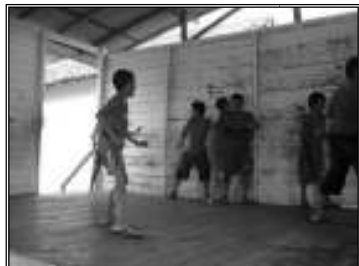
Fig. 15 brincadeira pega ladrão

critério elaborado, a escolha ocorria aleatória, às vezes o colega para brincar com outro colega se dirigia até a porta da prisão e dizia: “prende o colega Caê”, assim os agentes policiais se dirigiam para prender, e alguém deve pagar para soltar o Caê.