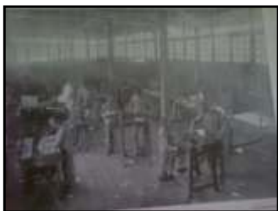
Fig 08 crianças aprendendo carpintaria – XIX

O Decreto nº 986, de 26 de março de 1901, revela outra forma de reorganização no Instituto Lauro Sodré no governo do Dr. Augusto Montenegro. O Instituto é mantido pelo Estado para dar instrução profissional à sociedade. O objetivo principal, segundo o Decreto nº 986/1901, é a formação de crianças em ofícios profissionais para servir a sociedade paraense. Para a admissão, o Instituto prioriza o ingresso de órfãos e filhos de pais pobres, com boa saúde, vacinado, que não sofra de moléstia contagiosa, em idade de dez anos e menor de dezesseis anos de idade.