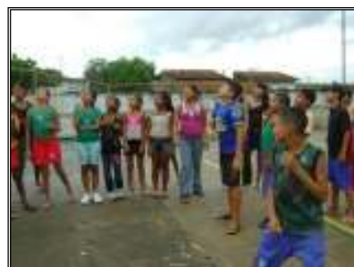
Fig. 14 crianças jogando no recreio

O significado e sentido que as crianças atribuem ao recreio estão de acordo com as literaturas estudadas cuja palavra significa divertimento, prazer, coisas que recreiam lugar do recreio, proporcionando sentir prazer ou satisfação. O dicionário faz referência ao lugar ou período destinados a se recrear como um espaço e tempo nas escolas, uma vez que o recreio é um lugar de divertimento concedido às crianças.