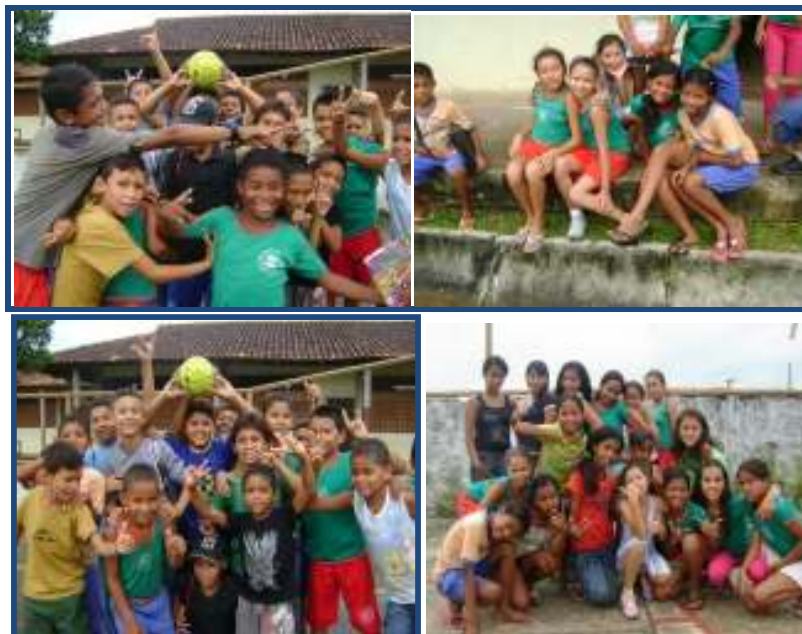
Fig. 07 Sujeitos da pesquisa – as crianças