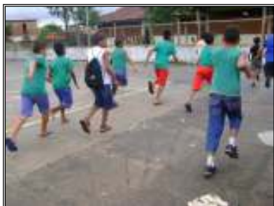
Fig. 17 crianças no recreio

de sala de aula, ou na quadra de esporte. O número de participante depende da vontade de querer brincar. Geralmente são seis crianças em cada time. A escolha da equipe é feita por um líder. Vence quem fizer dois gols no tempo de 5 minutos. Não há regras oficiais nesse jogo de futebol.