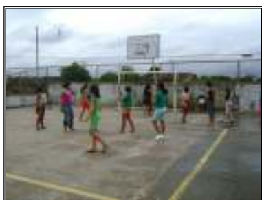
Fig. 19 crianças brincando queimada

De acordo com Sarmiento (2002), a brincadeira exerce o papel fundamental na divulgação das culturas infantis, pois existem brincadeiras transmitidas por vários séculos, alternando-se apenas suas nomenclaturas. Sarmiento destaca que a natureza interativa do brincar, processo que se constrói principalmente sob a égide do coletivo e da partilha, faz dela uma atividade propiciadora da aprendizagem, da sociabilidade, (e um dos primeiros elementos fundadores das culturas da infância).