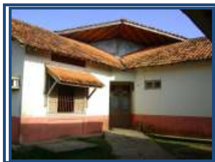
Fig. 05 bloco da administração

Na escola, não há brinquedos e nem tampouco parque recreativo. Embora, a escola possua uma área grande entre os blocos, ela não é arborizada, porque, segundo a Coordenação, as crianças destruíram as árvores plantadas. Essa falta de arborização mantém o clima quente, o que obriga as crianças a ocuparem um espaço pequeno, com algumas árvores, para as brincadeiras e para as rodas de conversa.