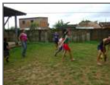
Fig. 20 crianças brincando queimada