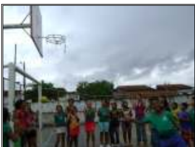
Fig. 13 crianças brincando no recreio