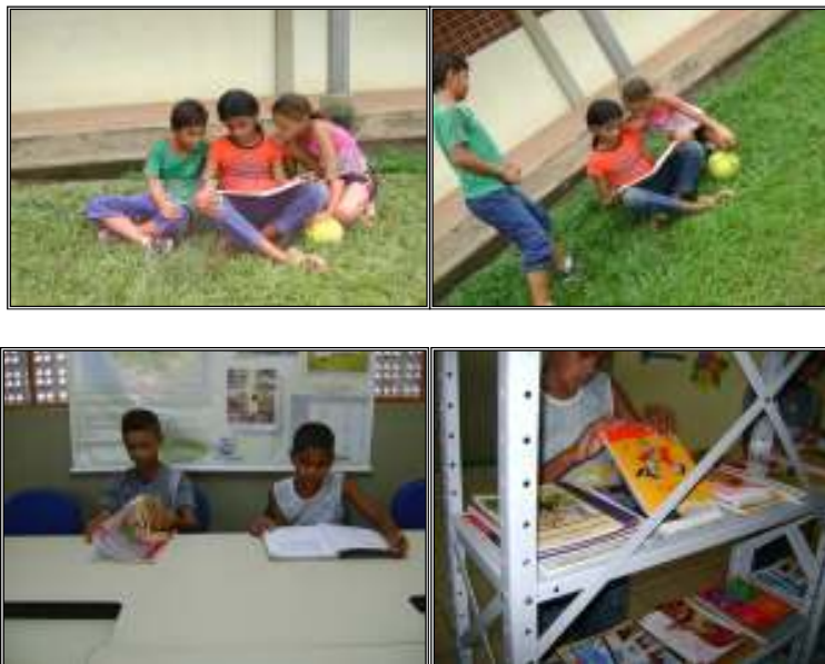
Fig. 25 crianças e a leitura no recreio

A professora da sala de leitura sugere livros aos alunos com base na faixa etária. A escola antes tinha o sistema de empréstimo para os alunos e para a comunidade, mas, no ano de 2008, tiveram que tomar medidas proibindo a saída de livros da escola, pois, uma vez emprestado, raras eram as vezes que retornavam.