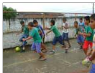
Fig. 18 crianças no recreio

f) queimada . É uma brincadeira tradicionalmente desenvolvida em tempos anteriores na rua, às vezes recebe o nome de mata-mata ou cemitério. As crianças praticam este jogo no espaço entre os blocos de sala de aula, e às vezes na quadra. Nesta brincadeira interagem as crianças de ambos os sexos. Também é feita a escolha do time por um líder.