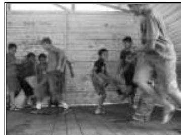
Fig. 16 brincadeira pega ladrão

A brincadeira polícia e ladrão está relacionada com a reprodução da violência urbana, é carregada de ações que imitam o uso de armas, lutas corporais, chutes e outras atitudes. Ainda argumentei: vejo que é uma brincadeira violenta, vocês lutam pra valer, uns se machucam, tem criança que chora, a maioria das crianças que participa deste brincar interage sempre sorrindo. As crianças argumentaram depois da minha fala, dizendo que: só participa desta brincadeira quem sabe brincar e quem garante lutar uns contra os outros, e dizem tudo não passa de brincadeira.