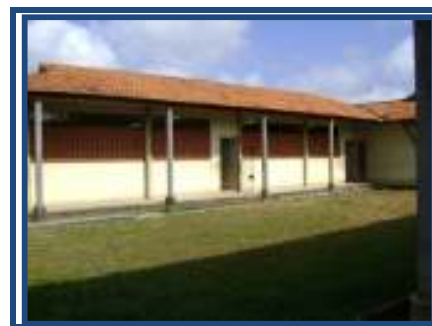
Fig. 06 sala aula de informática

Atualmente, esta escola atende 1.700 alunos (dados fornecido pela secretaria escolar), e funciona em quatro turnos (manhã, intermediário, tarde e noite). À noite funciona com atendimento aos alunos da Educação de Jovens e Adultos (EJA).