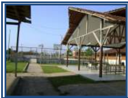
Fig. 03 pátio e quadra de esporte