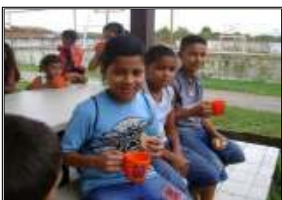
Fig. 11 crianças merendando

Recrear vem do latim ( recreare ) indicando a possibilidade de proporcionar recreio, diversão, alegria, prazer e brincar. Segundo o dicionário (1999), brincar expressa divertir-se infantilmente, entreter-se, dizer ou fazer por brincadeira.