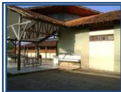
Fig. 02 pátio do recreio