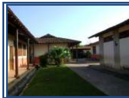
Fig. 04 blocos de sala de aula

Na escola, não há brinquedos e nem tampouco parque recreativo. Embora, a escola possua uma área grande entre os blocos, ela não é arborizada, porque, segundo a Coordenação, as crianças destruíram as árvores plantadas. Essa falta de arborização mantém o clima quente, o que obriga as crianças a ocuparem um espaço pequeno, com algumas árvores, para as brincadeiras e para as rodas de conversa.