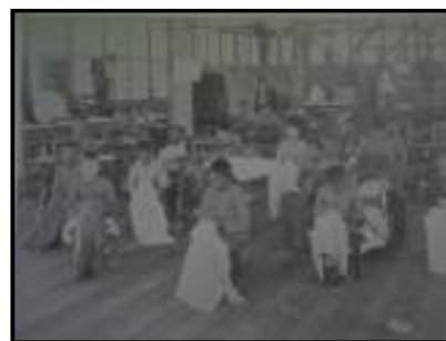
Fig. 09 crianças aprendendo costurar – XIX