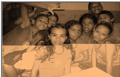
Fig. 21 interação em sala de aula