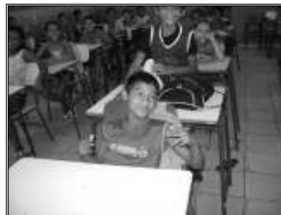
Fig. 22 crianças interagindo na sala

Existem, no pátio do recreio, outros tipos de pares, menino-menina, menino-menino, menina-menina, grupos maiores de meninas e meninos que socializam o jogo de queimada. Sobre os temas de conversa que ecoam no recreio, aparece à televisão, especialmente as novelas.