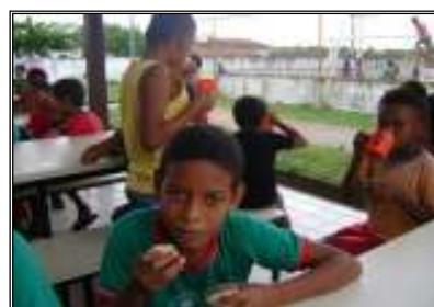
Fig. 12 crianças merendando