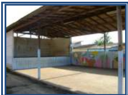
Fig. 01 galpão de eventos

A escola Guajará é estruturada por quatro blocos; um para a Educação Infantil e a sala de leitura; outro para a administração, composto pela sala da direção, do corpo técnico, secretaria, sala dos professores, outro para as demais salas de aulas e de informática, um bloco pertencente ao serviço de apoio, onde se encontra a copa, a cozinha e o refeitório, neste bloco está localizado o pátio para o recreio, com mesas e bancos com capacidade para até cinco alunos de cada lado, uma quadra de esporte sem cobertura, e em 2005, a construção de um galpão de apoio para os eventos festivos.