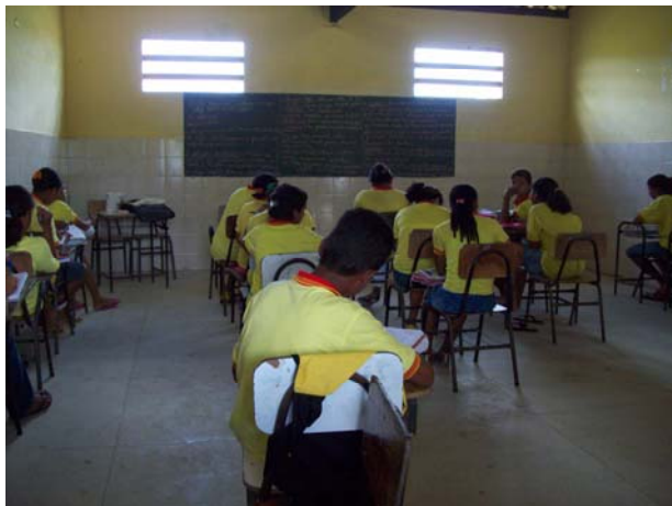
Foto 07- Alunos copiam do quadro

educação em que se incentiva a autonomia e a produção criativa. Os alunos sempre em fileiras e bem comportados raramente conversavam, mas sempre se mostravam atentos a voz do professor ou da professora, que por sua vez, a qualquer sinal de indisciplina chamava a atenção dos que fugiam à normalidade. Ver Foto 07 a seguir