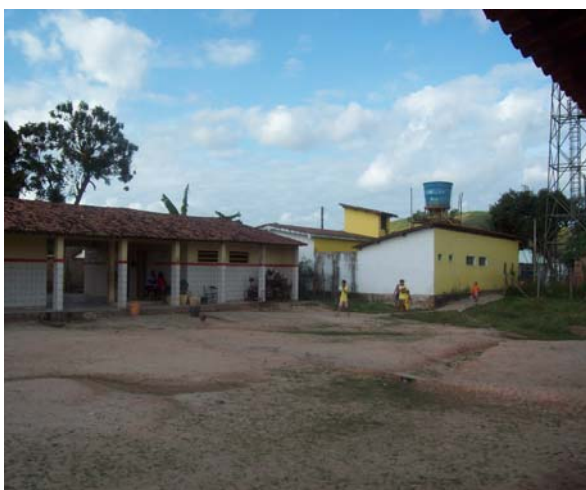
Foto 01 - Posto de saúde conjugado com a escola (vista interna da escola)

O posto de saúde e a escola são as únicas instituições públicas para atendimento daquela comunidade, que ao necessitar de outros atendimentos mais específicos, deslocam-se para o hospital do centro de Porto Calvo. A Usina Santa Maria, uma das mais próximas da comunidade é responsável pela produção de açúcar e álcool no município, além de abrir possibilidades de trabalho para comunidade.