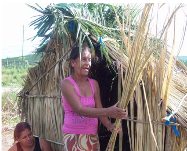
Foto 02- mulheres aguardam decisões sobre a posse da terra há mais de dois anos

estão com o processo de terras definido e, logo a frente da escola, nota-se a presença de um acampamento, aguardando resultados. Apesar da situação regular de terras no assentamento, ainda há acampamentos no local, aguardando uma decisão da justiça quanto a uma determinada parte de terra há mais de dois anos e contam que não sabem como está a situação, mas continuam vindo e montando acampamento.