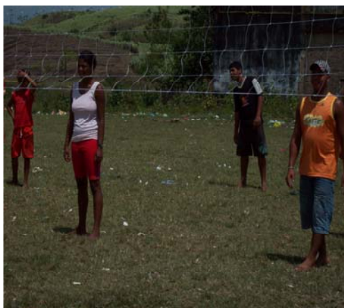
Foto 04- Alunos em Educação Física

Na escola Nossa Senhora da Conceição, há um professor dessa área atendendo as várias turmas, com atividades esportivas como vôlei e futebol e as atividades são realizadas no espaço vazio em frente à escola. Ver Foto 04.