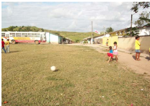
Foto 06- Escola, comunidade e ônibus escolar