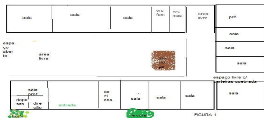
Figura 01- Planta baixa da Escola Nossa Senhora da Conceição

A escola não possui biblioteca, sala de vídeo ou outros espaços para atividades extra-classe. E encontramos uma sala de informática fechada há meses e sem uso, pois faltam ligar as máquinas e pessoal qualificado para as aulas, as atividades pedagógicas resumem-se aos espaços em sala de aula, baseados no quadro de giz, no uso do livro didático e na aula expositiva, bem como atividades no campinho na frente da escola nas aulas de Educação Física. A ausência de espaços adequados para atividades extraclasses contribui para uma dinâmica escolar que não favorece o enriquecimento de atividades curriculares no âmbito escolar. Outros espaços não são aproveitados como, a horta cuidada pelo porteiro da escola que às vezes, serve para enriquecer a merenda, não é aproveitada para enriquecer também o currículo.