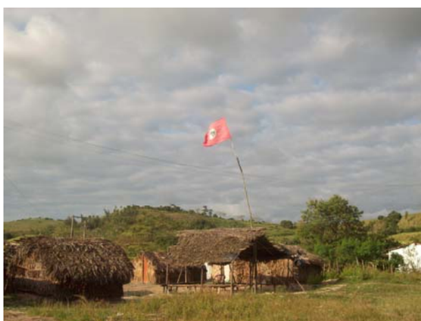
Foto 03- Acampamento próximo à escola

As questões sobre a terra não fazem parte do contexto educacional em que os alunos estão inseridos. Em dois dias de observação, apresentou-se como preocupação de uma das educadoras, a ausência dos alunos às aulas, levados pelos pais para fazer parte das atividades dos Sem Terra, na capital, pois a educadora alegou não saber do que se tratava e que as crianças iriam para dormir nas ruas, acompanhando os pais nos movimentos.