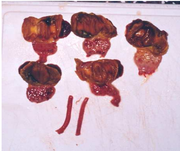
Figura 3. Proventrículos e traquéias hemorrágicos de aves SPF colocadas em contato com gansos-da-China inoculados com o vírus da doença de Newcastle.

quantidade suficiente para induzir infecção e doença clínica nas aves SPF conviventes. Além disso, obviamente, as aves SPF conviventes com os gansos-da-China inoculados com o VDN não eram vacinadas contra a enfermidade de Newcastle e, portanto, não possuíam imunidade para impedir a infecção e o surgimento da sintomatologia clínica sugestiva da DN. Em adição, nas aves domésticas, algumas estirpes patogênicas do VDN causam mortalidade logo após à introdução de apenas pequena quantidade de unidades infecciosas do VDN, enquanto outras necessitam de um milhão ou mais de unidades infecciosas de vírus para induzir mortalidade (BEARD & HANSON, 1984).