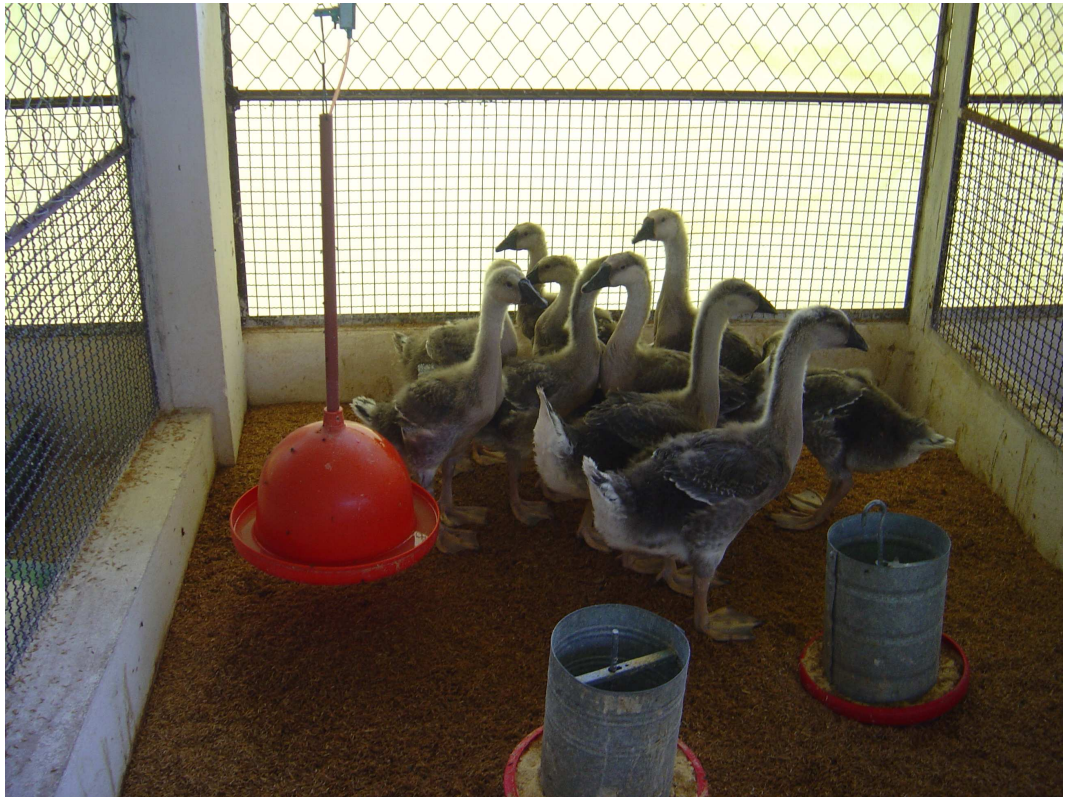
Figura 1. Gansos-da-China aos 28 dias de idade em boxe de galpão experimental