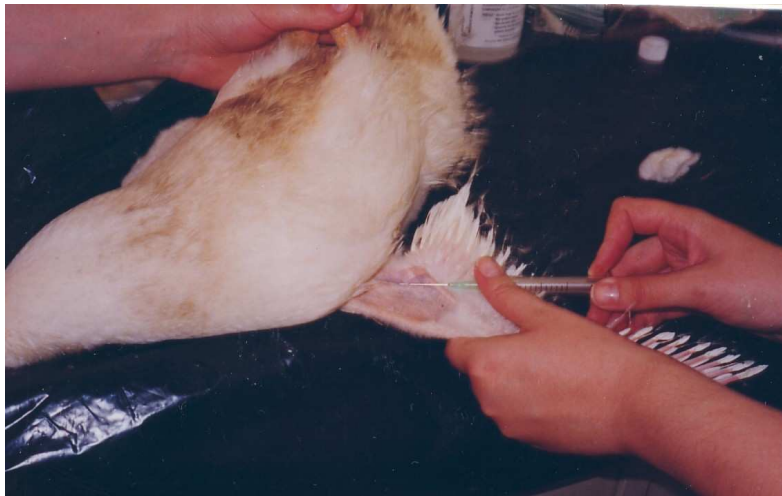
Figura 2. Colheita de sangue de gansos-da-China a partir da punção da veia ulnar superficial.

Foram colhidas 252 amostras de sangue a partir do sétimo dia de idade das aves, com intervalos regulares de sete dias, totalizando sete colheitas. As amostras de sangue foram colhidas por punção da veia ulnar superficial (Figura 2). Os soros obtidos foram inativados a 56°C, por 30 minutos, colocados em tubos Eppendorf e armazenados a – 20°C até o momento do uso, para pesquisa de anticorpos inibidores da hemaglutinação para a DN.