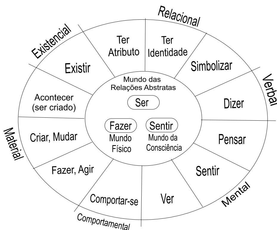
Figura 01 – A Gramática da Experiência: tipos de processos (conforme Halliday, 2004, p.172) 2 .

Para explicar a distinção entre a experiência externa e a experiência interna, o sistema de Transitividade conta com os Processos Materiais, Mentais, Relacionais, Comportamentais, Verbais e Existenciais (ibidem, p. 173). A Figura 01 apresenta os tipos de processos como um espaço semiótico com diferentes regiões representando diferentes processos.