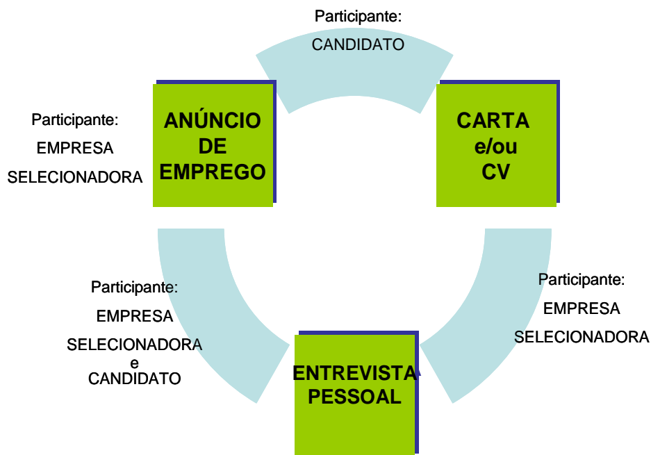
Figura 02 – Sistema de Gêneros e Participantes do Processo Seletivo de Candidatos à vaga de Emprego no Contexto Empresarial.

Diante dessas afirmações, na Figura 02 7 , procuro representar esse sistema de gêneros com os participantes e os textos recorrentes no processo seletivo para vendedor autônomo.