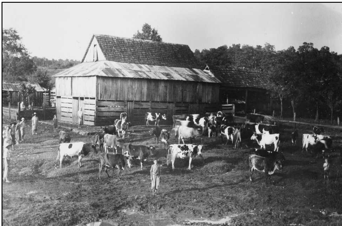
Imagem 39 – Granja leiteira (Coleção Família Beck, sem data).

Nesta imagem foi capturada uma granja leiteira de Ijuí. Em primeiro plano há um grande número de pessoas à esquerda da imagem, todas colocadas uma ao lado da outra, formando como que uma meia lua na imagem. Na frente dos animais da granja dois meninos posicionam-se olhando na direção onde o fotógrafo e sua câmera estão posicionados. Os sujeitos posam para a imagem fotográfica como que cedendo espaço aos animais que assim passam a ter um maior grau de importância no tema da imagem.