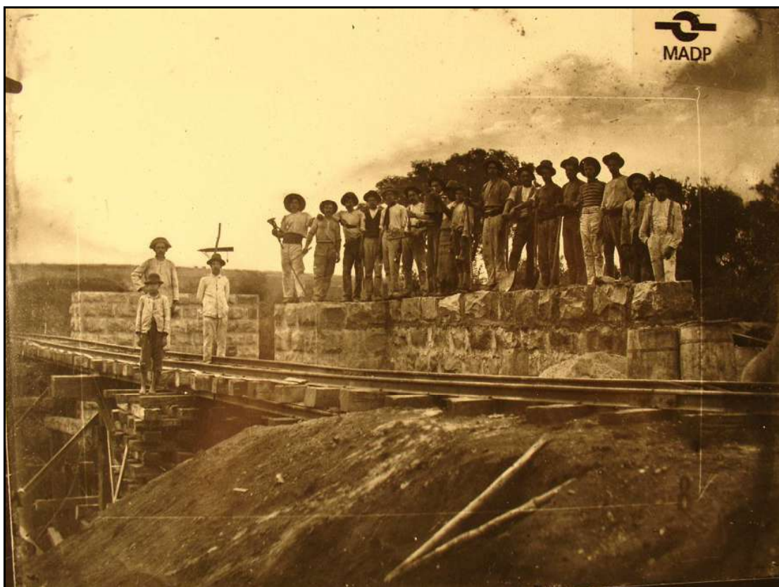
Imagem 4 – Construção da estrada de ferro (Coleção Família Beck, 1911).

Se autores como Jean Roche, Paulo Afonso Zarth, entre outros, afirmam que o sucesso ou insucesso das colônias se deu, entre outros fatores, em função da ligação com outros pontos do Estado, ou seja, mercados consumidores dos gêneros produzidos pelos colonos, é possível atribuir um dos fatores do sucesso da colônia Ijuí ao constante papel do Estado na construção e melhoramentos de estradas e, sem sombra de dúvida, a construção do ramal da estrada de ferro cerca de 20 anos após a fundação da colônia foi de fundamental importância.