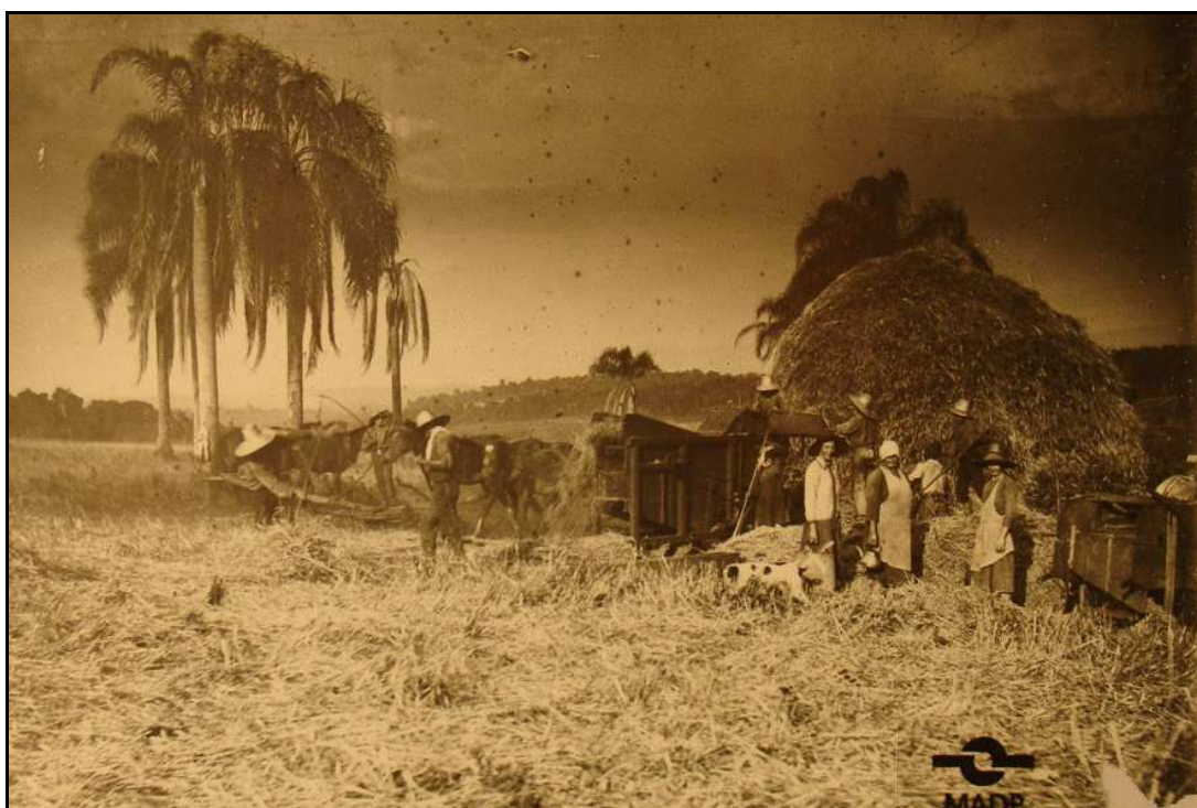
Imagem 29 – Trilhagem do trigo (Coleção Eduardo Jaunsem, 1938).

O plano de fundo da imagem é fechado pela elevação do terreno onde se pode observar algumas árvores e uma vegetação mais baixa.