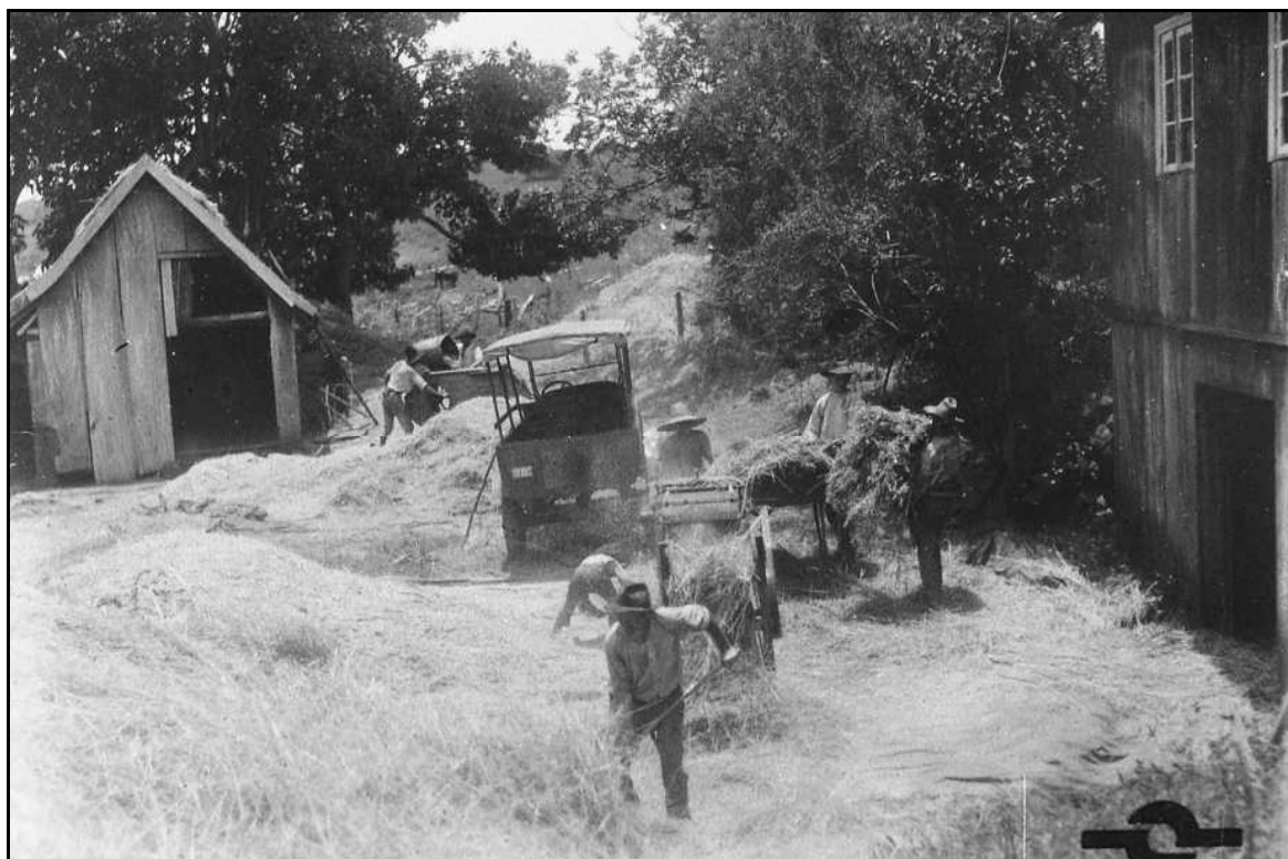
Imagem 33 – Trilhagem com caminhão (Coleção Eduardo Jaunsem, 1939).

No interessante plano de fundo pode-se observar uma série de paisagens diversificadas, que somadas formam a paisagem da colônia de imigração no ano de 1940. Mesclam-se as paisagens agrícolas, paisagens de mata, confirmando nossa hipótese de que a cultura técnica construída nesse período em Ijuí possui estreita ligação com o meio-ambiente, já que à medida que esse cede espaço para a lavoura, novas tecnologias podem ser utilizadas. Nesse período estudado há ainda a mescla de paisagens agrícolas e paisagens de mata na colônia, sendo que a última, gradativamente, perde espaço para a primeira, já que nesse período um necessário incremento na produção não era feito a partir de uma adubação ou uso de novos produtos químicos, mas sim, por um aumento da superfície cultivada.