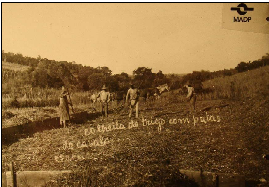
Imagem 27 – Debulha do trigo com cavalos (Coleção Eduardo Jaunsem, 1926).

O plano geral desta imagem horizontalizada pela disposição dos sujeitos, dos produtos, das carroças e da linha do horizonte que cria um contraste entre o céu claro e a colônia que é ligeiramente mais escura, transmite-nos a sensação do trabalho dos colonos.