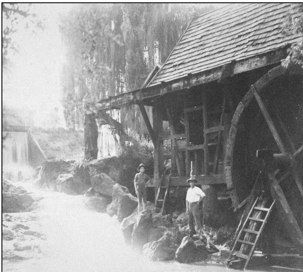
Imagem 45 – Moinho (década de 1930).

Apresentamos alguns entraves que a natureza (dita arcaica) apresentou ao moderno. Agora vamos direcionar rapidamente nossa atenção a aspectos em que essa permitiu que os colonos desenvolvessem determinadas atividades que, sem a contribuição da natureza, se tornariam muito mais penosas.