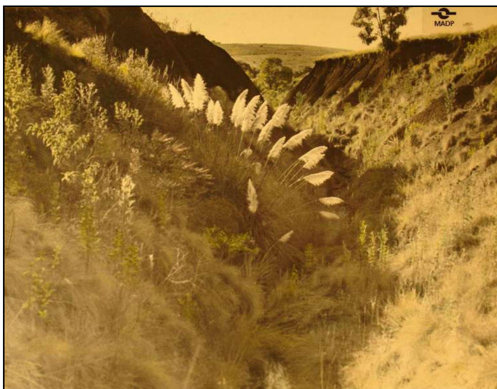
Imagem 46 – Erosão (Coleção Eduardo Jaunsem, sem data).

Assim, temos por um lado o discurso da natureza como “intrusa”, destruidora, e por outro lado, a natureza benéfica, cujos aspectos auxiliam os sujeitos sociais. Se há um discurso verbal, escrito, acerca da natureza, o fotógrafo Eduardo Jaunsem, em suas fotografias também, de certa forma, cria um discurso sobre a natureza, exaltando as suas belezas. Sua técnica fotográfica, como já mencionamos, faz com que o plano de fundo das imagens, onde os aspectos naturais se encontram, tenha um realce todo especial. Eduardo Jaunsem se preocupou em destacar as belezas do novo mundo que o acolheu, mas também em uma imagem única em todas as coleções pesquisadas, o fotógrafo construiu um discurso imagético que atenta para a destruição causada pelo mau uso da natureza.