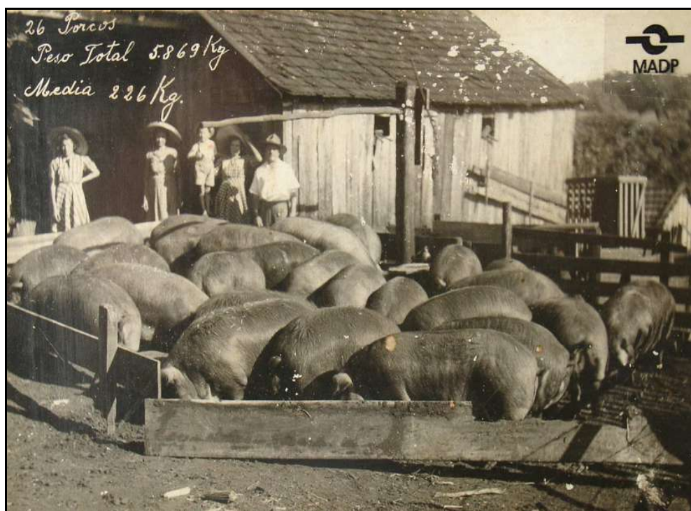
Imagem 37 – Família e a criação de porcos (Coleção Família Beck, 1942)

No plano geral a técnica do fotógrafo é ressaltada, o foco principal direcionou-se sobre os porcos, mas a abertura da lente põe também os sujeitos em evidência, ressaltando assim o papel desses enquanto criadores/trabalhadores da criação suína. A lateral direita da imagem é fechada pela abertura da câmera, no entanto é possível notar que a criação de porcos não se limita somente ao espaço de recorte da imagem, mas sim, que ela se estende para além desse. A disposição dos porcos, a presença dos sujeitos atrás desses e a cerca ao fundo produzem uma bela sensação de profundidade na imagem.