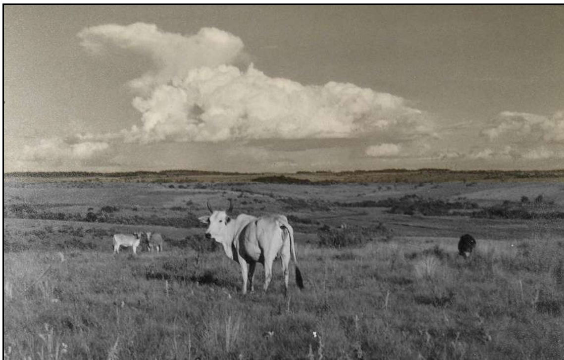
Imagem 40 – Criação de gado (Coleção Eduardo Jaunsem, 1940).

de porcos anteriormente apresentada. Como as duas imagens pertencem à coleção Família Beck, essas nos revelam a técnica dos fotógrafos que ajudaram a construir uma cultura fotográfica no sul do Brasil.