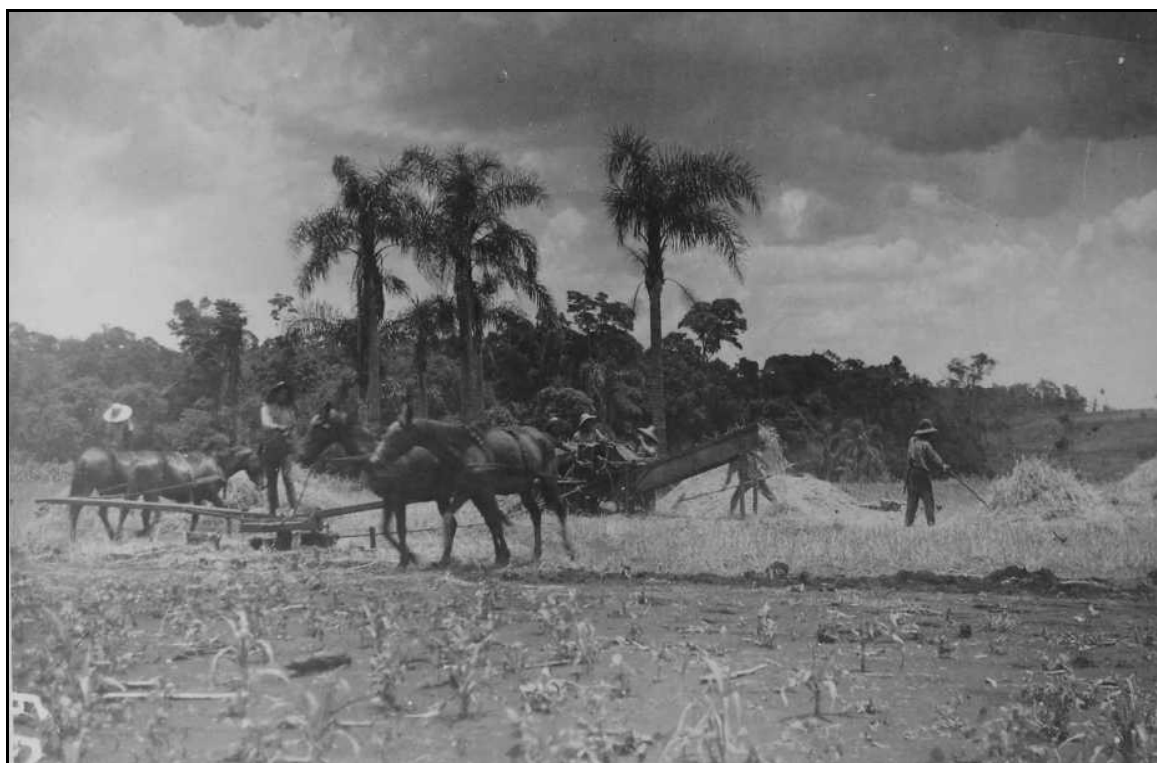
Imagem 31 – Trilhagem do trigo (década de 1930).

O arroz geralmente se divide em basicamente dois tipos/qualidades – o que se desenvolve em terreno seco, chamado arroz de sequeiro e o tipo que se desenvolve em terreno alagado, sendo que o último, em geral, é a espécie mais conhecida. Nem a imagem acima, nem mesmo sua ficha catalográfica permite sabermos qual a espécie cultivada neste caso. No entanto, traz uma riqueza de detalhes que permite ao leitor da imagem observar praticamente todas as etapas de colheita e beneficiamento do arroz, o que vem, mais uma vez, a ressaltar a importância documental das imagens fotográficas enquanto locais de memória 35 e seu auxílio no resgate do passado, aqui, sob pelos menos três aspectos: a) da cultura material; b) do cotidiano de uma colônia de imigração; e c) da cultura técnica.