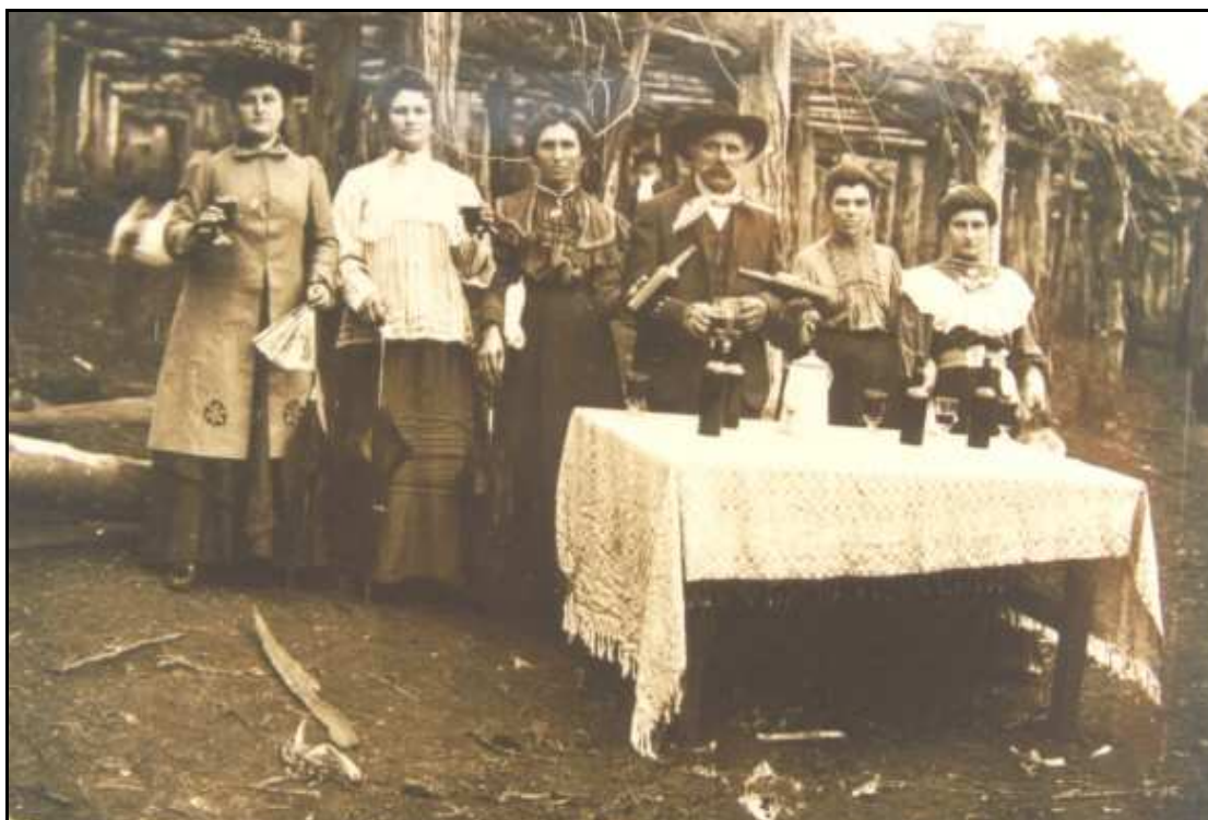
Imagem 34 – Família de viticultores 37 (Coleção Família Beck, 1910).

Essas exposições têm um papel de suma importância na premiação dos produtores, especialmente imigrantes, que conseguem prosperar e alcançar uma produção maior ou melhor. Uma premiação que visa mostrar a capacidade de o Brasil produzir e prosperar, o mundo agrário brasileiro, aquele que é a representação do moderno, o imigrante europeu.