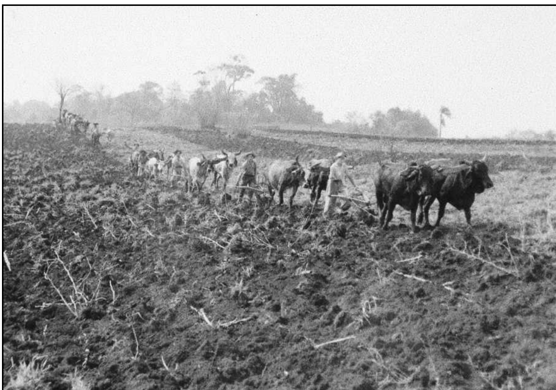
Imagem 14 – Mutirão para arar (Coleção Eduardo Jaunsem, sem data).

O plano de fundo também nos apresenta algo interessante, qual seja, a presença de grande número de coqueiros, que em geral não eram retirados das lavouras nesse período, em função de não possuir valor comercial algum, bem como possuírem um sistema radicular difícil de remover.