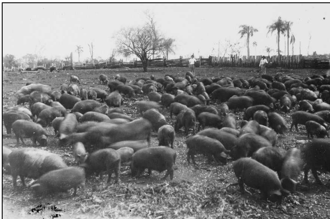
Imagem 36 – Cercado para criação de porcos (Coleção Família Beck, sem data).

A importância da aquisição de animais e a sua produção também estão presentes na imagem, já que a fotografia não era algo corriqueiro na vida das pessoas, mas uma espécie de celebração, ato para o qual as pessoas se preparavam, vestiam suas melhores roupas. A fotografia da criação de porcos e a não-presença de nenhuma pessoa nos planos da imagem revela algo interessante e de certa forma incomum, que visa mostrar a prosperidade e o trabalho do sujeito proprietário da unidade produtiva.