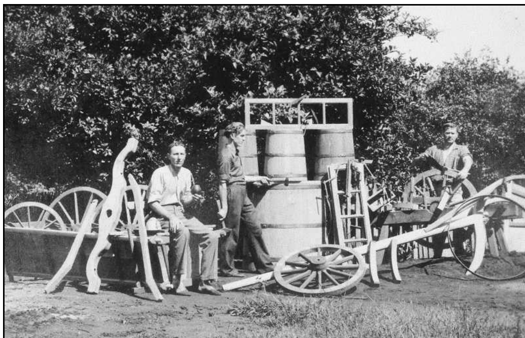
Imagem 41 – Carpinteiros (Coleção Família Beck, sem data).

Os dados acima apontam além do beneficiamento dos produtos agropecuários para a existência de fábricas/indústrias 14 que produziam um ferramental agropecuário, como por exemplo, as selarias, marcenarias e carpintarias. Essas fábricas/indústrias produziam, além do consumo da própria colônia, também para a exportação, principalmente carroças de duas e quatro rodas que figuram constantemente a partir de 1912, quando os dados de exportação do município são mais detalhados entre os produtos exportados.