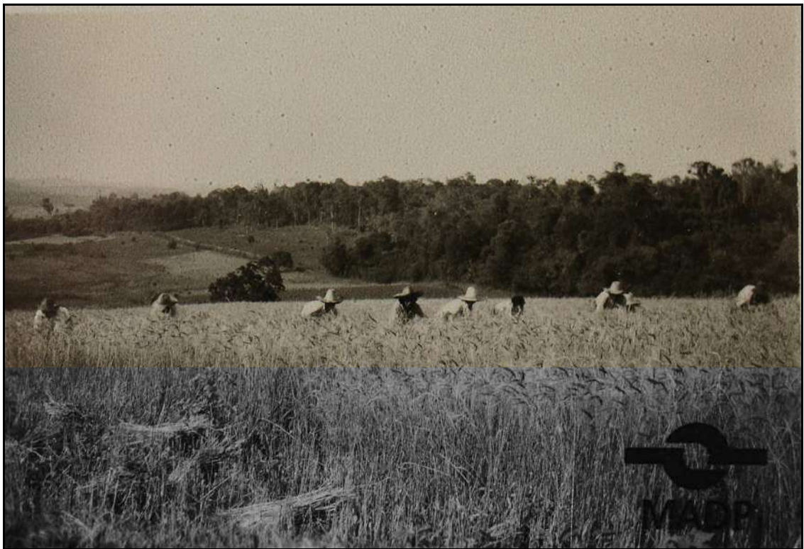
Imagem 9 – O trigo e sua colheita (Coleção Eduardo Jaunsem, 1940).

O interesse em fotografar o roçado se deve possivelmente à necessidade de registrar o trabalho do imigrante/colono, a posse da terra e o cultivar a terra no “novo mundo”, algo que na Europa, em geral, os dois últimos eram algo longe do alcance desses sujeitos, parte integrante do fator de repulsão do “antigo lar” e fator de atração no novo mundo.