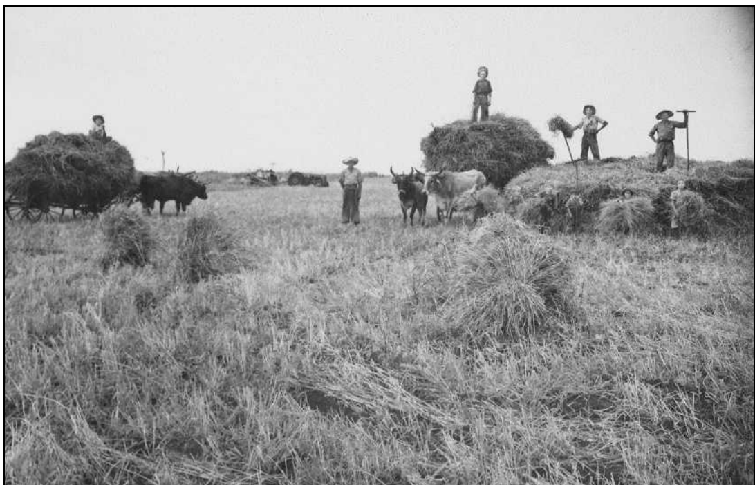
Imagem 26 – Recolhimento do trigo (Coleção Eduardo Jaunsem, sem data).

No florescer a terra o próximo passo é o recolhimento dos produtos da lavoura e o beneficiamento inicial dos mesmos, que em geral compreende a separação dos grãos da casca e palha. Nesse processo é possível observar o que já defendemos: que a cultura técnica construída pela interação/hibridismo dos sujeitos sociais entre si, não sofre grandes alterações, somente há em alguns momentos a inserção de uma nova tecnologia.