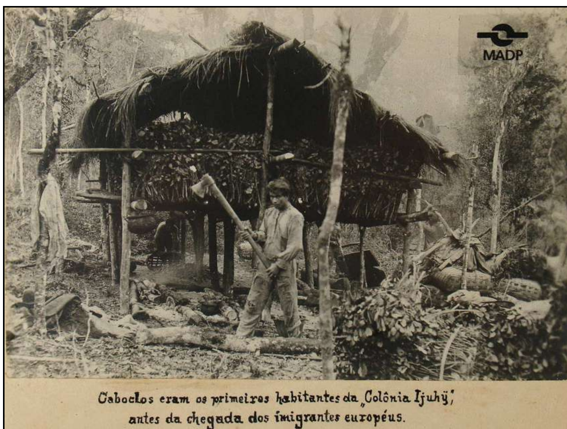
Imagem 5 – Caboclos e a erva-mate (Coleção Eduardo Jaunsem, 1939).

A presença do caboclo reforça a formulação de que essa foi uma área de fronteira cultural, ou seja, área onde duas culturas distintas estiveram em situação de fronteira 44 , uma situação de conflito, de troca de experiência, um espaço híbrido, palco de um hibridismo cultural entre caboclos e imigrantes, onde a troca de experiências foi fundamental para o início da prática agropecuária e a transformação, diferenciação do espaço. Com o passar dos anos alguns pontos desse hibridismo perdem força (funcionalidade) mas, no entanto, essa situação é claramente visível, como veremos mais adiante, e se mantém ao longo do tempo sob diversos pontos.