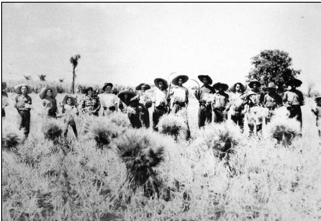
Imagem 18 – Homens, mulheres e crianças colhem trigo (Coleção Eduardo Jaunsem, 1950).

Esta imagem foi confeccionada na Linha 10 Leste no ano de 1950 e apresenta em primeiro plano um grande número de pessoas, homens, mulheres e crianças que participam do possível mutirão na colheita do trigo. Todos pararam momentaneamente seus afazeres para posar para a fotografia. Possuem em suas mãos seus instrumentos de trabalho e trajam roupas condizentes com esse.