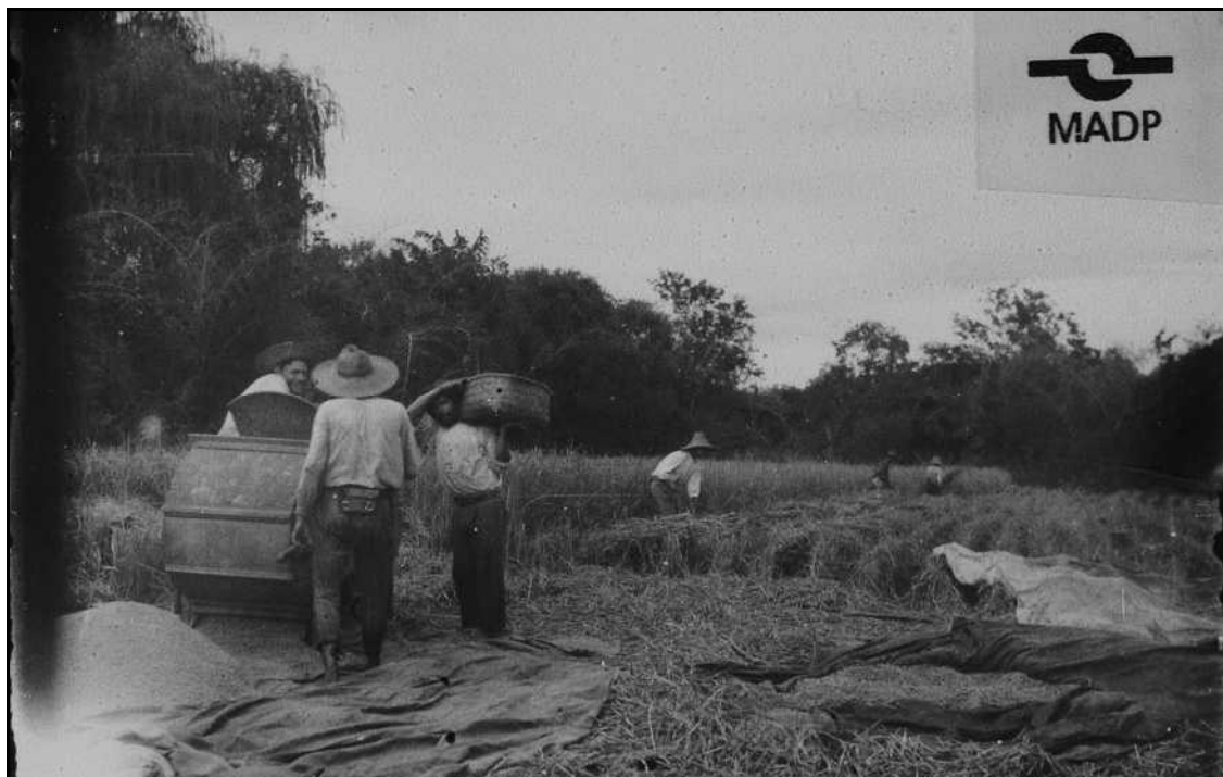
Imagem 30 – Colheita e trilhagem do arroz (Coleção Eduardo Jaunsem, 1947).

O plano de fundo permite-nos apreciar a mata que se desenvolve horizontalmente na imagem, bem como possibilita imaginar as belezas das matas que existiam na região antes da chegada do imigrante.