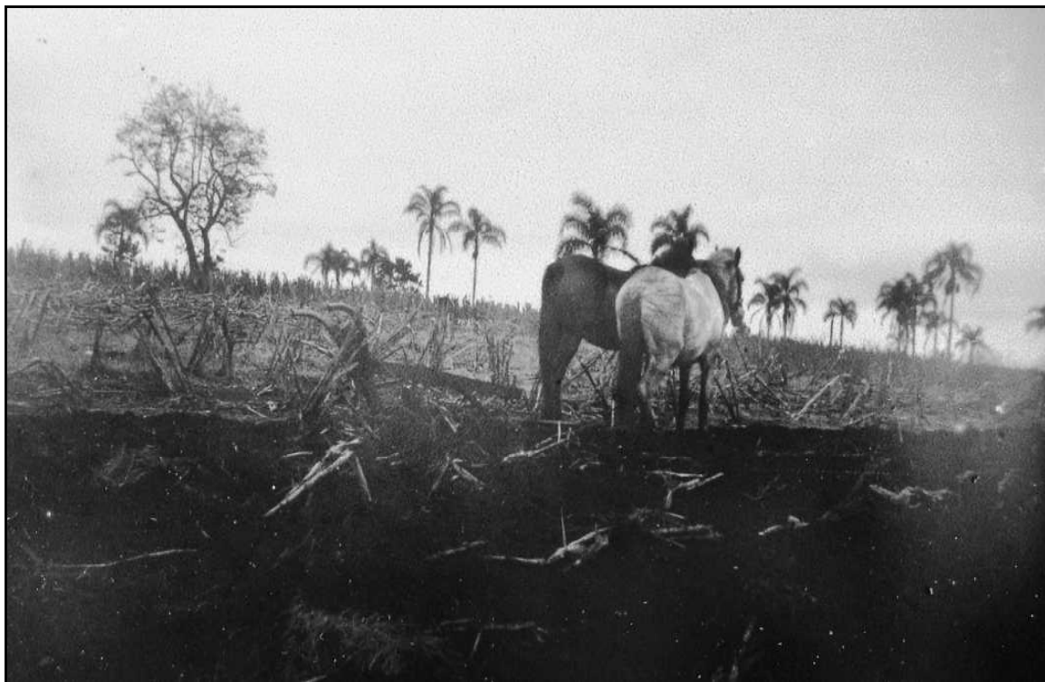
Imagem 13 – Arado e cavalos (Coleção Eduardo Jaunsem, sem data).

Esta imagem também produzida na Linha 11 Leste mostra-nos a utilização de outro animal na tração do arado – a utilização de cavalos.