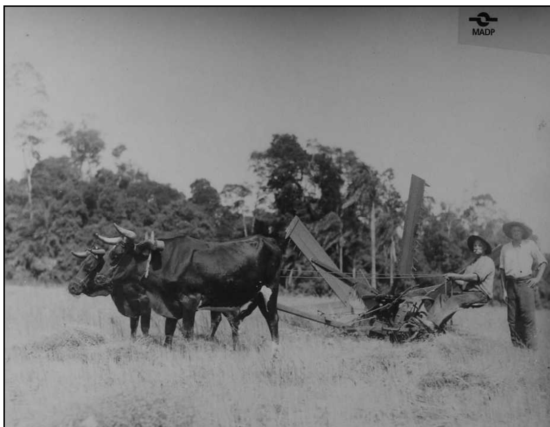
Imagem 22 – Ceifadeira puxada por bois (Coleção Eduardo Jaunsem, 1924).

No plano geral da imagem é possível ver a intencionalidade do fotógrafo em ressaltar o trabalho com a ceifadeira que se encontra imponente no centro da imagem, sem no entanto, deixar de ressaltar as belezas naturais da nova terra que o acolheu. E a possível diferenciação/ status do sujeito que possui uma ceifadeira para a colheita, uma tecnologia mais produtiva/avançada que as foicinhas. Como já frisamos anteriormente, a chegada de uma nova tecnologia não necessariamente suprime o uso da anterior, mas as duas convivem juntas até que todos os sujeitos tenham acesso à mesma. Eduardo Jaunsem retratou muitas dessas novas tecnologias que, para além de enriquecer e ampliar o leque da cultura técnica de Ijuí, se tornam nessas imagens quase que um monumento sinônimo de diferenciação social. Algo também interessante é a preocupação de Jaunsem em retratar essas novas tecnologias e transformá-las em memória nas fotografias.