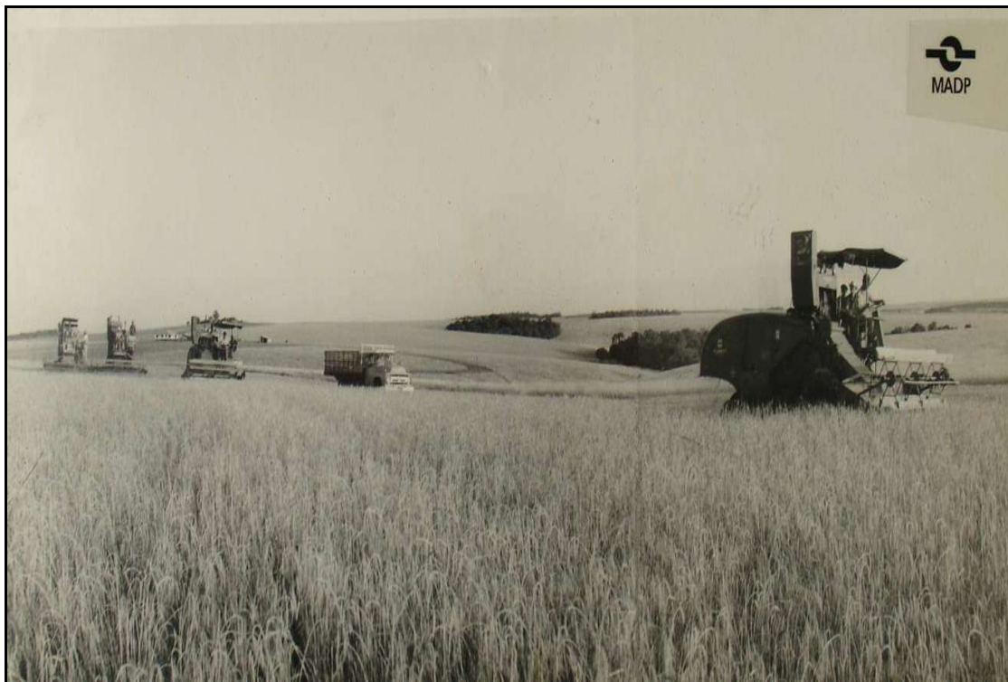
Imagem 25 – Colheitadeiras e caminhões (Coleção Eduardo Jaunsem, 1950).

Esta imagem, tomada da Vila Mauá-Ijuí na década de 1950, representa mais uma tecnologia e um conhecimento técnico que vem a diversificar a cultura técnica construída em Ijuí. Temos, em um plano de detalhes da fotografia, quatro colheitadeiras que realizam a colheita do trigo e já o beneficiamento inicial, pois além de colher os produtos já ocorre internamente na máquina a separação da palha dos grãos, o que sem sombra de dúvida representa uma economia de mão-de-obra.