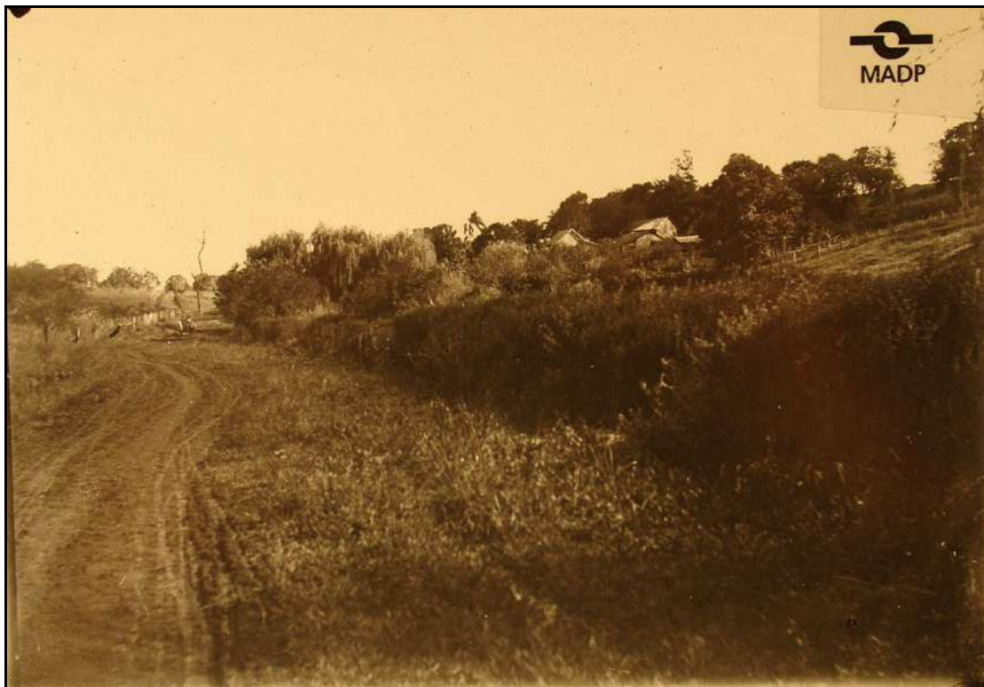
Imagem 2 – Estrada de Ijuí (Coleção Eduardo Jaunsem, 1917).

Nesta imagem de 1917 o fotógrafo Eduardo Jaunsem capturou uma vista parcial de Ijuí. A partir de um plano de detalhes podemos visualizar uma estrada que representa bem as chamadas “estradas de rodagem” ou “carroçáveis”. Na imagem a observação das marcas salientes e estreitas das rodas de carroças na estrada são perfeitamente visíveis, o que atesta para o seu uso constante, bem como é perceptível a conservação da mesma e a diferenciação entre a parte usada, à esquerda, e a parte menos utilizada à direita, na qual se desenvolvem grande número de gramíneas.