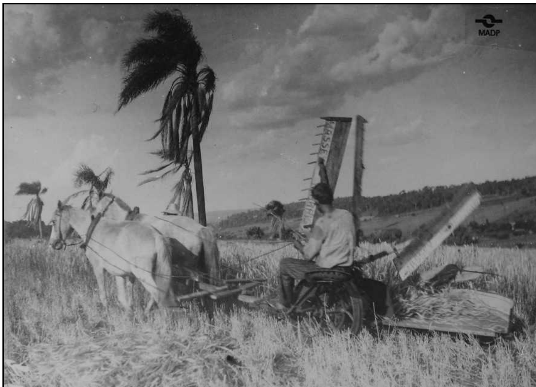
Imagem 21 – Ceifadeira puxada por cavalos (Coleção Eduardo Jaunsem, 1925).

Nas imagens que mostramos até o momento, há o predomínio de técnicas manuais para a colheita. A partir de agora passaremos a mostrar fotografias em que se passa de técnicas predominantemente manuais para técnicas cada vez mais mecanizadas.