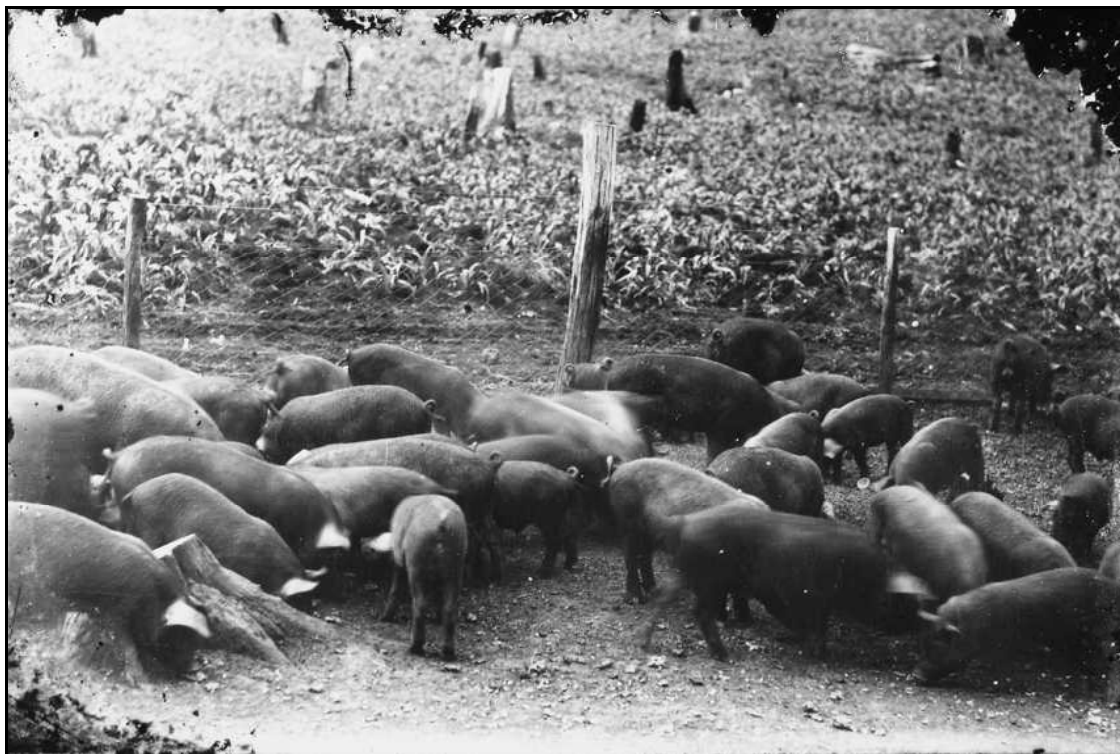
Imagem 35 – Criação de porcos (Coleção Eduardo Jaunsem, sem data).

Esta imagem produzida pelo fotógrafo Eduardo Jaunsem, embora não possua data, revela alguns aspectos interessantes sobre os inícios da agropecuária em Ijuí. Um plano de detalhes revela a criação de porcos com espaço delimitado por uma cerca, construída com alguns postes de madeira e tela de arame. Dentro desse espaço os porcos circulam livremente, bem como são alimentados. De maneira geral, os porcos apresentam-se com o mesmo tamanho, certa uniformidade que revela a possível mesma idade dos suínos, mesma alimentação e possível mesmo período do nascimento, o que de certo modo permite inferir que a sua criação era para o abate e venda da carne e subprodutos, principalmente a banha.