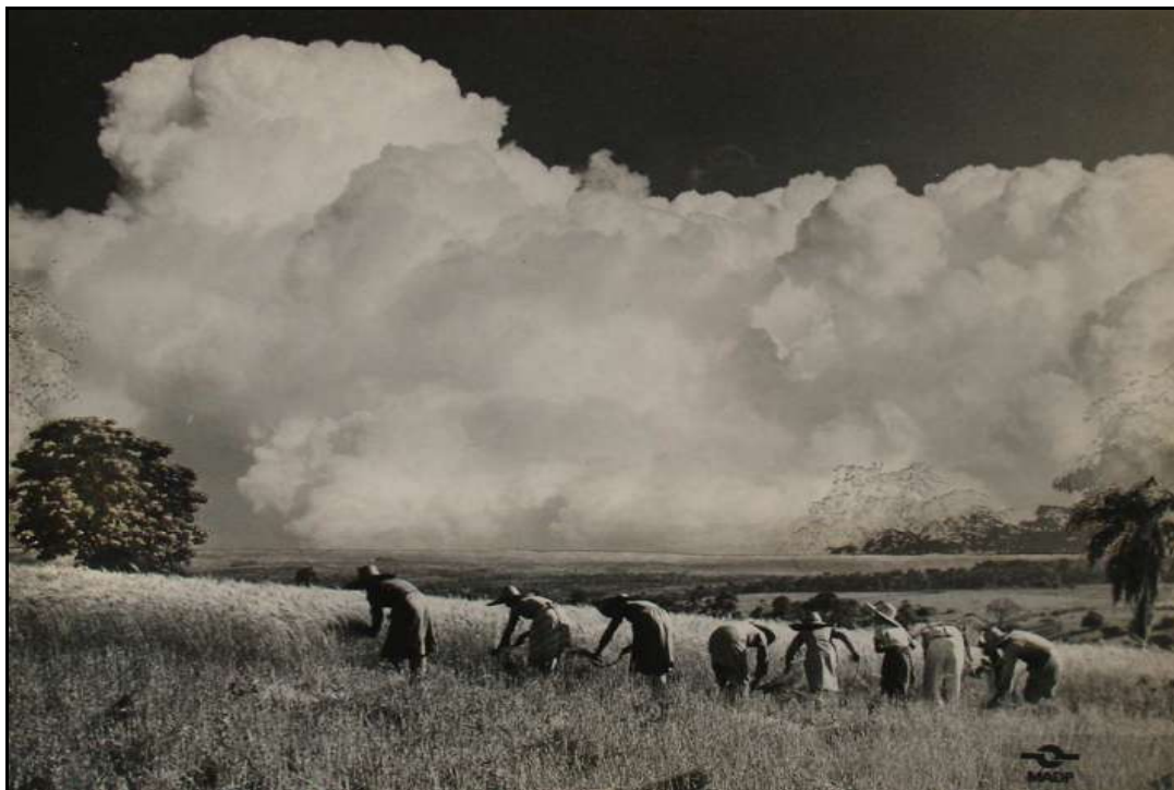
Imagem 17 – Cortadeiras de trigo (Coleção Eduardo Jaunsem, 1945).

Esta imagem, que recebeu de seu autor o título “Cortadeiras de Trigo”, conquistou o segundo lugar na modalidade “O homem e seu trabalho”, na segunda exposição dos fotógrafos profissionais do Rio Grande do Sul que aconteceu na década de 1950. A imagem inclusive foi usada no folder de divulgação da exposição 27 . Esta imagem é, na verdade, uma montagem feita por Eduardo Jaunsem, em 1945, obtida a partir da junção de duas imagens, cujo resultado mostrou-se belíssimo. A montagem pode ser percebida quando atentamos para as duas laterais da imagem, que possuem um corte, bem como um olhar mais treinado pode observar acima das pessoas uma linha que coincide com a linha do horizonte.