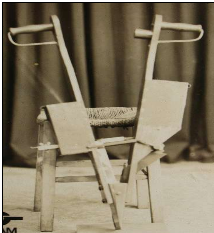
Imagem 15 – Saraquá (Coleção Família Beck, sem data).

A exemplo das técnicas para a preparação do solo, anteriormente apresentadas, as técnicas de plantio também, em geral, passaram despercebidas, não sendo relatada nada acerca delas nos documentos pesquisados. Somente as imagens fotográficas captaram em algum momento essas técnicas específicas, ressaltando a importância desse documento para o historiador, já que muitas vezes as fotografias permitem que o olhar do historiador/ pesquisador se deleite sobre aspectos que os documentos escritos não o permitem fazer.