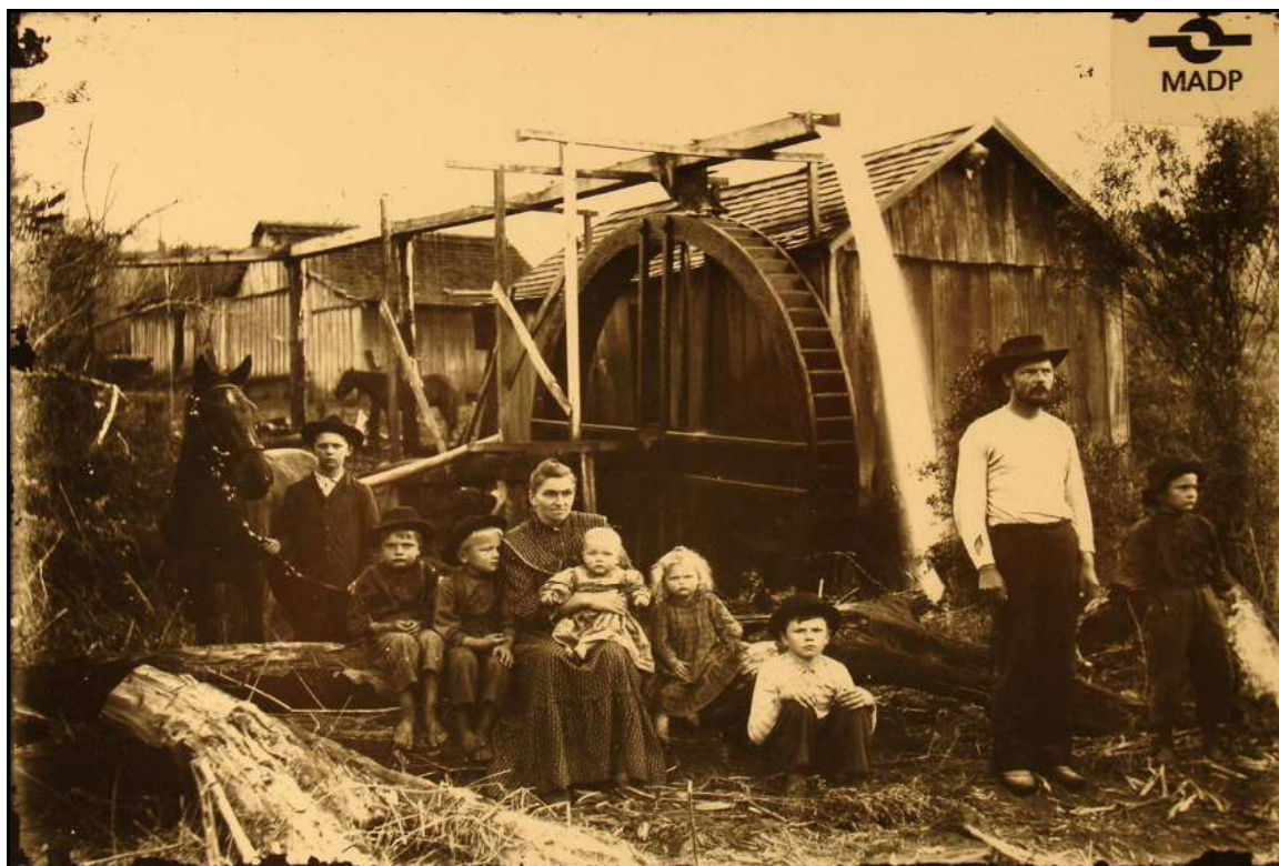
Imagem 11 – Moinho Colonial.

Esta imagem também pertencente à coleção Família Beck, confeccionada em 1910, na Linha 7 Norte, em Ijuí, vem nos permitir observar a parte externa de um moinho de propriedade familiar.