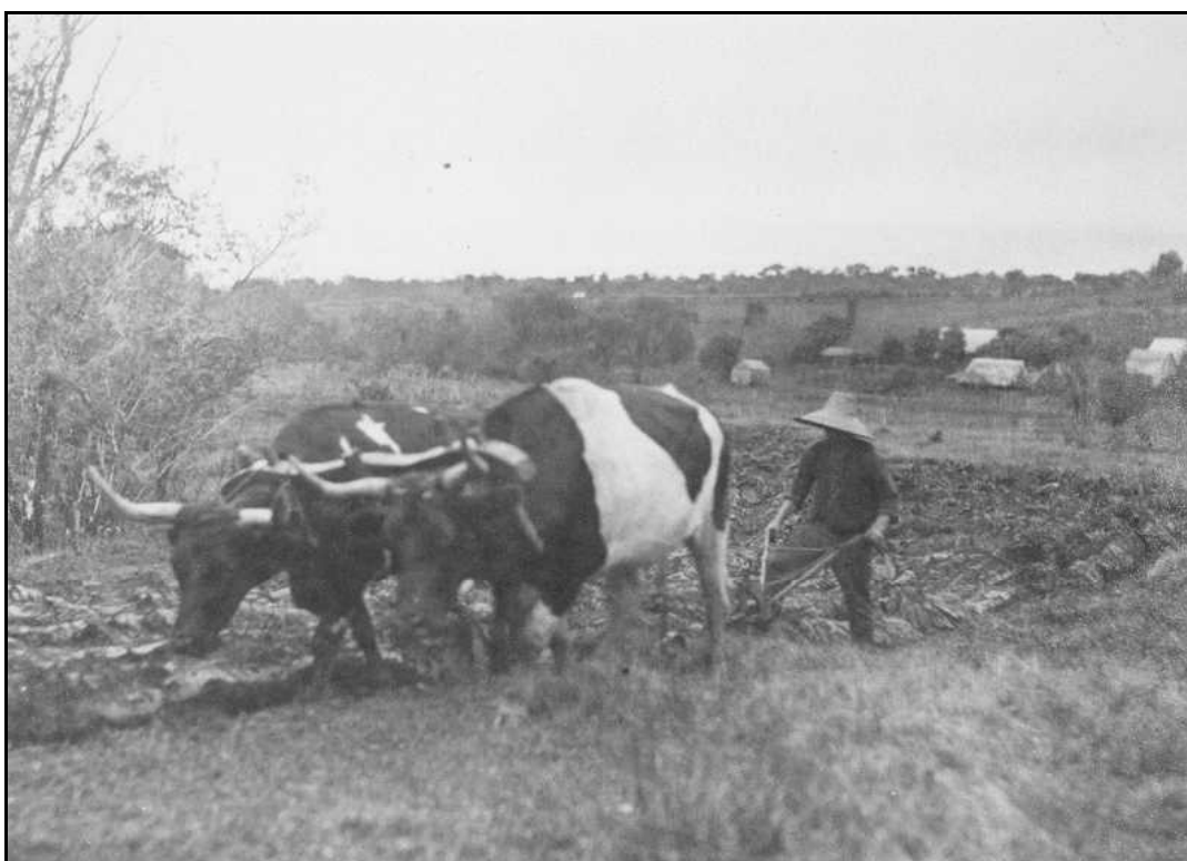
Imagem 12 – Colono (Coleção Eduardo Jaunsem, sem data).

Depois de passados alguns anos da derrubada da mata, os tocos e raízes haviam apodrecido ou então eram retirados pelos próprios colonos, o que permitia um incremento na cultura técnica com a utilização de outras tecnologias de preparação do solo e plantio.