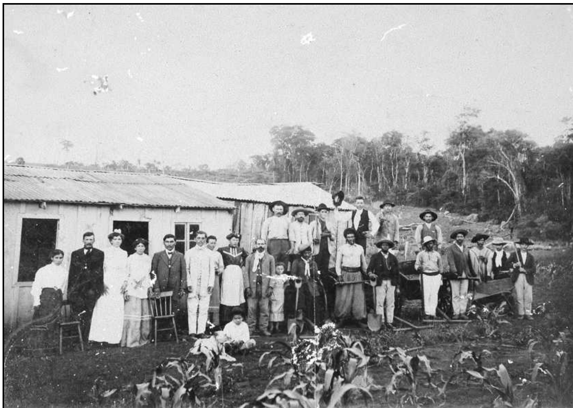
Imagem 6 – Nacionais (sem data).

Esta imagem, embora não possua data, atenta mais uma vez para a presença de negros e caboclos em Ijuí, que podem ser vistos no primeiro plano da imagem. Alguns deles trajam roupas bastante elegantes, as mulheres longos vestidos ou saias, outros sujeitos trajam roupas típicas gaúchas, como bombacha e alguns usam chapéu. Em um plano de detalhes da imagem podemos observar nas mãos dos sujeitos ferramentas de trabalho, na frente dos mesmos uma lavoura de milho se desenvolvendo, a casa coberta com zinco e janelas que aparentemente parecem ter vidro, revelando que o morador tinha alguns recursos. Já no plano de fundo algo interessante nos chama a atenção, à direita da imagem atrás dos sujeitos há uma série de árvores caídas onde está se praticando possivelmente um roçado para abertura da lavoura.