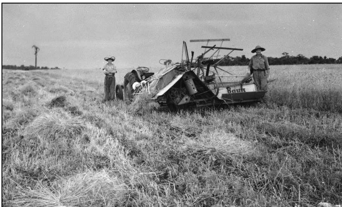
Imagem 24 – Ceifadeira puxada por trator (1946).

O plano geral da imagem apresenta uma situação de trabalho já observada anteriormente nas outras imagens, no entanto, agora com uma técnica diferenciada. A disposição dos sujeitos, da ceifadeira, da lavoura e das árvores ao fundo dão um aspecto horizontal à imagem.