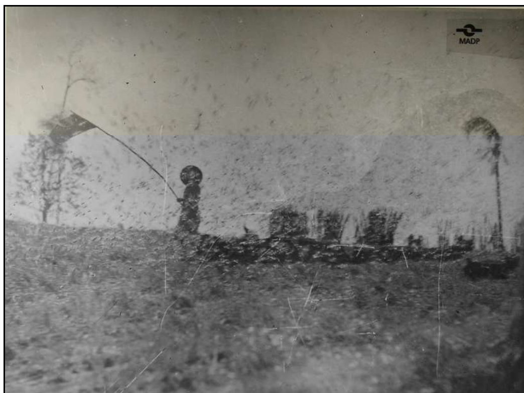
Imagem 44 – Saltões (década de 1940).

Nos anos de 1905, 1908, 1917, 1921 e 1933 os relatórios do poder público municipal de Ijuí mencionam que gafanhotos assolaram plantações em Ijuí.