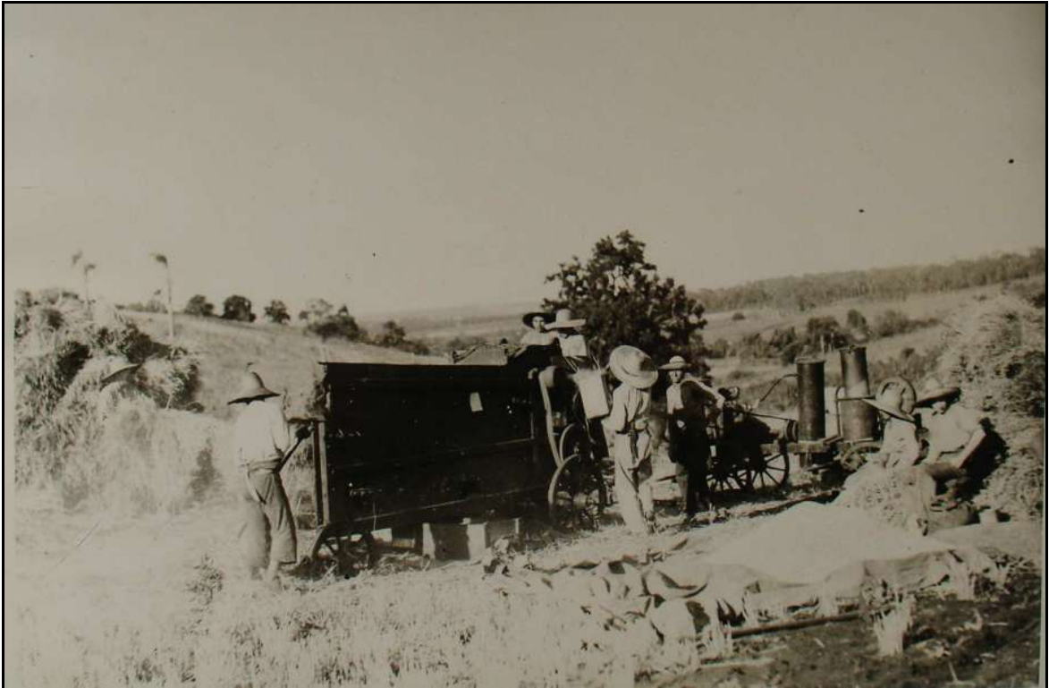
Imagem 32 – Trilhagem com motor (Coleção Eduardo Jaunsem, 1940).

Nesta imagem temos um avanço tecnológico pois se passou da tração animal para a tração mecânica. Em um plano de detalhes pode-se ver a trilhadeira, à direita da imagem podemos visualizar o motor movido a “gás pobre” ou “gasogênio”, que se encontra entre os dois núcleos de pessoas. A mudança da tração animal para a tração mecânica representa um ganho de produtividade e uma economia de tempo e trabalho, pois o motor produz obviamente mais força motriz que os animais e no momento da trilhagem não é necessário, como nas imagens anteriores, alguém cuidando para que os animais continuem a trabalhar. Também, o motor após desligado não precisa continuar sendo alimentado e cuidado, somente é necessário “alimentá-lo” quando está em funcionamento, em outros momentos somente uma manutenção é necessária. Ainda em um plano de detalhes é possível observar as sementes já separadas da palha em frente aos sujeitos sentados à direita da imagem.