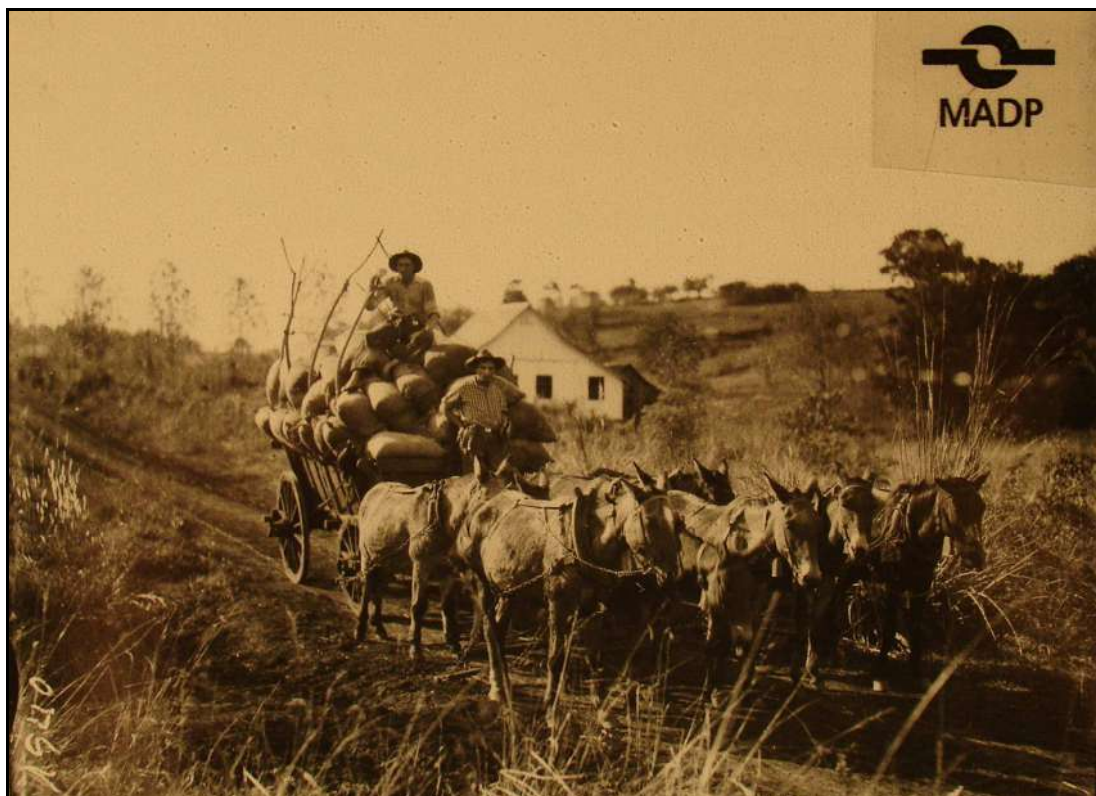
Imagem 3 – Transporte de amendoim (Coleção Eduardo Jaunsem, 1940).

Nesta imagem podemos perceber, a exemplo da anterior, um dos meios de transporte agrícola que foi muito utilizado em Ijuí, bem como as condições das estradas da colônia e a maneira como as mesmas se apresentavam em 1940, ano de produção da imagem.