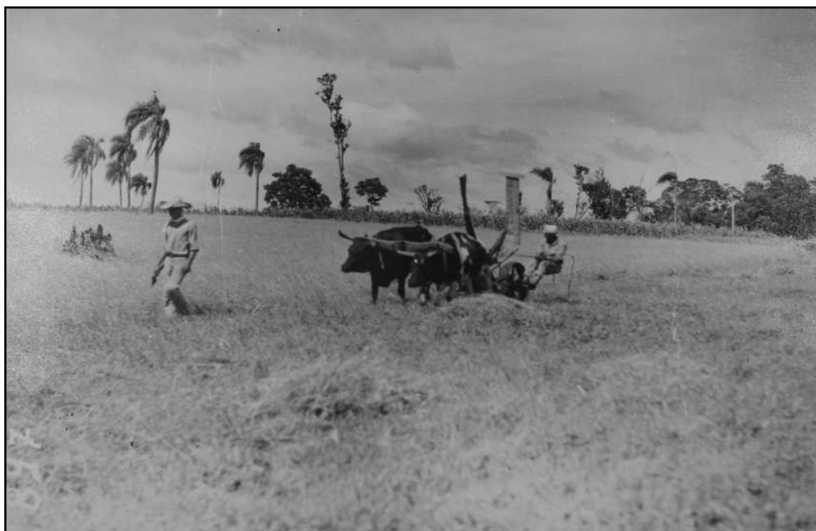
Imagem 23 – Colheita com ceifadeira (Coleção Eduardo Jaunsem, sem data).

No plano de fundo podemos observar o restante da lavoura e uma mata que se estende horizontalmente no fundo da imagem.