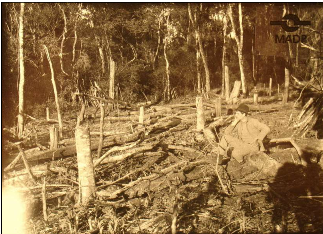
Imagem 7 – O imigrante e o roçado (Coleção Eduardo Jaunsem, 1927).

Esta imagem de 1927, pertencente à Coleção de Eduardo Jaunsem, interessante 47 sob o ponto de vista da forma da técnica de transformação, é uma adaptação inicial do ambiente de mata em ambiente agrícola pelos colonos. Podemos visualizar, em primeiro plano, o imigrante sentado sobre um tronco de árvore, trajando roupas um tanto quanto sofisticadas, calça, terno e chapéu, com a mão na cintura, cotovelo que escora o queixo sobre o joelho, olhando de forma fixa para frente, posando intencionalmente para a tomada fotográfica numa atitude de quem está pensativo.