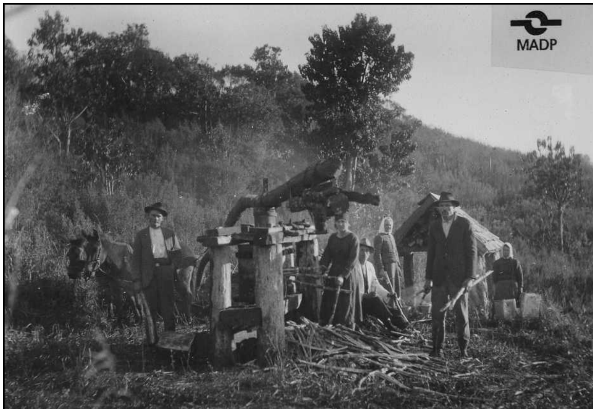
Imagem 28 – Moenda de cana-de-açúcar (década de 1920).

Esta imagem confeccionada pelo fotógrafo Eduardo Jaunsem, na década de 1920, de uma moenda de cana-de-açúcar, apresenta uma série de pessoas posando para a imagem fotográfica ao lado de uma moenda de cana. Todos trajam roupas um tanto quanto sofisticadas, os homens com chapéus de feltro, roupas grossas, as mulheres com lenços na cabeça, algumas com lenços brancos e outra com lenço escuro. Todos os sujeitos posam para a imagem olhando diretamente para a câmera, alguns seguram os pés de cana-de-açúcar, outros somente posam próximos à moenda e intencionalmente buscam construir a imagem de que são trabalhadores e desenvolvem um ofício específico.