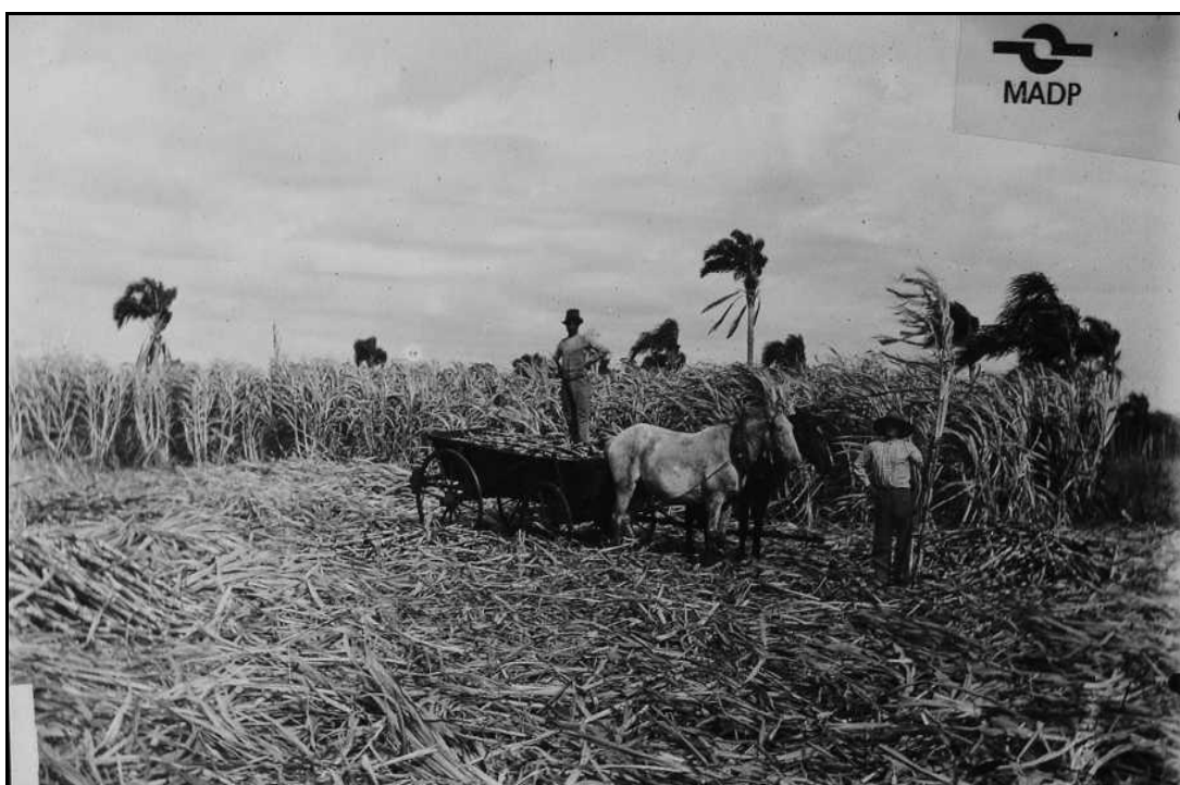
Imagem 19 – Colheita da cana (1920).

O plano geral da imagem mostra a horizontalidade da mesma, que é obtida pela disposição dos sujeitos e do que parece ser a lavoura ao fundo. Pode-se claramente perceber a intencionalidade de mostrar o trabalho que foi realizado pelas pessoas que posam mostrando seus instrumentos de trabalho e exibem o fruto de seu labor que é a lavoura colhida. A lavoura, a produção, as ferramentas simbolizam também o trabalho e o “vencer”, prosperar no novo mundo.