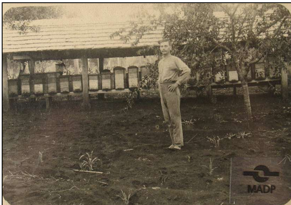
Imagem 38 – Colméias (Coleção Família Beck, 1915).

No primeiro plano desta imagem, composta em 1915, na Linha 3 Oeste, posa para a imagem o colono trajando roupas simples, com camisa e calça, mãos na cintura, um calçado que se aproxima muito dos tamancos poloneses. O mesmo posa levemente virado para a esquerda da imagem, como que se apontasse com o posicionamento do seu corpo para as colméias que se encontram atrás dele.