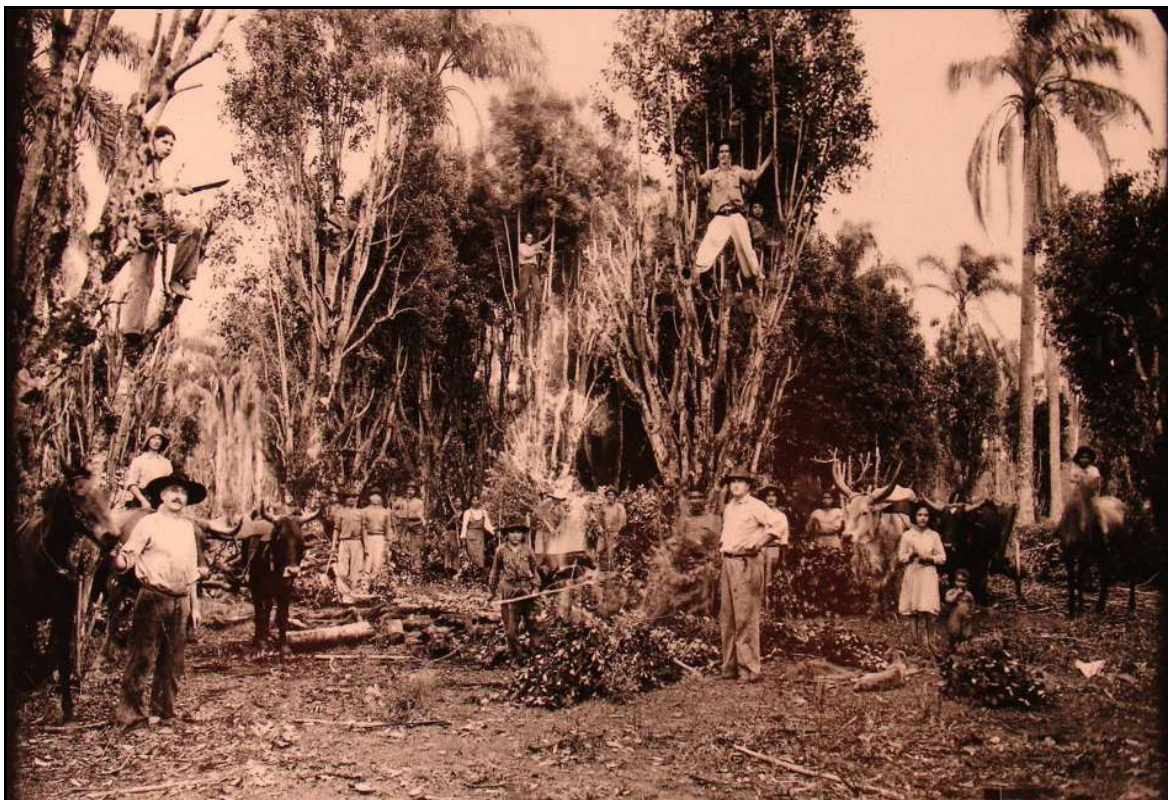
Imagem 20 – Colheita da Erva-Mate (Coleção Eduardo Jaunsem, 1950).

O plano de fundo apresenta o restante do robusto canavial ainda não cortado, além de algumas árvores.