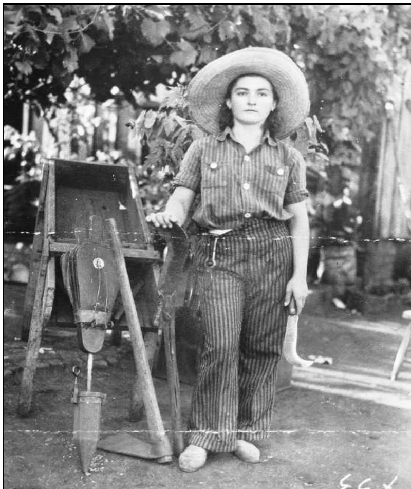
Imagem 43 – Mulher e ferramentas (Coleção Eduardo Jaunsem, sem data).

Nesta imagem é possível visualizar, em um plano de detalhes, alguns instrumentos de trabalho dos colonos, uma espécie de carrinho, um enxadão, duas foices nas mãos da mulher que posa para a fotografia, uma maior e outra menor e uma máquina de matar formigas. Esta é composta de um fole, uma pequena haste que liga o fole ao “bico” onde o veneno fica depositado e onde é injetado dentro do formigueiro.