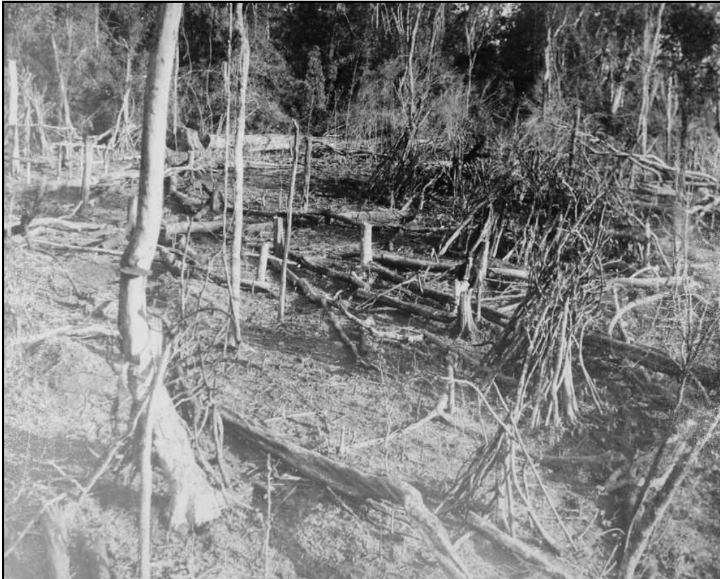
Imagem 8 – Roçado (sem data).

Nesta imagem produzida por Eduardo Jaunsem também podemos ver um roçado em que novamente será posto fogo para eliminar o restante dos galhos que não queimaram totalmente na primeira queimada realizada. No plano de fundo visualizamos a mata ainda não derrubada, embora esta imagem não possua data nos permite observar um estágio diferente da técnica de transformação e adaptação inicial do espaço.