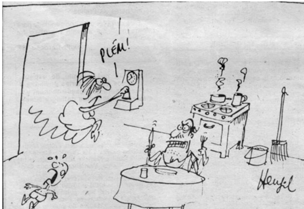
BOCHINI, Maria Otília. O trabalho dignifica o homem. Já a mulher, quem dignifica? Mulherio , São Paulo, Ano 2, n. 7, maio/jun.1982, p.4-5.

Os quadrinhos Bia Sabiá 236 publicados no periódico Nós Mulheres são um exemplo da forma utilizada pela imprensa feminista para questionar um tema pesado de forma leve e descontraída. Sob uma ótica humorística discutia questões intrínsecas ao trabalho doméstico e à dupla jornada de trabalho realizada pelas mulheres brasileiras. Assim, a discussão sobre a divisão do trabalho doméstico não poderia apenas estar