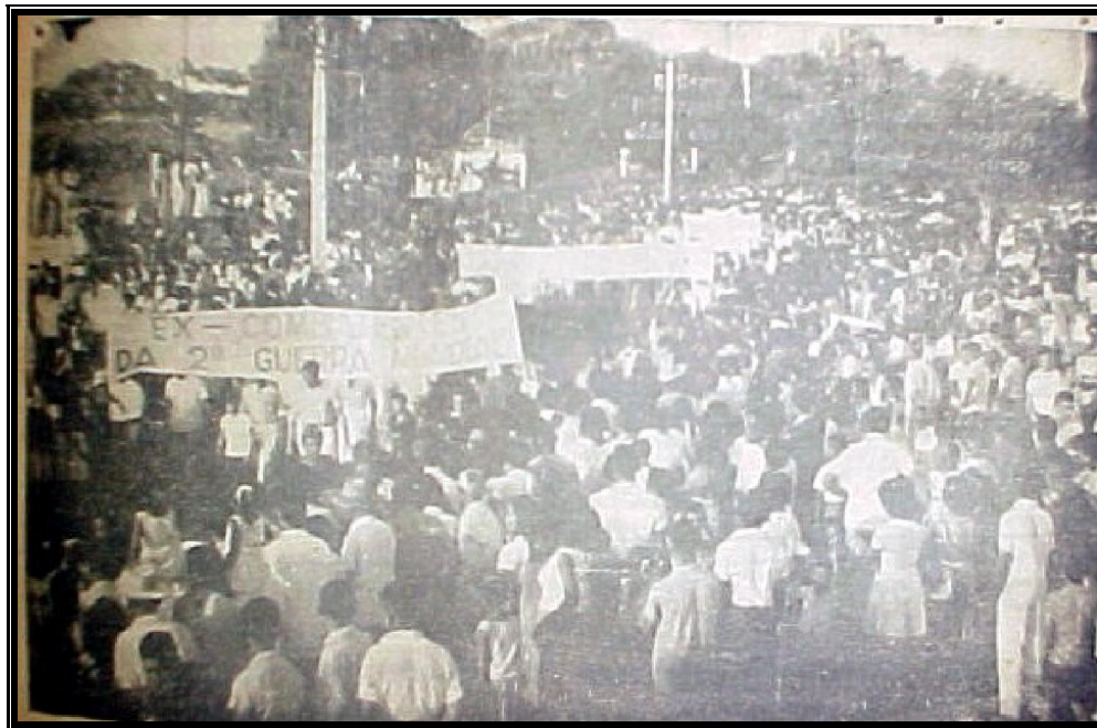
Figura 3: Marcha da Família com Deus pela liberdade no Piauí. Jornal O Dia , 15 Abr. 1964.

A repercussão da “Marcha com Deus pela liberdade” na cidade de Teresina, da forma como foi noticiada pela imprensa, leva a crer que a cidade não parou “para ver a banda passar”, mas percorreu as ruas da cidade, provavelmente cantando versos de liberdade que depois daquele momento não passariam de um grande equívoco.