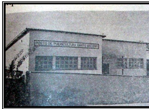
Figura 7: Centro de Puericultura. Jornal O Dominical , 16 Ago. 1964.

A imagem de homem realizador e de personalidade, que prestou grandes benefícios ao Estado do Piauí, pode ser constatada também por meio das homenagens de despedida no final do seu governo em maio de 1971. Na época a imprensa local noticiava a sua ação evangelizadora através da criação de sete novas Paróquias em Teresina, vez que, além das já citadas no corpo deste trabalho, também criou a de Nossa Senhora das Graças, Cristo Rei, Nossa senhora de Fátima, São João Evangelista, no Parque Piauí, São Raimundo, no bairro Piçarra. No interior da Arquidiocese, criou as paróquias de São Félix, na cidade de São Félix, Nossa Senhora do Perpétuo Socorro, na cidade de Água Branca e São João Batista, na cidade de Pimenteiras, além de ter se empenhado na Ação Social e Cultural. 11 O Arcebispo criou, também, a Prelazia de São Raimundo Nonato e as reuniões ordinárias e extraordinárias da Província Eclesiástica do Piauí.