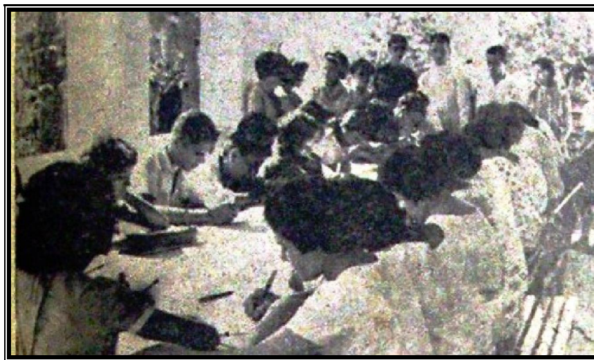
Figura 4: Equipe do MEB em treinamento. Jornal O Dominical , 24 Mai. 1964.

favorecia igualmente a possibilidade de leitura da realidade social e política, dando condições às pessoas de discutirem os problemas do país, sobretudo aqueles que interferiam na sua condição de vida e de trabalho.