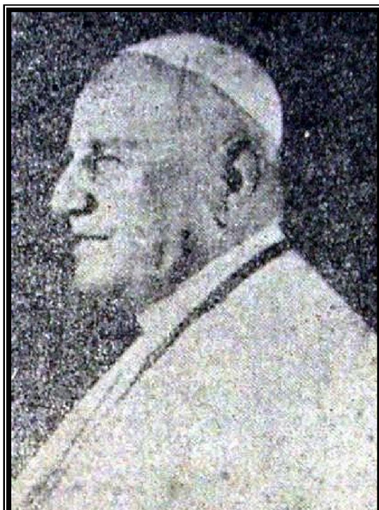
Figura 1: Papa João XXIII. O Dominical , 09 Jun. 1963.

Os ventos da história que sopraram inúmeras mudanças na sociedade brasileira nos anos sessenta chegaram ao coração da Igreja Católica que, a partir de então, começou a experimentar novas formas de ser igreja. De uma igreja que se encontrava mais voltada para o seu interior surgiu uma instituição influenciada pelas mudanças tecnológicas, emergência das ciências e preocupada com os conflitos no mundo e os problemas mais recorrentes na humanidade.