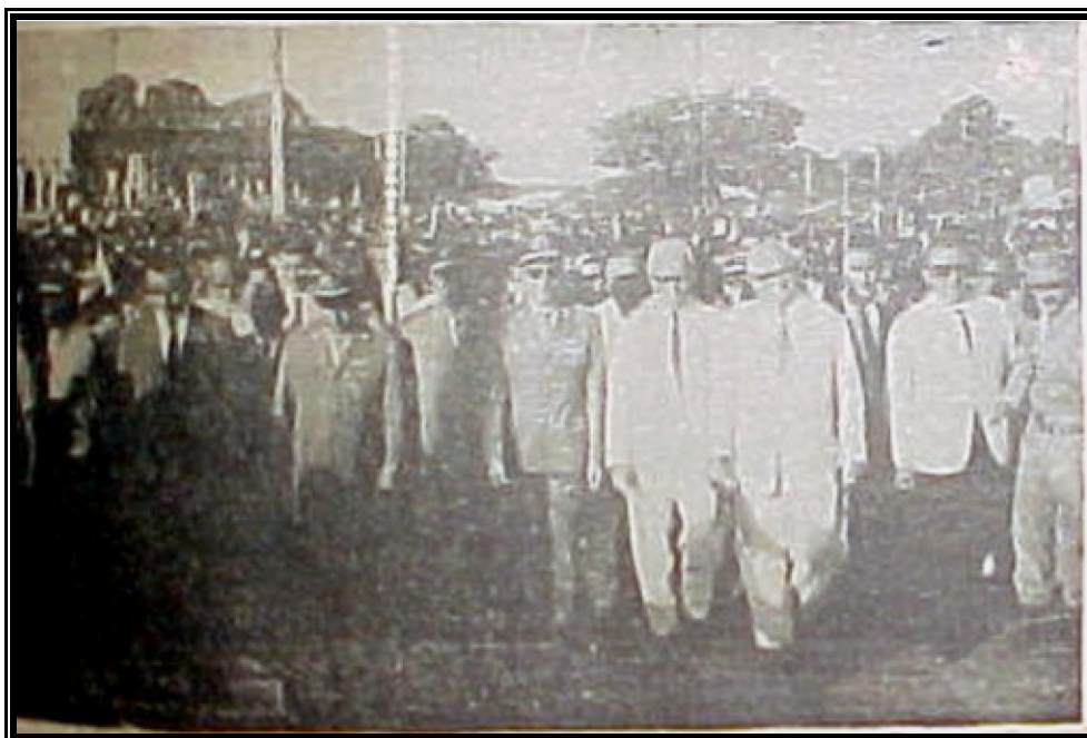
Figura 2: Marcha da Família com Deus pela liberdade no Piauí. Jornal O Dia , 15 Abr. 1964.