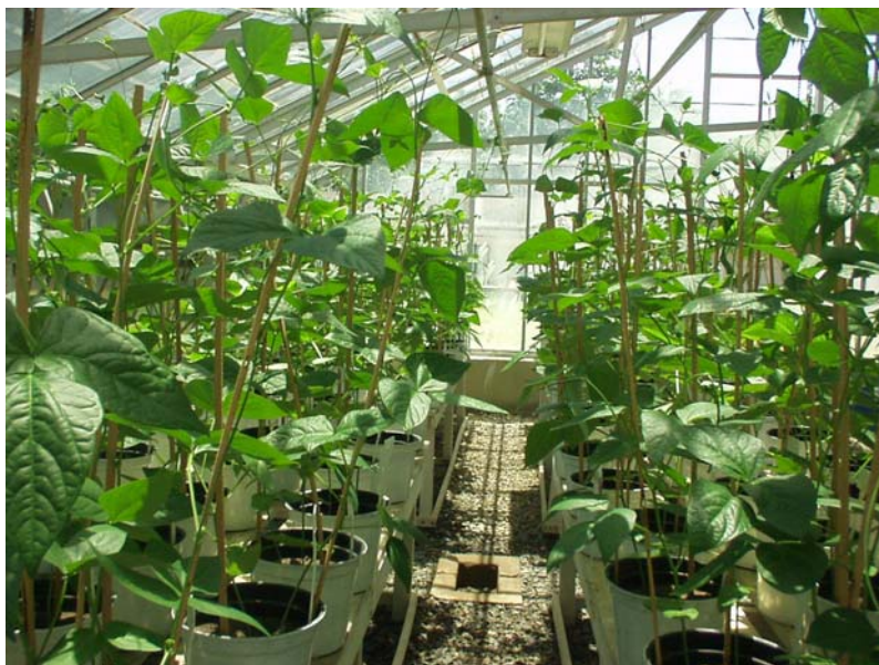
Figura 2. Plantas de caupi, cv IPA 206, com diferentes doses de LE incorporado ao solo e inoculadas com estirpes de Bradyrhizobium spp., no 45° DAP (dia após plantio) em casa de vegetação