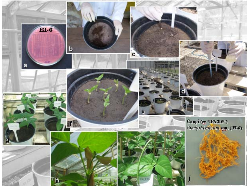
Figura 1. Etapas do experimento desenvolvido em casa de vegetação. a = estirpe EI-6 em placa de Petri no meio YMA com indicador vermelho congou; b = incorporação do LE ao solo; c = plantio do caupi cv IPA 206; d = inoculação das estirpes de Bradyrhizobium spp. nas sementes de caupi; e, f = crescimento do caupi no 4º DAP (dia após plantio); g = plantas no 10º DAP; h = surgimento de flores; i = crescimento de vagens; j = raiz do caupi inoculada com a estirpe EI-6, após coleta do experimento