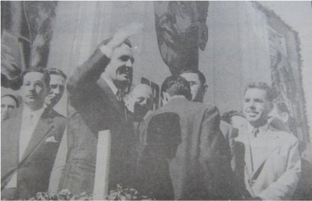
Dyonélio Machado (direita, de casaco claro) atento ouve Prestes (centro, com a mão levantada) discursar.