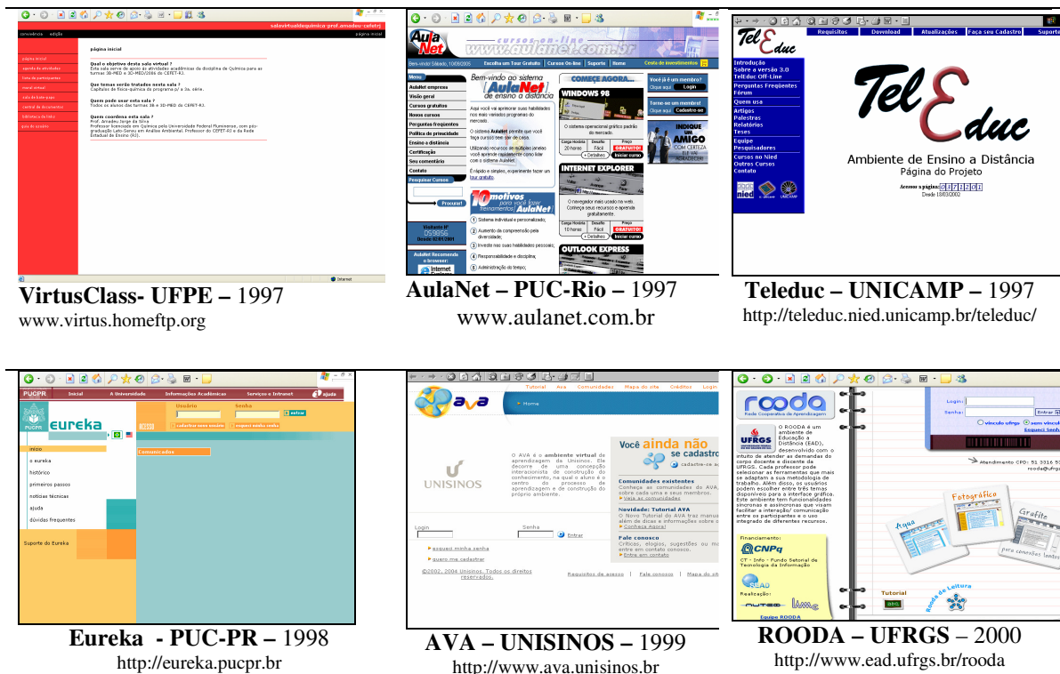
FIGURA 2 – Interface dos primeiros AVAs brasileiros

A FIGURA 2 apresenta a interface gráfica dos seis primeiros AVAs originalmente institucionalizados para uso oficial de universidades brasileiras.