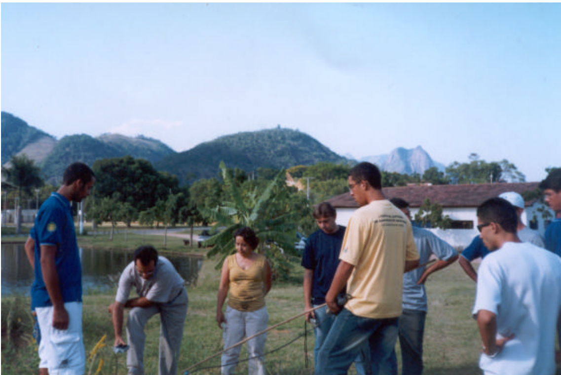
Aula prática sobre qualidade de água.