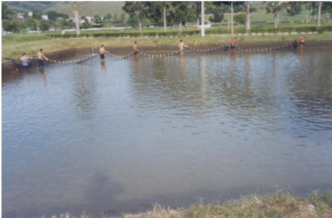
Captura dos reprodutores (arrasto).