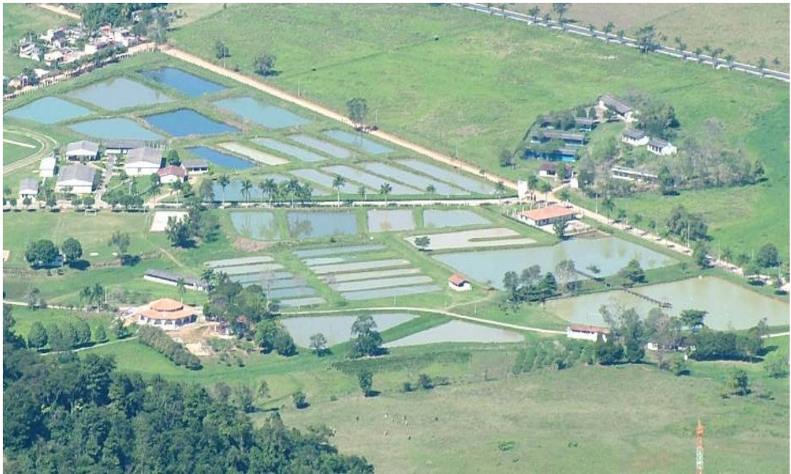
Vista aérea do setor de Aqüicultura da EAFA.