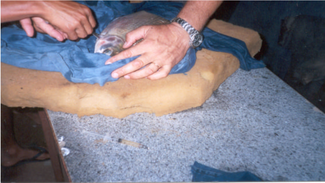
Aplicação do hormônio no reprodutor.