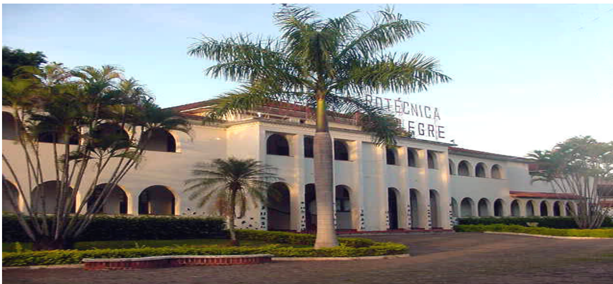
Figura 1: Fachada do prédio principal da Escola Agrotécnica Federal de Alegre - ES

escavados na área da EAFA, e foram adquiridos alevinos para formação de matrizes de carpas e de tilápias, visando o atendimento a produtores rurais e ao refeitório da Escola. A partir de 1984, a EAFA iniciou o trabalho que visava atingir um dos principais objetivos do projeto, fornecendo alevinos aos produtores de diversos municípios.