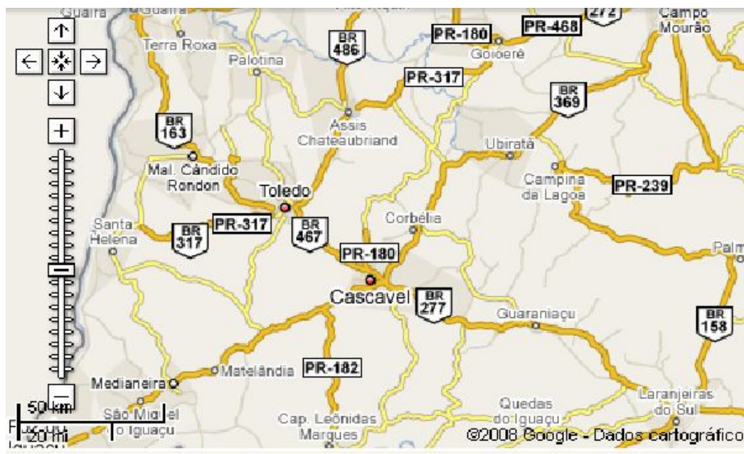
Figura 7: Imagem Google Maps Brasil. Localização das cidades Corbélia e Cascavel 145 .

teoricamente o significado da apropriação destes espaços a partir da interpretação das narrativas, seguimos a perspectiva de que existem políticas de poderes entre os espaços e que as relações de identidades presentes estão permeadas por políticas de organização destes espaços.