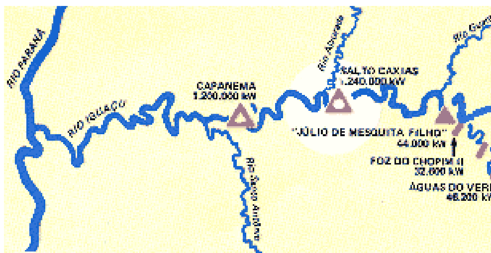
Figura 1: Esquema de localização da Usina Hidrelétrica de Salto Caxias, no Rio Iguaçu 39

A Copel já possuía vasta experiência na construção de hidrelétricas e, assim, também como lidar com os enfrentamentos e dificuldades diante dos moradores desapropriados por obras de barragens. Os moradores dos nove municípios do Sudoeste envolvidos no processo de construção do Salto Caxias tinham esta noção da demonstração de força do governo e passaram a ter contato com a realidade de outros atingidos por obras hidrelétricas. Um momento fundamental foi a participação de sindicatos locais e associações voltadas à discussão dos impactos sociais e ecológicos de projetos hidrelétricos no Brasil.