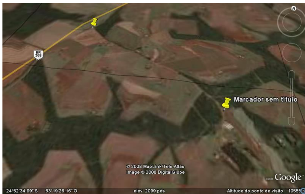
Figura 4: Vista aérea da sede do reassentamento. Destaque, também, ao trevo de acesso e estrada que liga a sede à Rodovia 369.