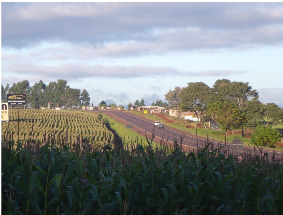
Figura 5: Acampamento do MLST na Rodovia 369. Fotografia retratada por Jorge Pagliarini Junior em frente ao trevo de acesso ao Reassentamento São Francisco de Assis, ao lado da placa que identifica a localidade (Colônia São Francisco de Assis). À frente, a cerca de 500 metros, está o acampamento do MLST.

A respeito dessas identificações, de ser confundido com assentado, nos chamou a atenção fala de seu Pedro: