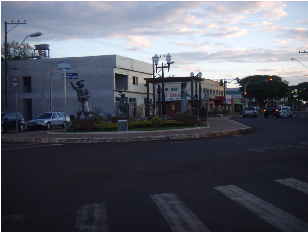
Figura 8: Monumento inaugurado em 2007 em homenagem às famílias “pioneiras” da cidade de Corbélia. Localiza-se na região central da cidade de Corbélia. As vestimentas do casal e do menino representam trajes típicos do gaúcho. O pai segura uma cuia de chimarrão, a mãe uma cesta e o filho brinca com um pássaro. Temos na escultura a harmonia nas atividades cotidianas. Corbélia, fev. de 2008.

Esta leva de colonizadores chegou ainda na década de 1940, no Norte do município, quando ultrapassou o Rio Piquiri e deu origem a Anay, hoje já emancipado de Corbélia, e ao distrito de Ouro Verde. O nome Ouro Verde, percebemos, faz alusão aos cafezais, “responsáveis” pelas transformações políticas, econômicas e sociais que demarcam as relações de poder na região e a própria paisagem desses lugares. Entretanto, pouco se fala sobre a ocupação do Norte do município.