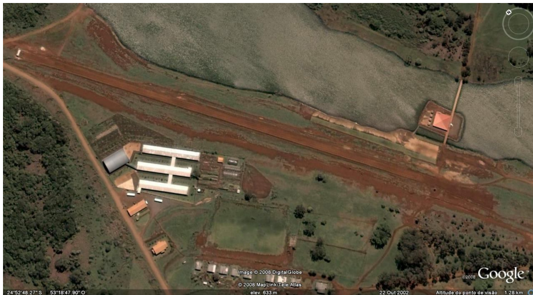
Figura 9: Imagem Google Earth, da sede do Reassentamento São Francisco de Assis. Hípica e Prainha.

Pretende-se neste capítulo discorrer sobre nossa aproximação com efetivo uso e funcionamento dessa infra-estrutura e, assim, dialogar com as atuais propostas de desenvolvimento do reassentamento (ou da colônia). Para tanto, destacaremos