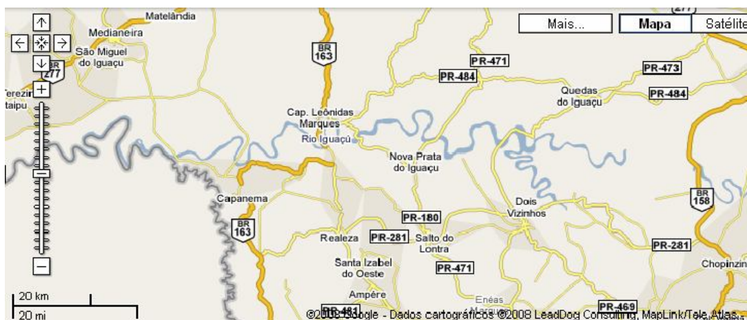
Figura 6: Imagem Google Maps Brasil. Localização dos municípios do Sudoeste do Paraná atingidos pelas águas da barragem de Salto Caxias 144 .

da memória” desta cidade 142 . O diálogo com esta obra propiciou uma abordagem preocupada com as imagens do espaço, numa perspectiva que pretendeu abranger a geopolítica e a própria paisagem urbana em suas marcas do processo histórico para, a partir desta construção, atentar aos conflitos e ambigüidades presentes no recente processo de construção deste espaço em território pelos reassentados. Algo próximo daquilo que Célia Rocha destaca enquanto uma cartografia socialmente construída 143 , pretendemos trazer diferentes temporalidades diante de um espaço, que, a priori, é homogeneizante, reforçado por poderes de políticas urbanas e ideologias pautadas nos discursos que mitificam o progresso, mas que é vivido, apreendido e construído socialmente de diferentes formas.