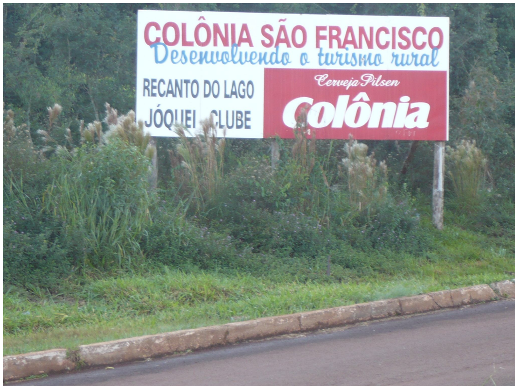
Figura 10: Placa presente no trevo de acesso ao reassentamento, nas margens da rodovia 369, entre Cascavel e Corbélia.

A placa na entrada aparece enquanto um símbolo para alguns moradores, visto que há divergências quanto à sua legitimidade. Também é um símbolo para os visitantes e para aqueles que passam por ela na rodovia que liga Cascavel e Corbélia. Mas, para os reassentados, a mudança no nome remete, muitas vezes, à história do grupo.