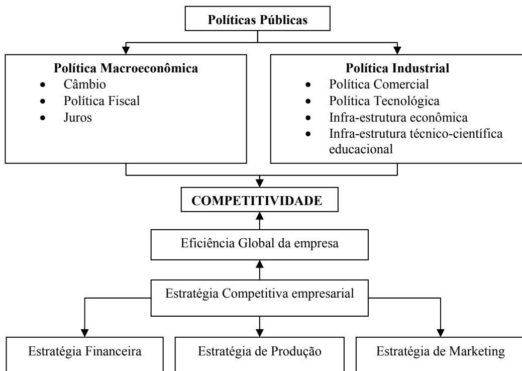
Figura 3 - Diagrama da competitividade

sustentar vantagens competitivas que lhe permitam enfrentar a concorrência, sendo essa capacidade competitiva condicionada por um amplo conjunto de fatores internos e externos à empresa. Ramalho (1991) ressaltou que esses fatores são inter-relacionados, devendo ser estudados conjuntamente, de modo que a competitividade seja, em parte, resultado dessa combinação, conforme mostrado na Figura 3.