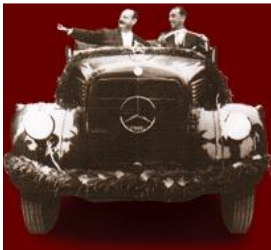
O Brasil acorda (28 de setembro de 1956)

No dia 28 de setembro de 1956, a filial da Mercedes-Benz de São Bernardo do Campo era inaugurada sob a aclamação da presidência Juscelino Kubitschek de que “ o Brasil acordou ”; nos anos seguintes, além da alemã ocidental, iam ser atraídas ao trabalho brasileiro empresas suecas, francesas e, mais tarde, ianques. Emblema da mudança na vida nacional, o número de caminhões circulando no Brasil, antes da presidência Juscelino Kubitschek, oscilava sensivelmente em razão da volatilidade no comércio internacional, atingindo o máximo de 23 mil unidades na euforia cambial do pós-1945 e apresentando tendência declinante no decênio seguinte. Na presidência JK, o teto atingiria marca próxima aos 40 mil veículos e, mesmo na estagflação da primeira metade dos anos 60, quando esta variável voltaria a flutuar expressivamente, passava a ocorrer o mais sensível: o piso da produção brasileira equiparar-se-ia ao teto de importações antes alcançado, mostrando que a cultura automobilística passava a estar, definitivamente, consolidada na vida nacional (Lessa, 1963, p. 48; Singer, 1986, p. 218-219). 40