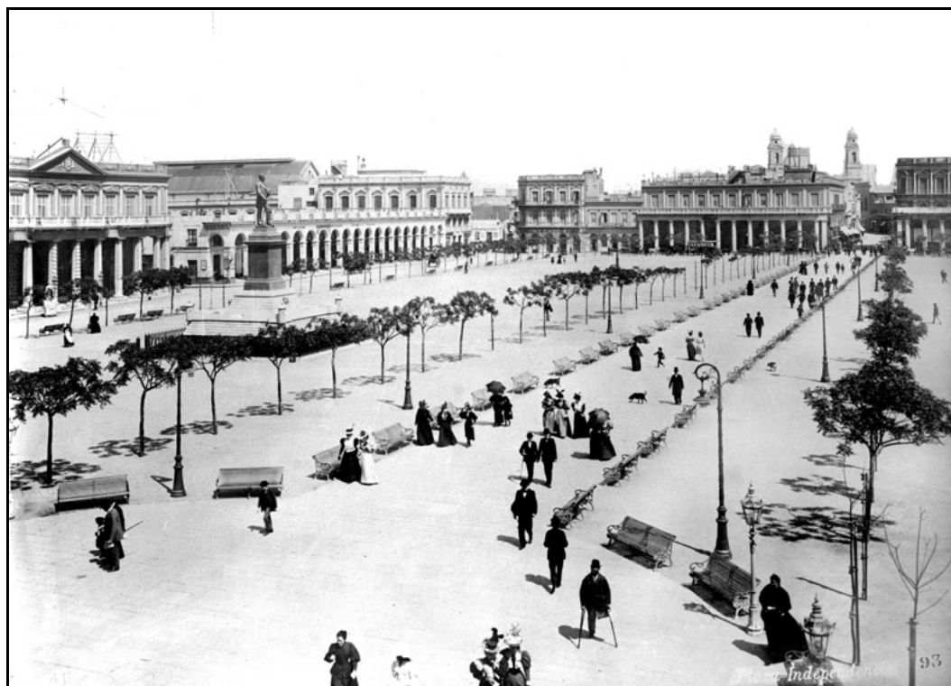
FIGURA 12 – “Vista parcial da Plaza Independencia em 1899”

estrutura, como praças, parques, investimento na zona portuária e geração e distribuição de energia, caso específico da capital Montevideú.