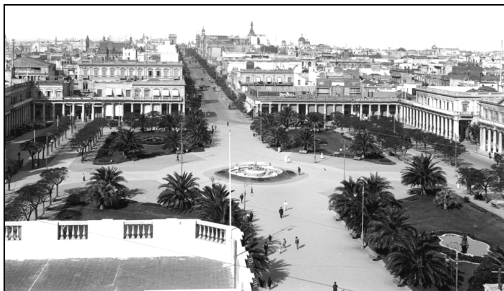
FIGURA 13 – “Vista parcial da Plaza Independencia em 1917” Com destaque para a sua nova paisagem, mais verde.

disponibilizava uma simbologia associada ao civilismo e, portanto, contrapunha-se ao tradicional militarismo caudilho . 254 Poucos anos depois, mais precisamente em 1905, a obra foi retirada da Plaza Independencia e recolocada na Avenida Agraciada 255 , deixando espaço livre para o erguimento do monumento ao General José Artigas.