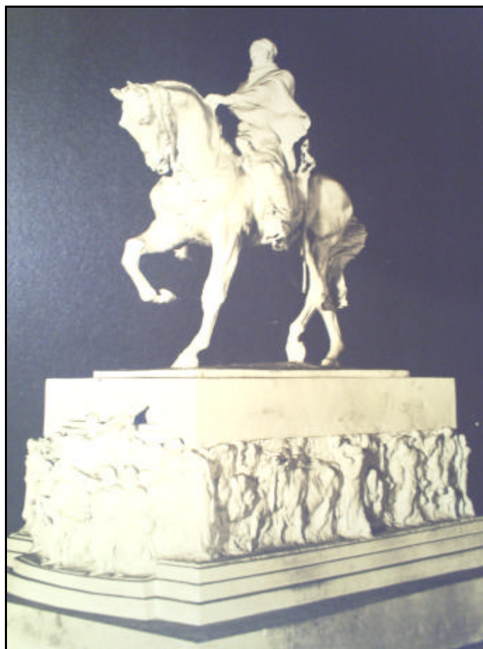
FIGURA 14 – “Maquete de Angel Zanelli” Figura em gesso, exposta no Ateneo no ano de 1913.

Já o terceiro projeto de preferência da comissão de artistas foi o intitulado Raimonda, de Romanelli, considerado bastante inferior, em termos artísticos como de impressão, aos dois primeiros citados.