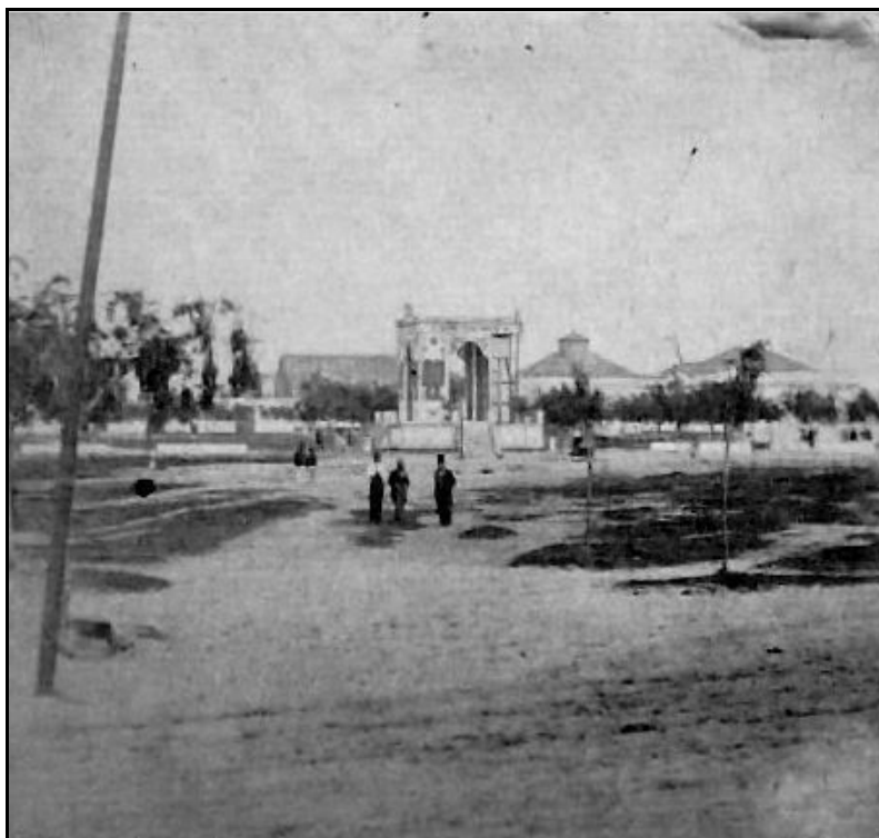
FIGURA 02 – “Vista parcial da Praça Tamandaré entre 1892 e 1900”

Desde logo, a preferência da comissão organizadora se voltou para a Praça Tamandaré, que, já naquela época, constituía-se na praça de maior extensão de todo o Rio Grande do Sul. Entretanto, esse logradouro fazia parte do processo de expansão do município que, devido ao seu crescimento, necessitava se expandir através de novos alinhamentos e ocupações.