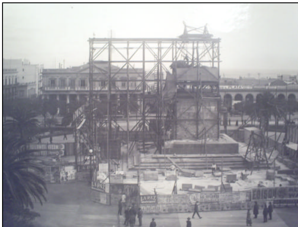
FIGURA 16 – “Instalação do Monumento a José Artigas.” Momento anterior à colocação da alegoria de José Artigas.

prevalecer sobre o pragmático; em terceiro lugar, o periódico ressaltava a sua data preferida, 25 de maio, por uma razão histórica rio-platense. ( El Bien Publico , Cuando debe inaugurarse la estatua de Artigas?, 06/01/1913. p. 1)