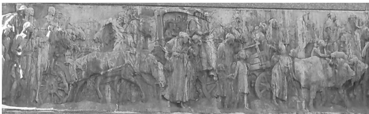
FIGURA 20 – “Baixo-relevo direito do Monumento a José Artigas” Com destaque para as figuras representativas do “Êxodo Oriental”.

Representando o primeiro posicionamento sobre a questão, encontrava-se o periódico simpático à causa colorada , Las Noticias . Embora fizesse parte de um grupo expressivamente menos numeroso, de forma irônica a folha declarou que Angel Zanelli, influenciado pelo ímpeto de Giuseppe Garibaldi, teria modelado os baixos-relevos povoados de “ gauchos italianos ”, (FIG. 19) o que poderia levar as pessoas a crer que a pessoa que acaudilhava o povo não seria José Artigas, o vencedor da Batalla de Las Piedras. ( Las Noticias , 13/01/1923. Una buena idea. p. 1) Essa fora a justificativa utilizada pelo jornal para que a comissão efetivamente instalasse um letreiro com o nome Artigas , na base do conjunto alegórico. Sem ele, de acordo com o discurso do Las Noticias , as pessoas poderiam não saber, ao certo, a figura homenageada, numa clara crítica à imagem “italianizada” esculpida pelo artista.