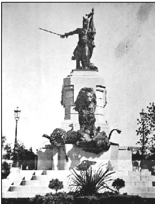
FIGURA 10 – “Monumento-túmulo a Bento Gonçalves” Vista frontal da obra.