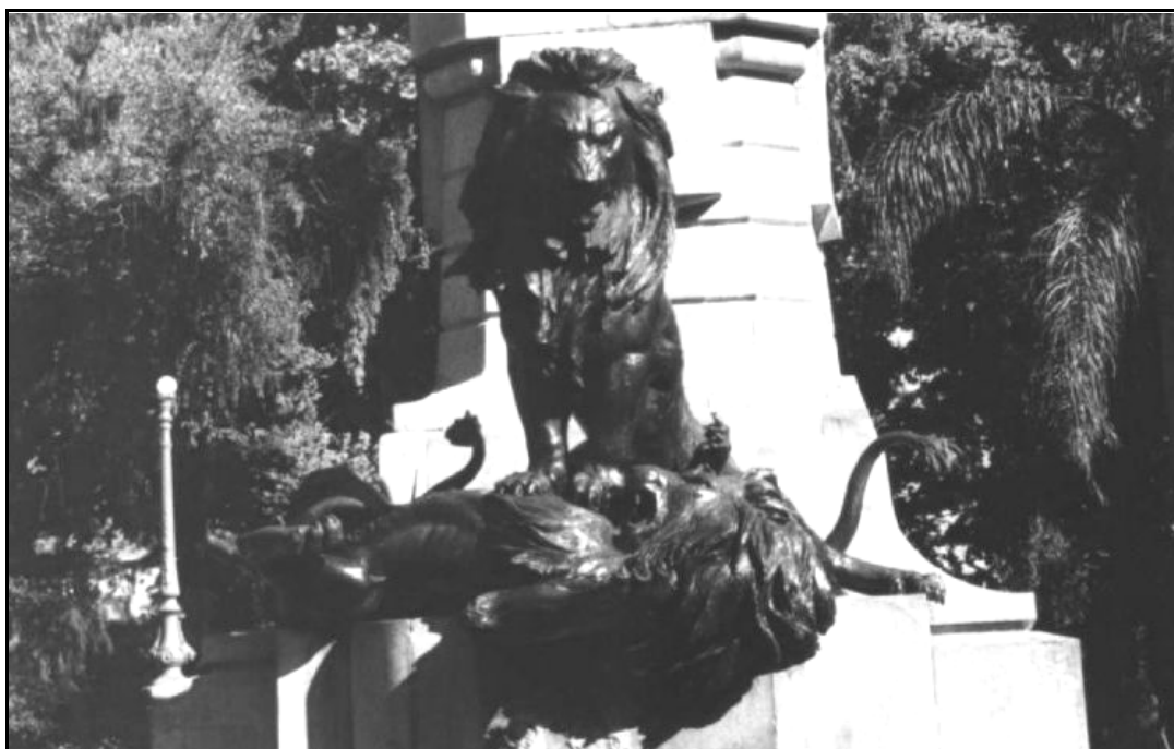
FIGURA 06 – “Alegoria dos Leões do Monumento a Bento Gonçalves” Peça simbolizando a luta entre republicanos e monarquistas.

Os insuficientes recursos arrecadados fizeram com que a comissão solicitasse ao escultor algumas mudanças no conjunto do monumento. O grupo dos leões, (FIG. 06) alegoria que encareceu, consideravelmente o preço total da obra 239 , no pensamento de Teixeira Lopes contribuía para aumentar a grandeza do conjunto. De acordo com o discurso do escultor, a estética não foi a única razão para a defesa desta alegoria. Segundo ele, após um imenso trabalho os dois leões já estavam praticamente concluídos. Caso a Comissão resolvesse desistir dessa alegoria, isso causaria um imenso prejuízo e, além disso, o escultor explicava que a cobrança pelo trabalho ocorreria da mesma forma. (Carta enviada à Comissão, 02/01/1905 - Coleção de documentos, listas de subscrições e atas pertencentes à comissão promotora )