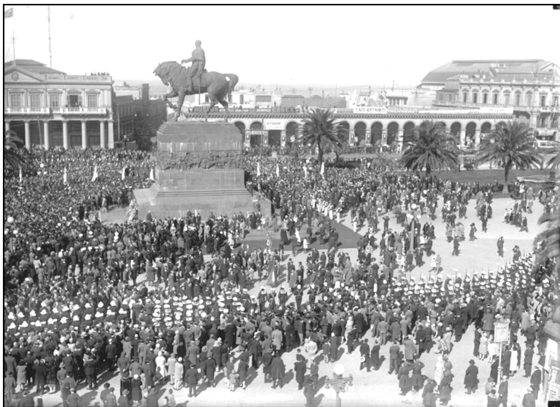
FIGURA 18 – “Cerimônia de inauguração do Monumento a José Artigas” Vista parcial da Plaza Independencia em 28/02/1923.

procedimento de reparação. Pelo seu empenho para com o povo, Artigas estaria enfim sendo reconhecido e homenageado.