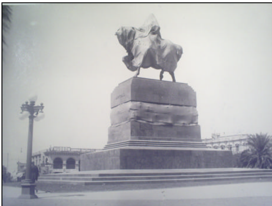
FIGURA 17 – “Monumento a José Artigas encoberto” Fotografia tirada poucos dias antes da inauguração.

Curiosamente por apenas um dia, o El Bien Publico pôde comemorar a mudança da data de inauguração da obra. No começo de fevereiro, o Conselho Nacional fixou o 13 de abril como o dia a ser oficialmente celebrado o monumento. Como alusivo ao dia do pronunciamento das Instrucciones del Año XIII , o diário avaliava muito favoravelmente essa data, pois, além de desassociar essa inauguração das disputas e da apropriação, principalmente, do Presidente Brum, ela representaria uma face estadista, legisladora e democrática do personagem Artigas, fugindo da tradicional imagem puramente guerreira. Sobrepunha-se às idéias sobre o líder com “ personalidad del caudillo, sucesivamente afortunado y vencido en el azar de sus guerrillas libertadoras ”. ( El Bien Publico , 09/02/1923. El Monumento a Artigas. p. 1) No entanto, já no dia posterior ao artigo, a folha veio a público noticiar e comentar o retorno da inauguração ao dia 28 de fevereiro, acusando-o de ser um ato visivelmente político: