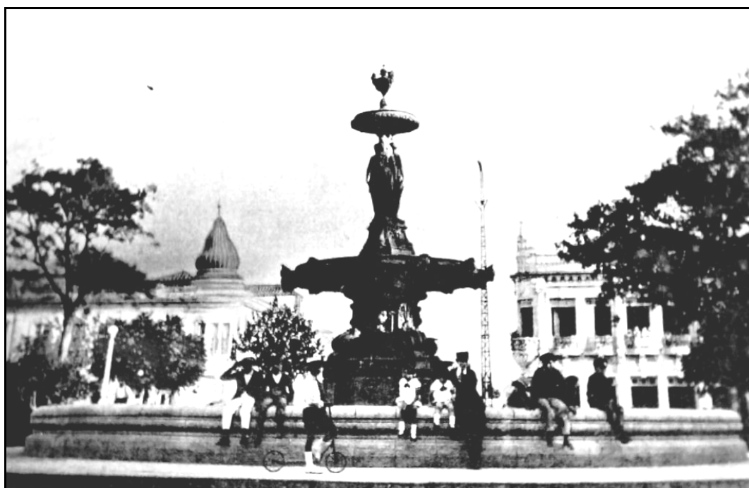
FIGURA 03 – “Chafariz da Praça General Telles no início do século XX”