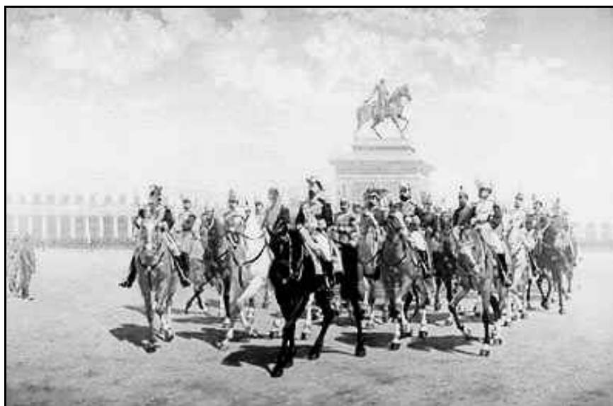
FIGURA 11 – “Máximo Santos y su Comitiva” Pintura a óleo representando o Presidente Máximo Santos e sua comitiva na Plaza Independencia. Ao fundo, o idealizado monumento a General Artigas (1885-1886)

O período foi marcado pela quantidade significativa de projetos de monumentos a serem erguidos na capital uruguaia. Poucas semanas após o projeto da obra homenageando Artigas, foram aprovadas mais duas estátuas que, de certa forma, demonstravam as raízes da compreensão aberta e cosmopolita da nacionalidade que caracterizou a tradição liberal do partido Colorado nesse período: uma ao Bruno Mauricio de Zabala 248 e outra a José Garibaldi. Já em 1884, foi a vez de se conceber uma estátua em homenagem ao General Rivera na Plaza Cagancha. Todos esses últimos heróis citados, em detrimento de personagens ligados às tradições blancas , haviam lutado em favor do Partido Colorado. (FREGA, 1993: 126)