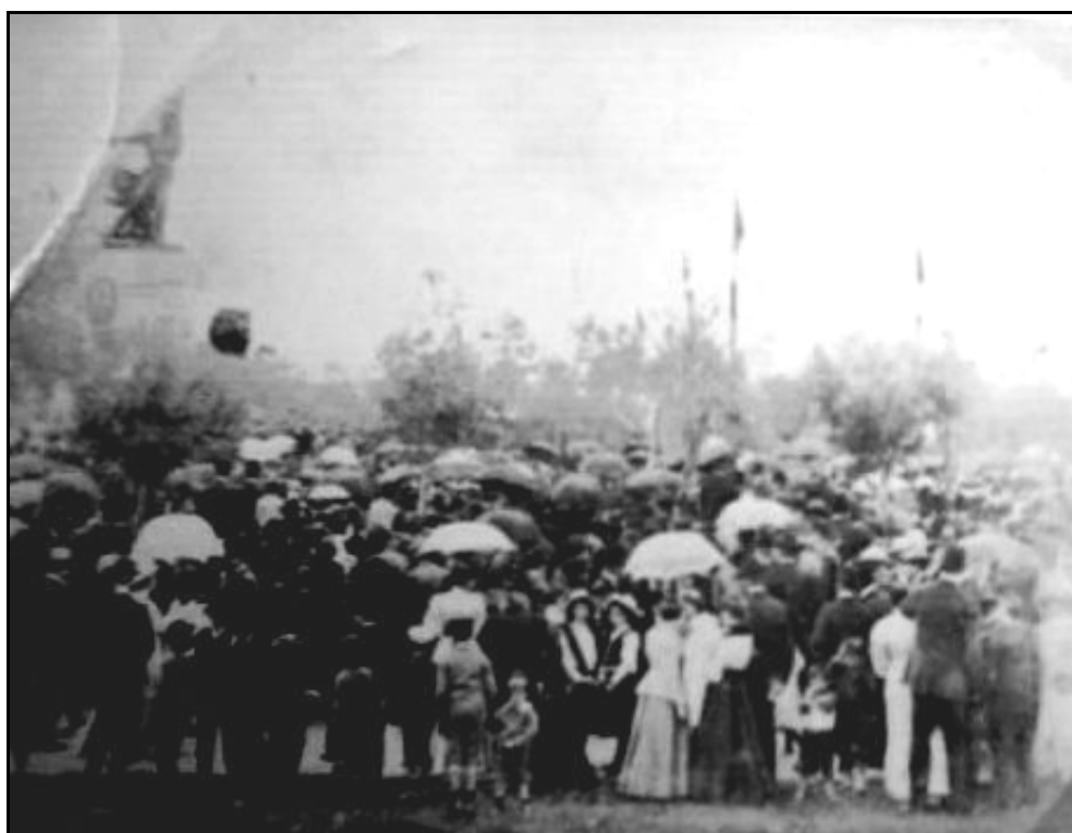
FIGURA 05 – “Cerimônia de inauguração do monumento a Bento Gonçalves (20/09/1909)”

dia simbolizava melhor o ideário pretendido com o monumento-túmulo ao herói . Enquanto que, para intelectuais não republicanistas como Alfredo Ferreira Rodrigues, a Revolução Farroupilha e o 20 de Setembro significavam o tempo épico do povo gaúcho , para os republicanos castilhistas elas representariam o próprio regime pelo qual eles tanto lutaram, constituindo-se, para alguns desses, no “14 de Julho” sul-rio-grandense. 234