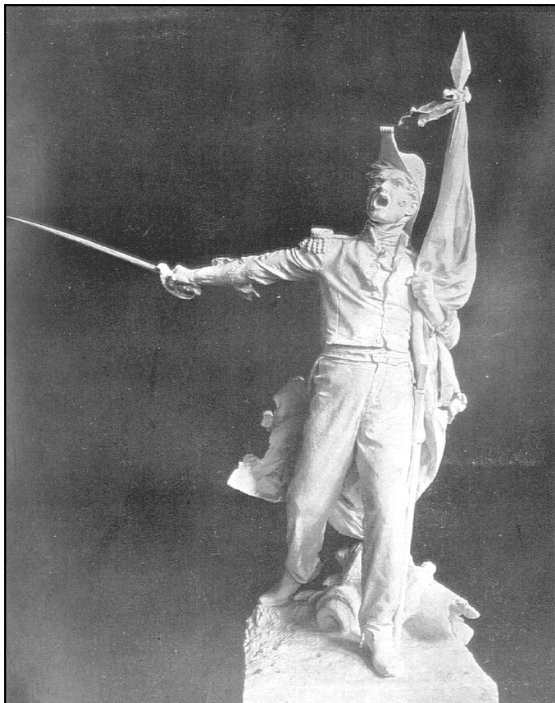
FIGURA 07 – “Capa da publicação Arte , da cidade portuguesa do Porto, abril de 1905” No detalhe a estátua de Bento Gonçalves, ainda sem a cobertura de bronze, ilustrando a atenção dada ao artista e a sua obra em Portugal.

que os farroupilhas tiveram de sustentar. (Carta de Teixeira Lopes à comissão, 01/08/1904 - Coleção de documentos, listas de subscrições e atas pertencentes à comissão promotora )