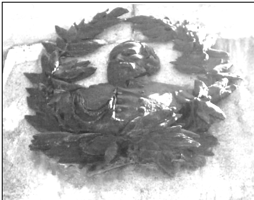
FIGURA 08 – “Medalhão representando Giuseppe Garibaldi”

comemoradas no dia 20 de Setembro. Por isso, muitas vezes, dividiram as mesmas praças para as celebrações, praticando homenagens comuns às duas datas.