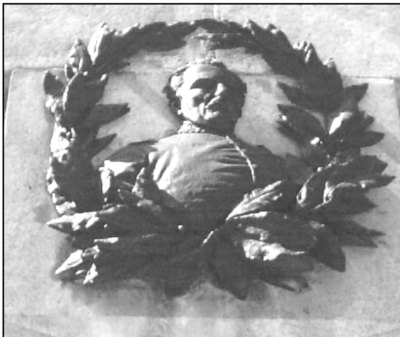
FIGURA 09 – “Medalhão representando General Netto”

Na parte posterior do pedestal do monumento-túmulo, estão presentes outras duas alegorias: as palmas e os louros . A primeira simbolizando a vitória, a ascensão, a regenerescência e a imortalidade 242 , todas elas características associadas constantemente a Bento Gonçalves. A vitória republicana atribuída ao general, mesmo que ocorrendo décadas após a sua luta, somente em 1889, teria tido muito do seu esforço e luta empreendido no decênio farroupilha , mantendo-se a imortalidade de seu ideal político e de seus valores morais heroicizados. A imortalidade também é expressa pela segunda alegoria tratada. Os louros representam uma planta que, mesmo no inverno, permanece com sua cor verde, simbolizando o triunfo. Segundo Cirlot, não existe obra sem luta, sem triunfo. Por isto os louros expressam a identificação progressiva do lutador com os motivos e finalidades de sua vitória. (CIRLOT, 1984: 351). Assim, seu ideal republicano permanecera vivo mesmo após a Paz de Ponche Verde. 243