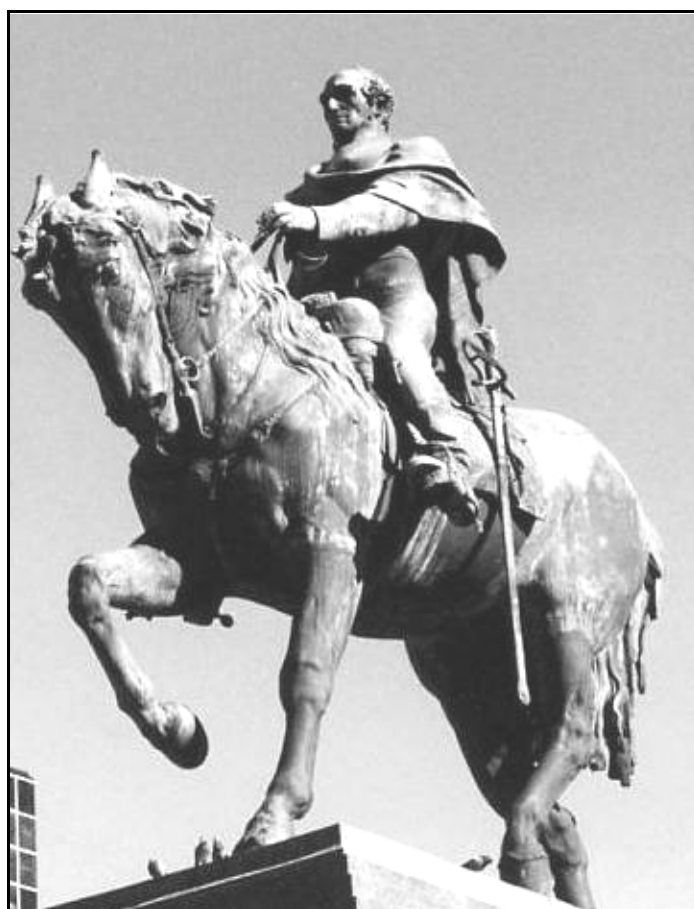
FIGURA 19 – “Alegoria eqüestre de José Artigas”

De forma inerente, as figuras eqüestres tendem a simbolizar uma liderança vitoriosa, uma representação do triunfo e da glória do cavaleiro: “ assim como ele doma sua montaria, dominou forças adversas ”. (CHEVALIER & GHEERBRANT, 2001: 200) Aparentando uma idade mediana, nem tão jovem como algumas de suas gravuras, nem com idade tão avançada como encontrado em suas primeiras pinturas, a efígie de José Artigas procura transmitir um sentimento de força e serenidade ao observante, fugindo do simbolismo que determinasse a representação de um campo de batalha. (FIG. 18)