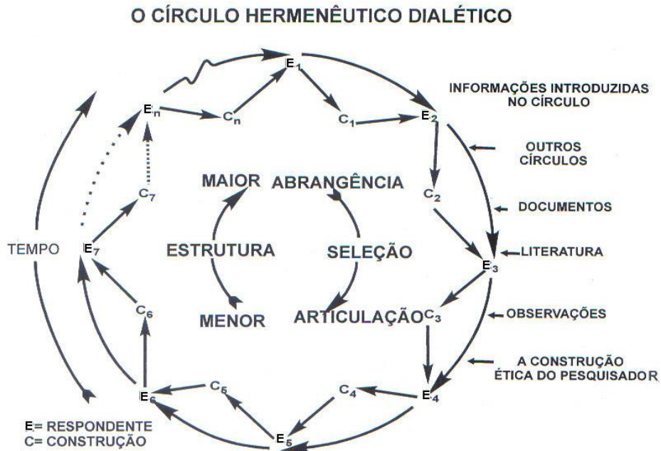
Figura 1 - Tradução do Círculo Hermenêutico Dialético

construção (C2) e assim ocorre até chegar ao último entrevistado, fechando o círculo entre os participantes.