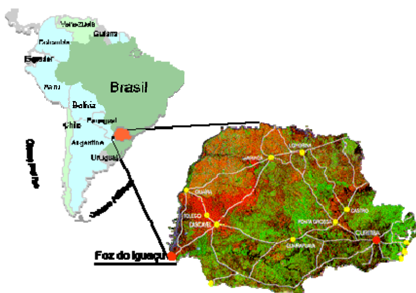
Figura 2 – Mapa e localização de Foz do Iguaçu

O Centro de Atenção Psicossocial Flávio Dantas de Araújo localiza-se no bairro Morumbi I, na cidade de Foz do Iguaçu, no estado do Paraná. O Estado do Paraná possui 399 municípios e a cidade de Foz do Iguaçu tem uma população estimada de 309 mil habitantes, área urbana de 165,50 km 2 e uma área rural 164,50 km 2 , de acordo com seu site oficial 1 .