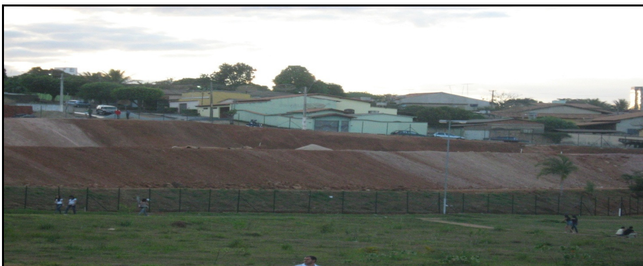
Figura n° 1 – Construção às margens do Lago no Parque JK

[...] O aumento da população e a ampliação das cidades deveriam ser sempre acompanhados do crescimento de toda infra-estrutura urbana, de modo a proporcionar aos habitantes uma mínima condição de vida. Infelizmente, nem sempre ocorre o que seria desejável. Esse processo tem exteriorizado custos sociais e ecológicos na forma de saturação dos níveis de poluição [...]