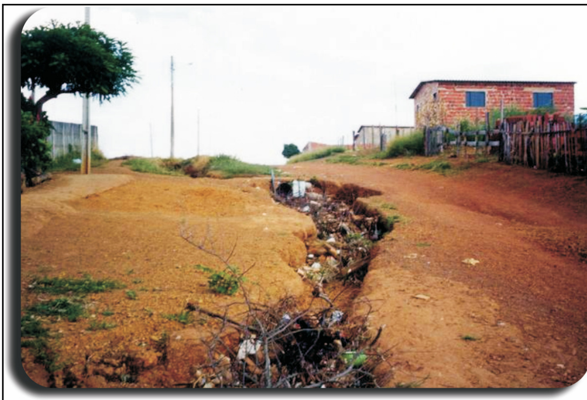
Figura nº 7 - Voçorocas no Bairro Vivian Park decorrentes da ausência de pavimentação e drenagem

Anápolis, assim como a totalidade das cidades brasileiras, adota para o saneamento do meio urbano, o sistema separador absoluto, em que as águas provenientes do escoamento superficial (águas de chuva) têm destinação diferenciada das águas servidas (AGENDA 21 ANÁPOLIS, 2007, p. 31).