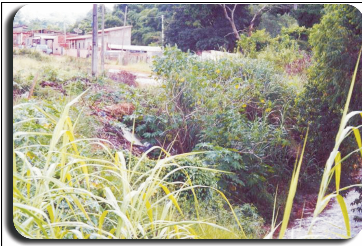
Figura nº 5 - Anápolis City degradação das margens do Córrego Água Fria

Áreas de Preservação Permanentes (APPs) visam proteger, essencialmente, a vegetação que margeia as nascentes, os cursos d'água, os lagos e os reservatórios artificiais, as encostas com mais de 45° de inclinação e os topos dos morros. Com isto, procura-se proteger as áreas ecologicamente vulneráveis às ações antrópicas na paisagem rural e também nas paisagens urbanas (BURJACK, BORBA e MORAIS, 2007, p.138)