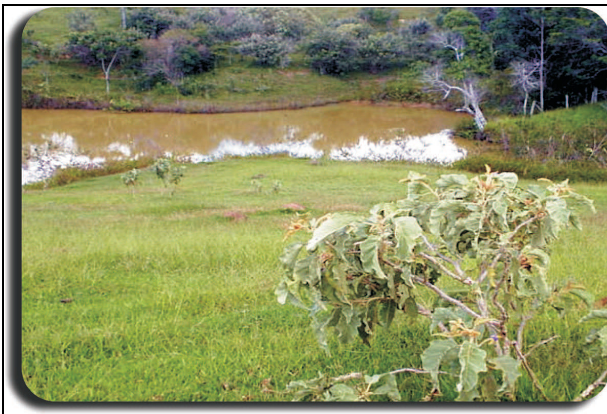
Figura nº 4 - Ribeirão Piancó com ausência da mata ciliar nativa.

As Áreas de Preservação Permanente são destruídas: As nascentes, os cursos d’água, os lagos e os reservatórios degradados.