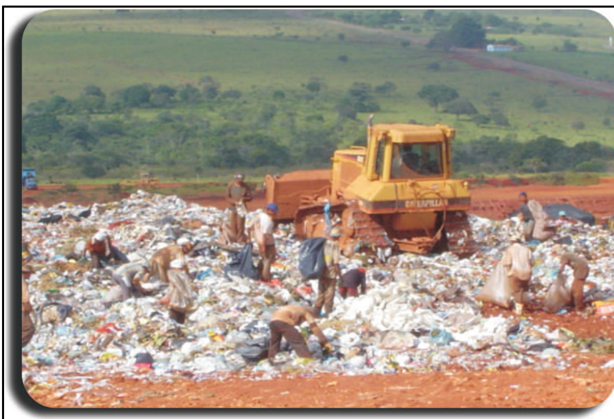
Figura n° 2 - Catadores dentro do aterro sanitário de Anápolis

Conforme Figura n° 2, apresentada a seguir: