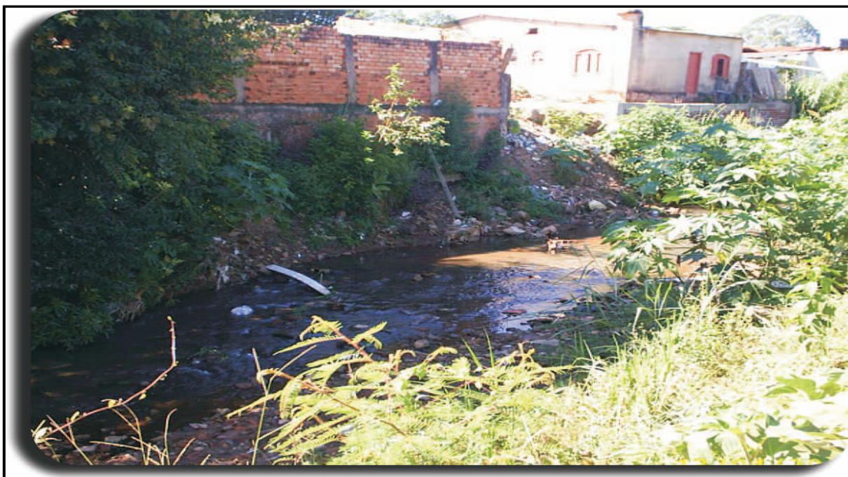
Figura n° 6 - Casas edificadas em área de risco às margens do Córrego Água Fria Fonte: SEMMARH - Anápolis/2005, Figura extraída do Plano Diretor Participativo do Município de Anápolis (2005/2006, p.138).

As áreas demarcadas com susceptibilidade de risco em Anápolis recebem essa caracterização por sua exposição a risco geológico, intensificado devido à urbanização não planejada e por estarem, em sua maioria, em fundos de vale e planícies de inundação. Estas áreas encontram-se principalmente ao longo do Rio das Antas e seus afluentes e, no Córrego Catingueiro, que pertence à Bacia Hidrográfica do Rio João Leite, todas no perímetro urbano, com grande número de edificações e alto grau de ocupação humana (PLANO DIRETOR DE ANÁPOLIS 2005/2006, p. 138).