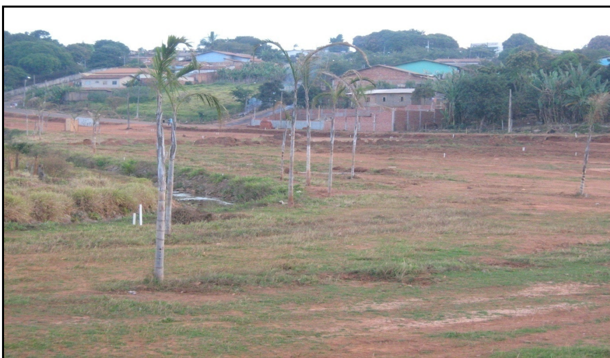
Figura nº 3 – Desmatamento no Município de Anápolis

Em Anápolis ocorrem desmatamentos indiscriminadamente: a vegetação florestal do município não está devidamente preservada; ocorre destruição da fauna e da flora; perda sistemática da cobertura vegetal natural.