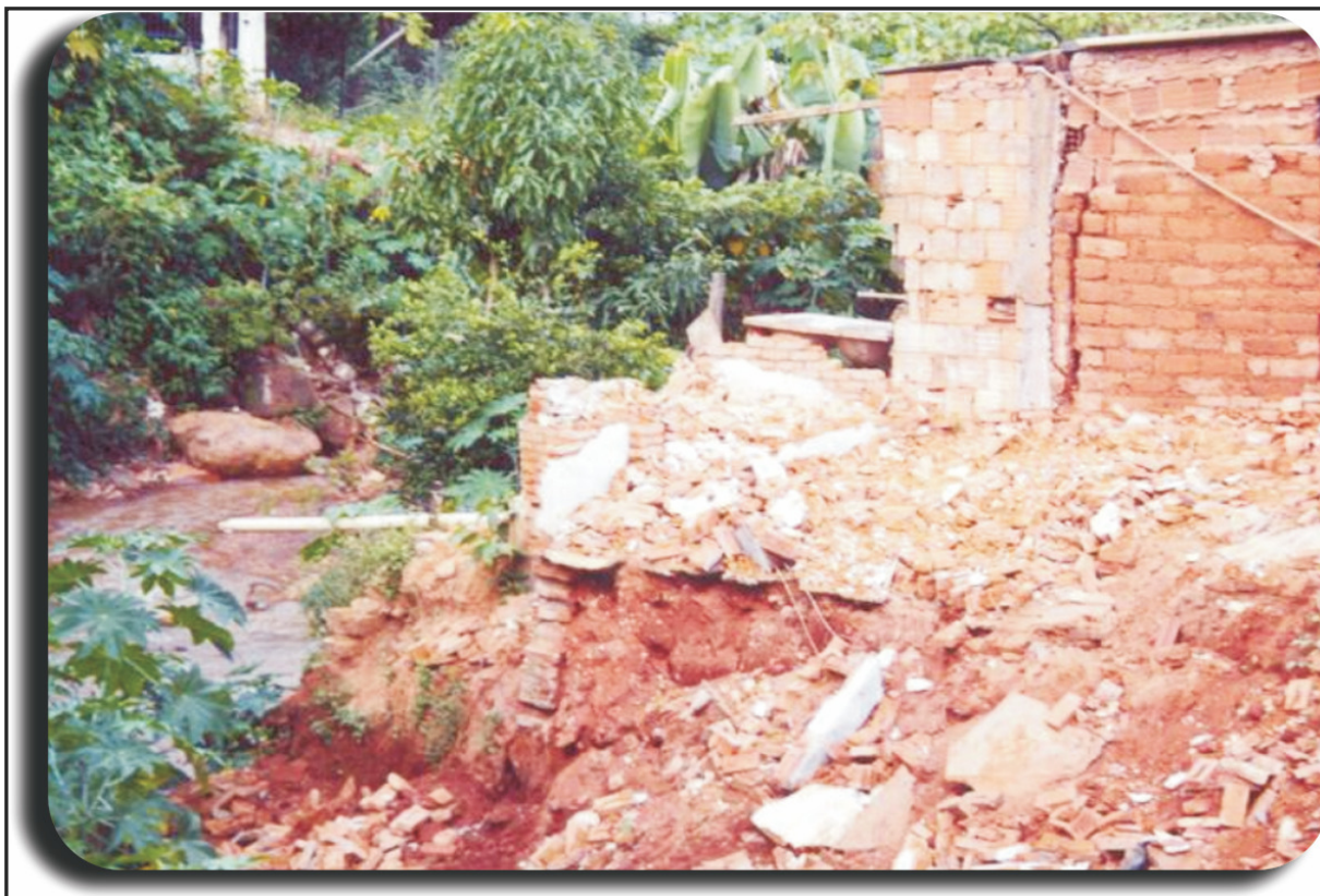
Figura nº 8 - Anápolis City - erosão e desabamento nas margens do Córrego Água Fria

Burjack, Borba e Moraes (2007, p. 138) resume que “[..] O quadro de devastação do município de Anápolis é um representativo do que está acontecendo nas regiões do Cerrado do Brasil[...]”.