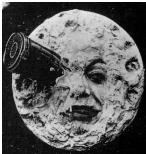
A primeira imagem icônica do cinema: a lua zarolha de Méliès (Figura 2)

O confronto entre as duas imagens é um ponto de partida produtivo à explanação de duas tendências teórico-críticas que marcaram a reflexão sobre o cinema durante boa parte do século XX. De um lado, encontramos os teóricos e críticos da chamada escola formativa ou formalista; do outro, os militantes da tendência realista. Numa definição proposta por André Bazin, pode-se dizer que os formalistas são “os que acreditam na imagem”, e os realistas, “os que acreditam na realidade” 58 . A tendência formalista se relaciona com a aceitação militante da interferência humana sobre as imagens; o cinema é visto como a arte de produzir imagens capazes de encantar os sentidos, ou, até, influenciar os espectadores. Já a tendência realista enraíza-se na percepção que os pensadores do século XIX tinham sobre a fotografia. Para eles, sua principal característica inovadora era a capacidade de reproduzir a realidade. O cinema, oriundo da fotografia, deveria seguir essa vocação. Articula-se, assim, uma visão do cinema que prega a mínima interferência humana sobre a imagem, encarada como “redenção da realidade física”, contrapondo-se à visão do cinema enquanto pura interferência, discurso de imagens que tem no real sua matéria-prima, e não seu fim 59 .