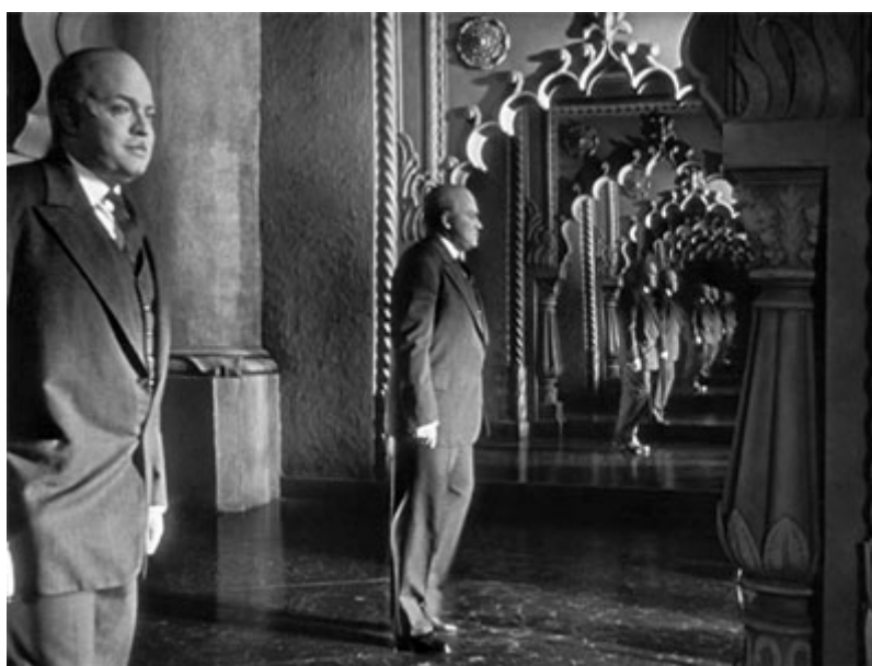
Kane versus Kane versus Kane: o espelho escava a profundidade da imagem na obra-prima de Orson Welles. A justaposição de “planos” homogeneamente nítidos deixa no ar a questão: o real está de que lado do espelho? (Figura 4)

tomada de cena. De acordo com a distância aparente de um objeto em relação à câmera – ou o olhar do espectador – dir-se-á que ele se encontra em primeiro “plano”, em segundo “plano”, etc. (Ao referir-me a essa segunda definição de “plano”, usarei o termo entre aspas, para diferenciá-la da precedente). Conclui-se, portanto, que no interior de cada plano, existem diversos “planos”: um primeiro “plano”, correspondente aos objetos mais próximos da câmera; um segundo “plano”, que abarca os objetos um pouco mais afastados, e várias gradações de “planos” de fundo. Uma fotografia ou um fotograma cinematográfico podem focalizar apenas um desses “planos”, por meio da regulagem da abertura do diafragma e da distância focal da objetiva, deixando os demais em flou – termo pictórico que designa uma zona nebulosa, fora de foco. Por outro lado, a técnica da filmagem e da fotografia permite que muitos, ou quase todos os “planos” sejam focalizados homogeneamente, gerando um grau de nitidez semelhante em todas as partes do campo. A p.d.c. se define, exatamente, enquanto extensão da zona de nitidez da imagem cinematográfica 103 . Quando a p.d.c. é extensa, ela sobrepõe uma série de objetos diante do eixo da câmera, aumentando o efeito perspectivo. Numa filmagem em pouca p.d.c., apenas um desses “planos” está nítido. Duas imagens ilustram essa definição: