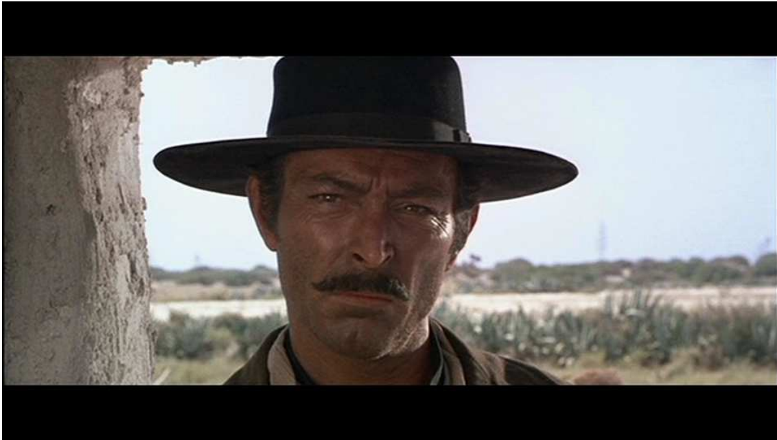
O diretor italiano Sergio Leone tinha verdadeira obsessão pelo rosto humano. Em seus westerns, a pouca p.d.c. serve para destacar faces, expressões e olhares contra um mundo nebuloso. Acima, o rosto e Lee Van Cleef em Três homens em conflito . (Figura 5)

O plano-seqüência e a p.d.c eram procedimentos comuns nos primórdios do cinema, notáveis já nos filmes dos irmãos Lumière. Perderam espaço, contudo, nas décadas de 1920 e 1930 – a era da montagem-rei – sendo (re)descobertos no cinema pós-Segunda Guerra, especialmente a partir dos filmes de John Ford, Jean Renoir e Orson Welles. Entre os filmes mais importantes nesse processo, vale citar No tempo das diligências , de John Ford (1939), A regra do jogo , de Jean Renoir (1939) e Cidadão Kane , de Orson Welles (1941).