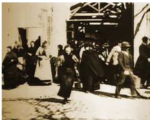
A primeira imagem histórica do cinema: captação do real? (Figura 1)

Início este capítulo pelo confronto entre duas imagens ilustrativas dos primórdios do cinema. A primeira delas é um fotograma de Sortie des ouvriers , documentário de cinquenta segundos dirigido pelos irmãos Lumière em 1895 – umas das primeiras imagens na história cinematográfica. O filme mostra a saída de um grupo de operários da fábrica Lumière, na periferia de Lyon, França. Filmada com o cinematógrafo (aparelho que, além de câmera cinematográfica, funcionava como projetor) o filme é um agrupamento de quadros em que a mão do realizador está apenas implícita, no próprio ato da filmagem. Não há cenas ensaiadas, figurinos, ou jogos expressivos com a iluminação. O filme foi exibido naquele mesmo ano no Grand Café, no Bulevar dos Capuchinhos, em Paris.