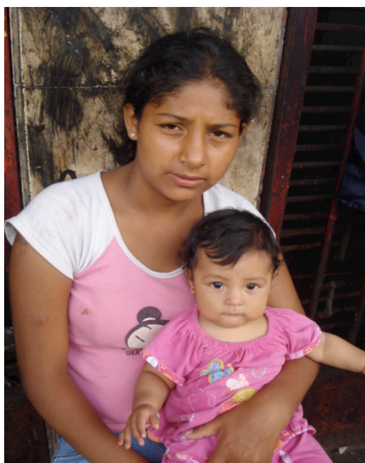
Foto 13: Conhecida como a “negra”, porque dança música afro-peruana nos ônibus 64 .

O tempo passou e ela conheceu novos lugares, como a internet e os modismos com todos os seus eventos que a mídia transmite. Na busca por essas coisas novas, conheceu um rapaz que faz música e começaram a namorar, aprendeu com ele, trabalharam juntos por um bom tempo até que teve que voltar para casa por causa de sua gravidez. Na rua cada dia é um dia diferente do outro, às vezes se ganha dinheiro e outras vezes não, não podia arriscar e decidiu voltar para a casa da família, lá seria mais seguro porque não faltaria o que comer. Ao ter o bebê voltou às ruas para seguir batalhando por um prato de comida.