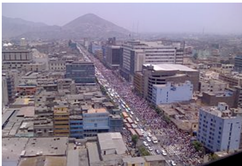
Foto 5: Avenida Abancay, vista desde o prédio Alzamora Valdez - Lima 31 .

Cabe dizer que a Avenida Abancay é um dos pontos onde muitas linhas de ônibus interceptam vários outros distritos da cidade de Lima, ônibus que vão para o norte, centro e sul da cidade. Há também milhares de pessoas movimentando-se no dia-a-dia, porque nessa avenida há muito comércio e, perto dela, estão alguns pontos de ônibus interestaduais que vão ao norte e ao sul do país.