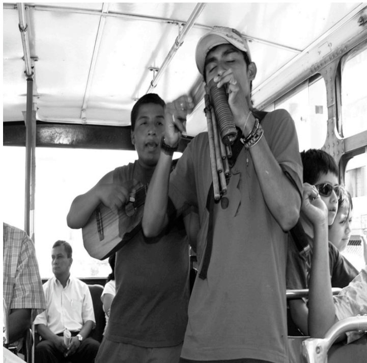
Foto 22: A imagem e a postura dos jovens músicos ao interpretar a música dos outros 119 .

O que se quer destacar aqui é a forma de interpretar. No caso dos jovens músicos, ao interpretarem uma canção o faziam com muita convicção, ou seja, acreditavam no que estavam fazendo.