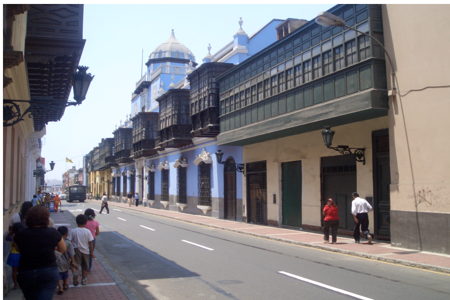
Foto 3: Diferentes tipos de balcões ao longo da rua “Conde de Superunda” no centro 29 .

São os estilos e tamanhos dos balcões que fazem de Lima uma beleza particular, revelados também nas suas praças, nos seus prédios e nas suas casas. Pela forma como foi construída esta cidade somada às variedades de flores que há nas praças, foi chamada uma vez A Cidade dos Reis. Nesta Cidade dos Reis, o barroco e o rococó fazem o contraste com o estilo moderno que, por sua vez, se mistura com as cores dos ônibus, com as cores peculiares que há nos restaurantes e nas lojas de artesanato. Cores que fazem parte do urbanismo da cidade. É uma cidade cheia de contrastes, multicultural, sincrética.