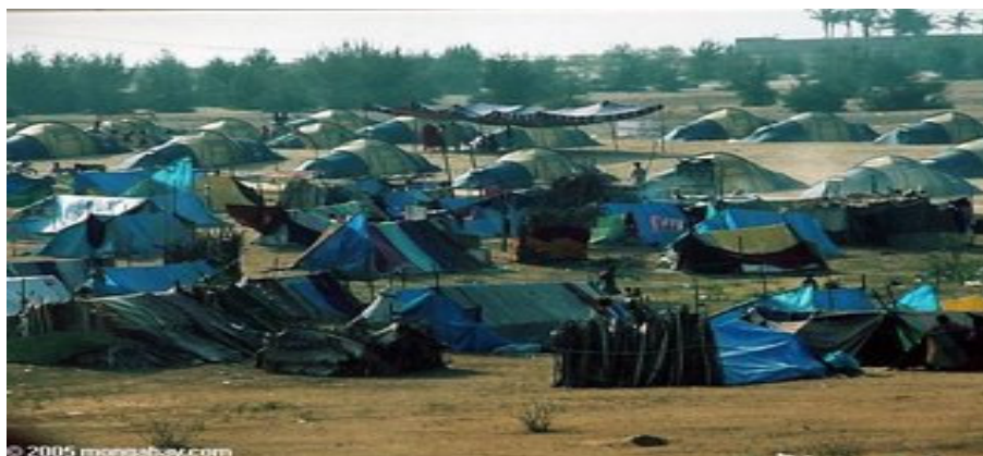
Figura 1 – Campo de Refugiados Vítimas do Tsumami na Indonésia

Conforme as figuras que seguem, podemos vislumbrar alguns dos milhares campos de refugiados espalhados pelo mundo, que acolhedores de vítimas de guerras e de catástrofes naturais: