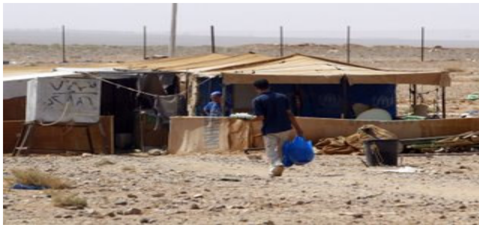
Figura 2 – Campo de refugiados Palestinos na Jordânia