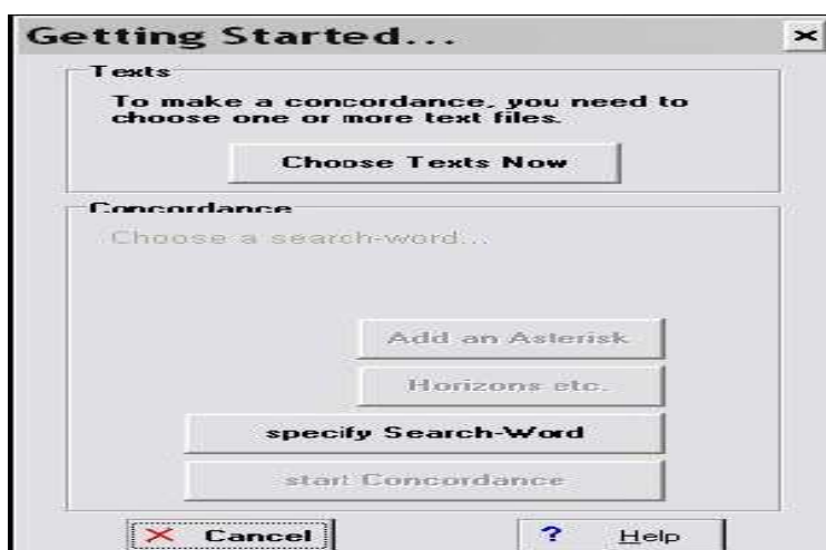
Figura 5 - Janela de seleção de corpus

Há também a opção de mudar os textos e as palavras selecionadas para análise em Change Selection ou Change Search -Word . Basta acioná-los e escolher os textos e palavras de interesse.