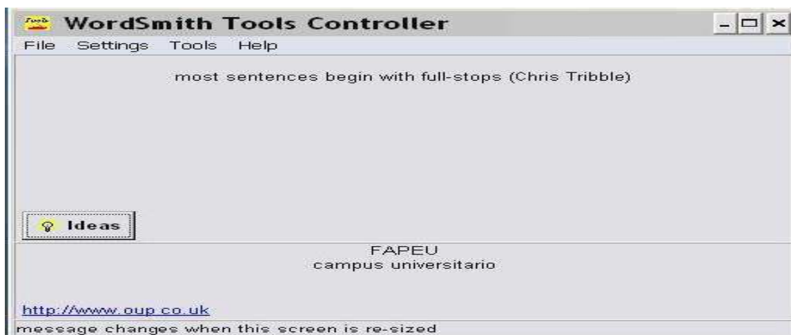
Figura 1 - Tela inicial do WordSmith

Neste trabalho, foram utilizados quatro corpora para a elaboração do glossário, sendo dois de análise: um em inglês, com suas respectivas traduções em português, e outros dois de referência: um em português e outro em inglês.