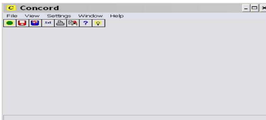
Figura 4 - Tela principal do Concordanciador do WordSmith :

7º PASSO - A seguir, deve-se clicar em File e em seguida em Start , onde será aberto o item Getting Started , e em Choose Texts Now , o qual fornecerá meios de escolher os textos em que há interesse para pesquisar um item lexical. Em seguida, deve-se acionar o comando Specify Search-Word (Tabeka 5) e digitar quais as palavras que se quer saber se coocorrem.