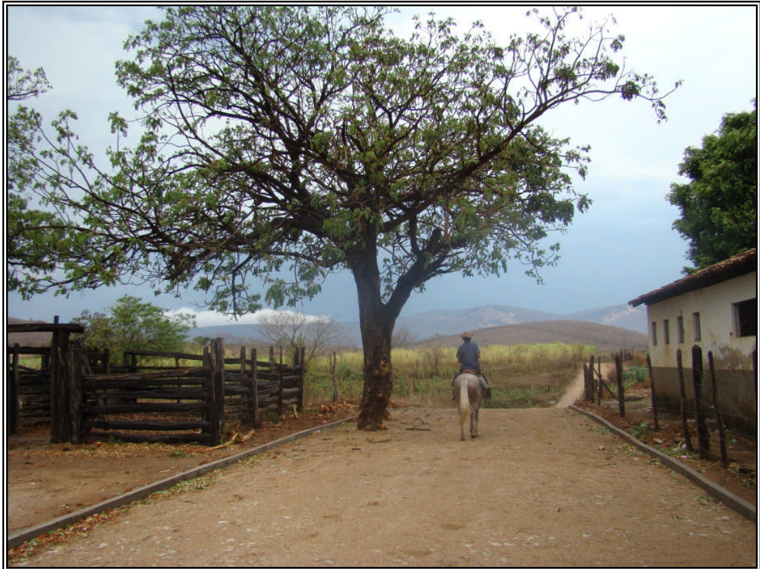
FIGURA: São Pedro do Jequitinhonha, Minas Gerais.

O que importa na vida não é o ponto de partida, mas a caminhada. Caminhando e semeando, no fim terás o que colher! Cora Coralina