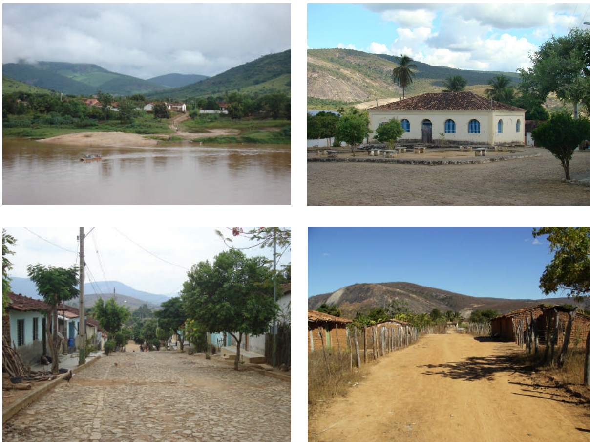
FIGURA 3 - Vila central de São Pedro, Distrito Rural de Jequitinhonha, Minas Gerais, 2008.

São Pedro também possui um Centro de Saúde, onde atua uma Equipe de Saúde da Família (ESF) que desenvolve atendimento nos programas de Atenção Primária. Os atendimentos são realizados duas a três vezes na semana porque os profissionais prestam assistência a outras localidades rurais do município. Os exames complementares e as consultas nas especialidades médicas são realizados na sede do município ou em outras cidades do Estado de Minas Gerais. Nas condições de morbidades agudas e graves, ou trabalho de parto, o transporte dos pacientes é feito por uma ambulância e a travessia do rio muitas vezes torna-se uma barreira geográfica para o atendimento a tempo desses pacientes.