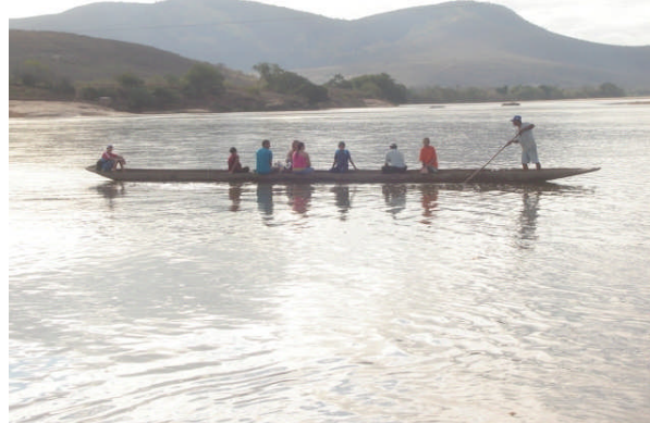
FIGURA 2 - Travessia do Rio Jequitinhonha para acesso à vila central de São Pedro do Jequitinhonha, Minas Gerais, 2008.

As crianças e adolescentes residentes em São Pedro freqüentam a escola estadual que está localizada na vila central e que oferece os ensinos de nível fundamental e médio nos turnos matutino e vespertino. Existe um transporte escolar para os moradores das localidades rurais, mas há locais em que as crianças precisam andar a pé ou a cavalo por cerca de duas horas para chegarem ao ponto do transporte escolar ou à escola. Além da escola, algumas crianças e adolescentes freqüentam a sede do Programa de Erradicação do Trabalho Infantil (PETI), onde desenvolvem atividades educativas e de inclusão social.