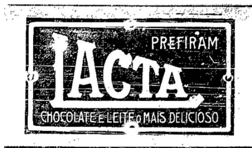
Figura 20: Exemplo de propaganda em O Combate