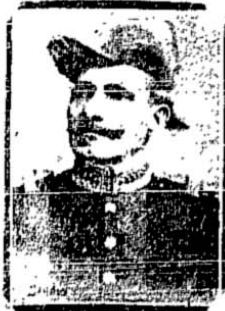
O presidente modelo

Mas os brasileiros já estamos habituados a essas coisas. Sabemos todos que o sitio é um factor normal em nossa vida politica. Agora, ante o estado de guerra, não era contra o inimigo que elle se impunha, mas contra nós mesmos.