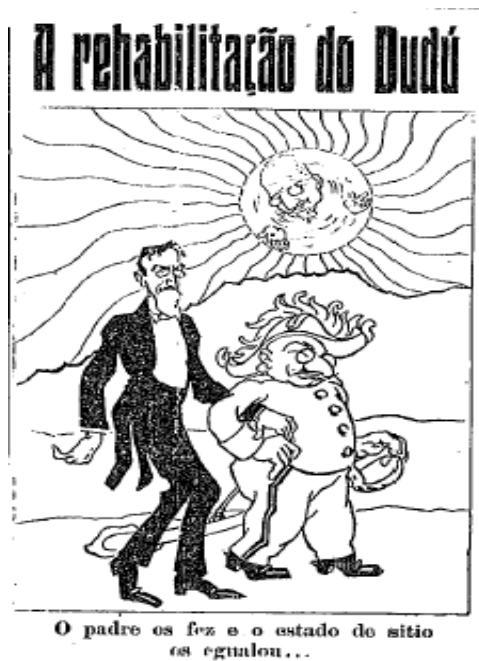
Figura 16: Exemplo do gênero textual charge

Apesar da pouca regularidade, eram publicadas em O Combate charges de teor declaradamente político. Em função do fato de esse gênero textual ser datado, ou seja, propor uma reflexão acerca de um acontecimento em discussão no momento, em uma primeira leitura não é possível depreender o alvo da crítica, o que se torna mais claro a partir de uma leitura mais atenta acerca dos fatos políticos do período. Seguem exemplos de charges retiradas da edição de 1º de março de 1918: