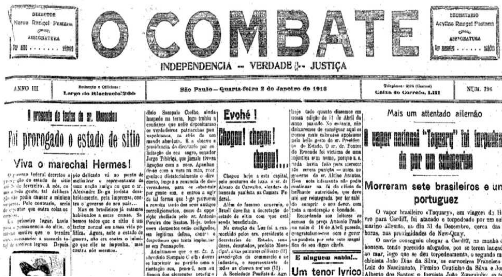
Figura 13: Gêneros presos de O Combate

De acordo com a nomenclatura proposta por Bonini (2003), em O Combate são partes integrantes do gênero central preso o cabeçalho , composto pela estrutura padrão dos jornais, ou seja, o título, subtítulo (com os dizeres, Independência – Verdade – Justiça ), a data, ano, número da edição, endereço da redação e número do telefone para contato; e o expediente , destacado por dois quadros com informações sobre os responsáveis técnicos (o diretor e o secretário) e o valor das assinaturas semestral e anual (cf. figura 13, p.70):