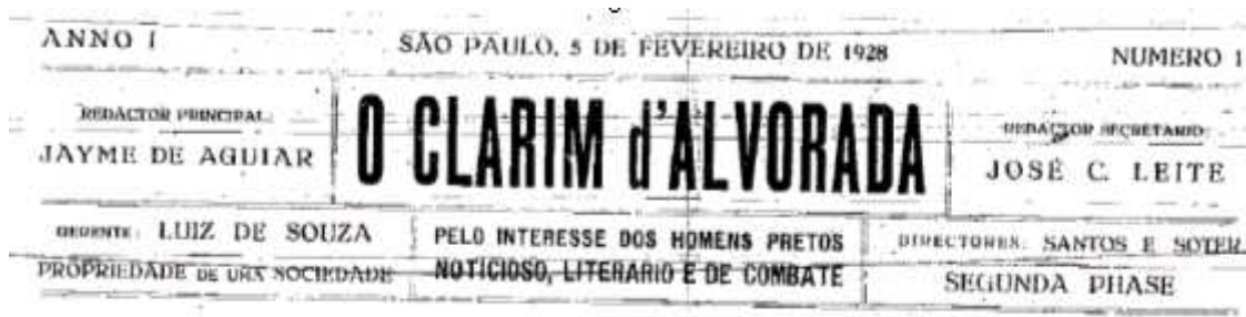
Figura 04: Cabeçalho do jornal inaugural da Segunda Fase de O Clarim d'Alvorada

A transição da primeira para a segunda fase ocorreu, sobretudo, pelo fato de esses redatores acreditarem que a união da comunidade negra não deveria se restringir à organização de sociedades dançantes, para fins simplesmente de entretenimento. Os dois acreditavam na possibilidade de organizarem uma associação com uma finalidade reivindicatória de fato, que garantisse aos negros a busca por um lugar justo na sociedade. Com um propósito ilustrativo, seguem o cabeçalho e alguns excertos do jornal inaugural dessa segunda fase: