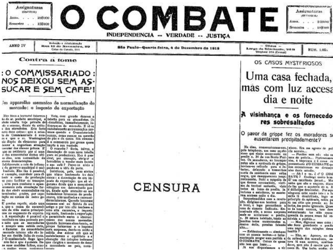
Figura 05: Exemplo de censura em O Combate