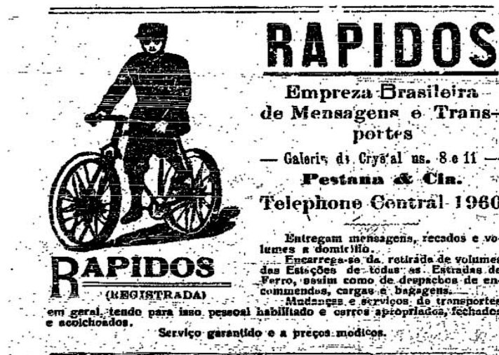
Figura 19: Exemplo de propaganda em O Combate