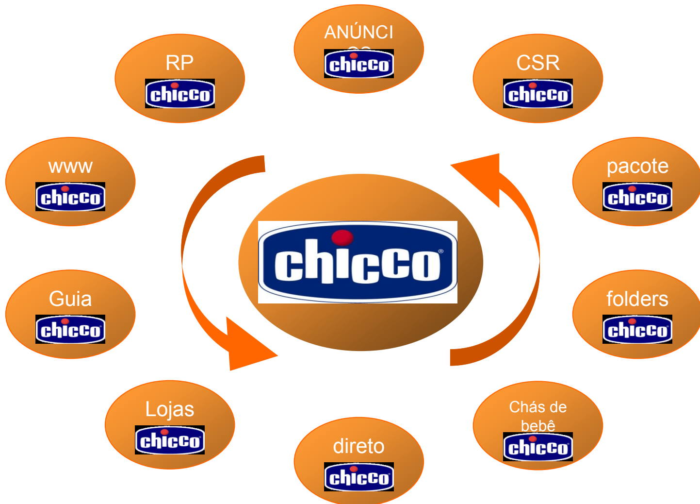
Tabela 4. Processo de comunicação interno