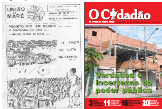
jornais União da Maré e O Cidadão