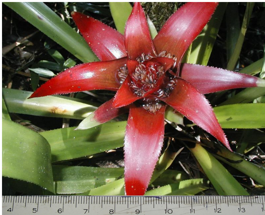
FIGURA 2 - INFLORESCÊNCIA DE Nidularium procerum EM CONDIÇÕES NATURAIS (FOTO: CARLISE PEREIRA, GUARATUBA, 1º/04/08, PR).