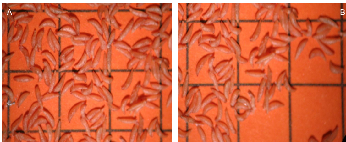
FIGURA 4 – SEMENTES SECAS DE N. innocentii (A) E N. procerum (B). (10/04/08, CURITIBA – PR, 2008). Escala 1:2000.