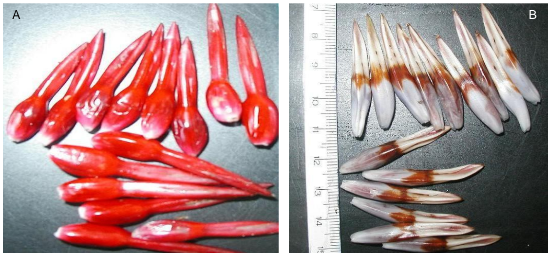
FIGURA 3 – FRUTOS DE N. innocentii , (A); E DE N. procerum (B). (07/04/08, CURITIBA – PR, 2008).

Contagens diárias do número de plântulas normais foram realizadas com o objetivo de determinar o tempo mínimo necessário para a conclusão do teste de germinação. A determinação do encerramento do teste se deu quando o número de plantas normais tornou-se constante.