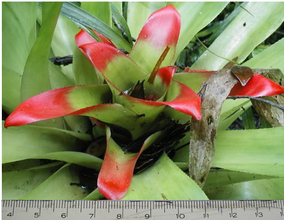
FIGURA 1 - INFLORESCÊNCIA DE Nidularium innocentii EM CONDIÇÕES NATURAIS (GUARATUBA, 1º/04/2008 PR, 2008).