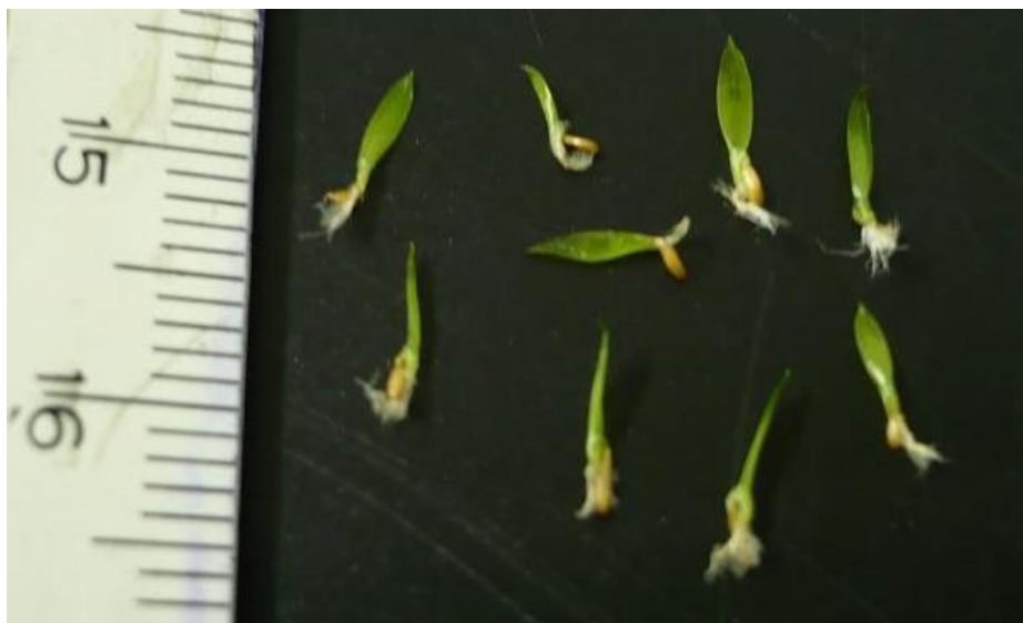
FIGURA 5 – PLÂNTULA NORMAL DE N. innocentii E N. procerum . (FOTO: CARLISE PEREIRA, 25/05/08, CURITIBA – PR, 2008).

Na Figura 5, está caracterizada a plântula normal das espécies estudadas.