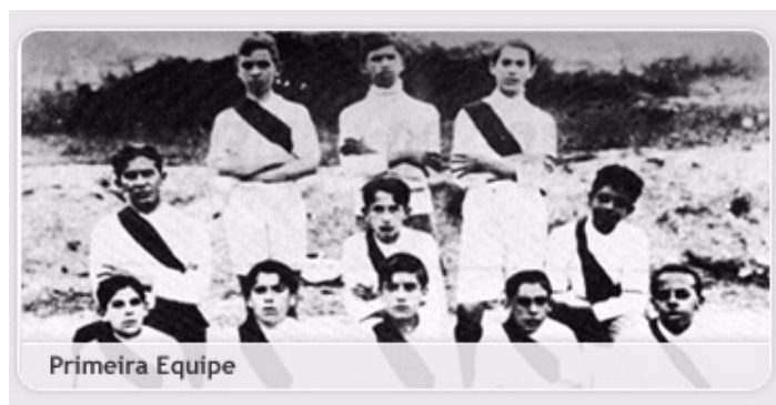
Foto 4 - Primeira equipe do América Mineiro.