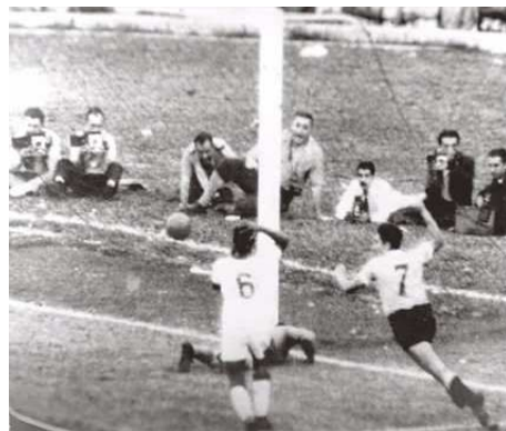
Foto 13 - O gol visto das arquibancadas.