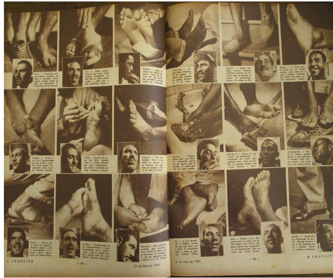
Foto 11 - A pátria desnuda.