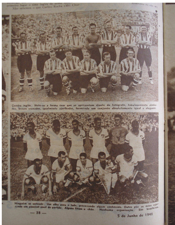
Foto 5 - Civilização X Atraso: vitória do Fluminense sobre o Southampton não foi suficiente para apagar estereótipos.