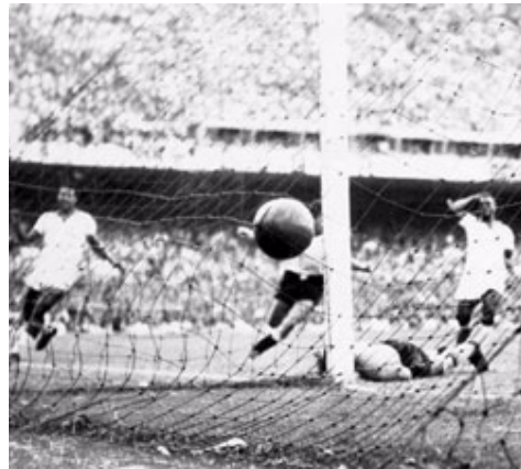
Foto 12 - A foto clássica do gol de Ghiggia.