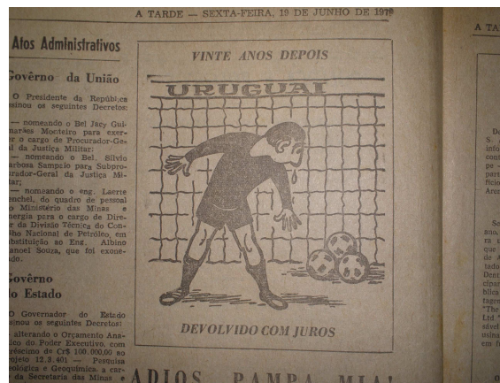
Foto 17 - A vingança comemorada: charge de "A Tarde" sobre a semifinal de 1970.