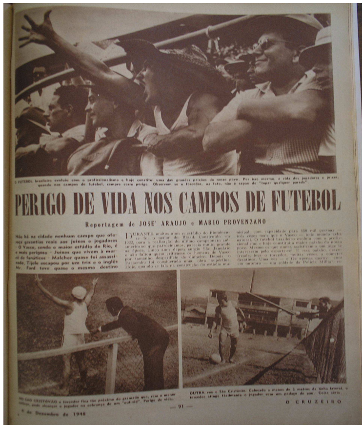
Foto 8 - O Cruzeiro na campanha pela construção do Maracanã.