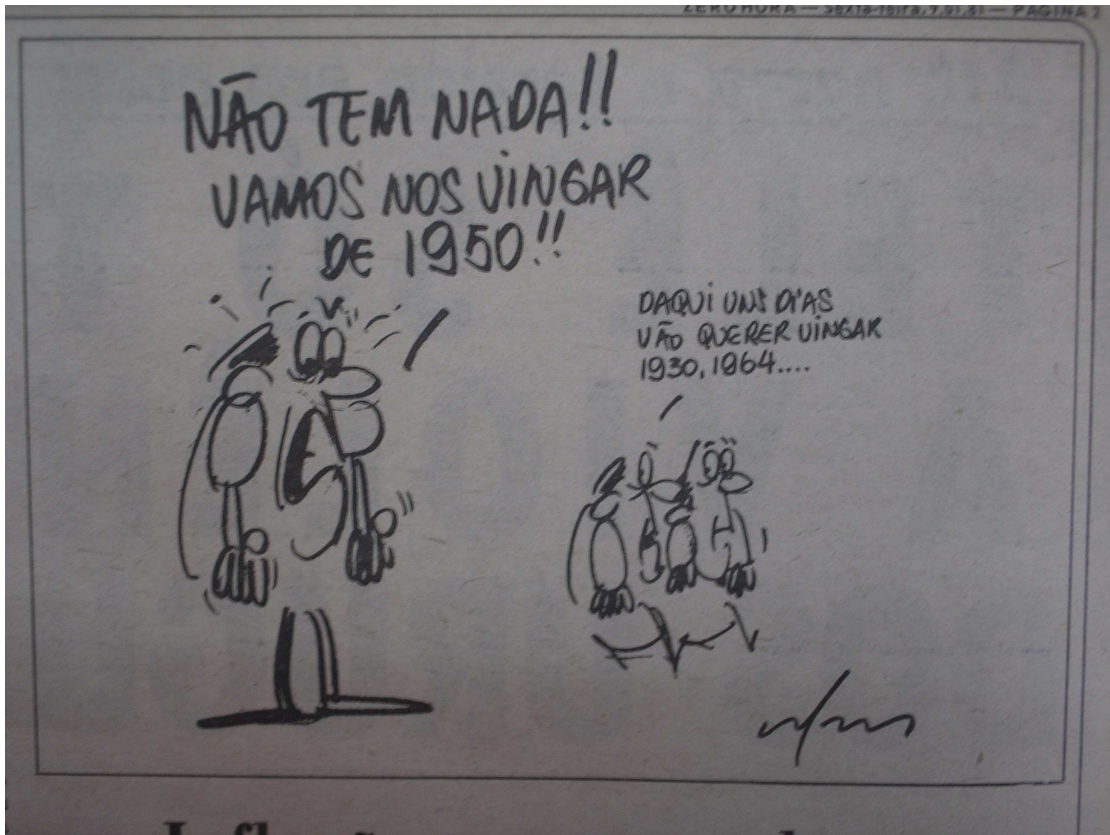
Foto 18 - A vingança em novo contexto: charge de Zero Hora antes da final do Torneio Mundialito.