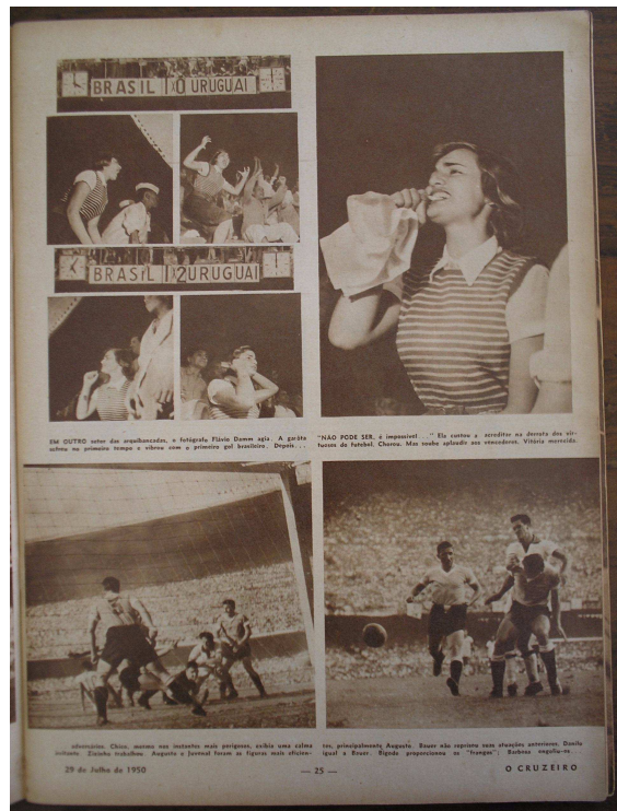
Foto 10 - No alto da página, torcedora assiste partida decisiva entre Brasil X Uruguai.