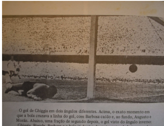
Foto 14 - O gol pelo ângulo inverso.