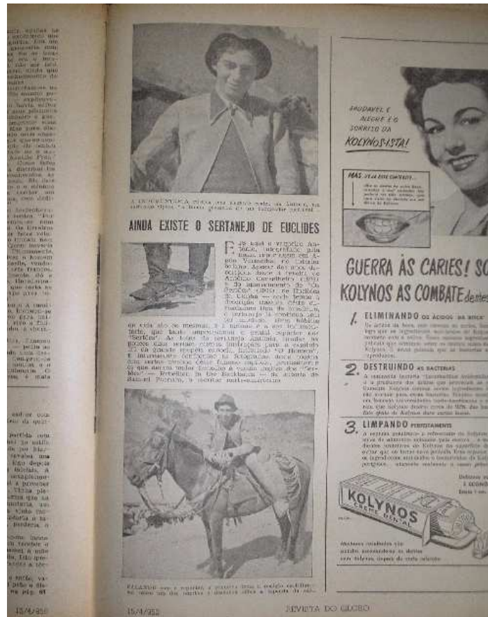
Foto 3 - O sertão esquecido: em 1950, Revista do Globo compara vaqueiro aos antigos habitantes de Canudos.