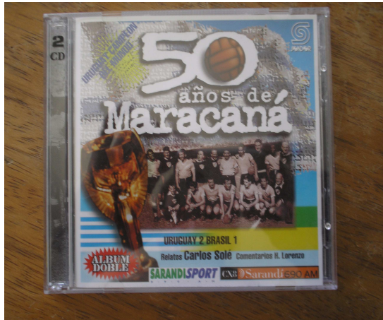
Foto 7 - A memória dos vencedores: cd uruguaio com a gravação completa do Maracanazo.