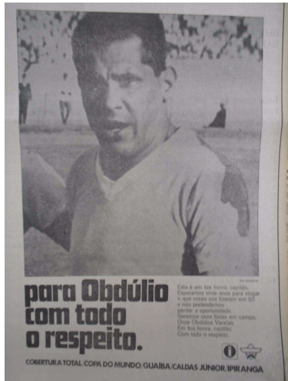
Foto 16 - A vingança necessária: o Correio do Povo divulga a semifinal de 1970.