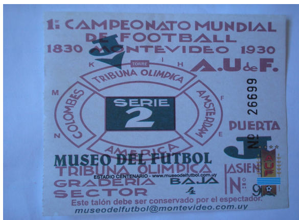
Foto 6 - A memória dos vencedores: ingresso do Museo del Fútbol, em Montevideo.