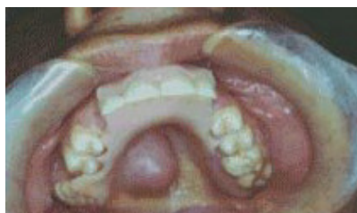
Figura 9: Aspecto clínico de região irritada e com edema, onde antes se apoiava uma prótese removível (GREIN, 2005).

Mesmo abandonando hábitos nocivos como o tabagismo e o alcoolismo, estando os dois associados, a probabilidade de adquirir a doença permanece por pelo menos 20 anos (TALAMINI et al, 1990). Estudos realizados por Franco et al (1989) apontam para os casos confirmados uma prevalência de câncer bucal no Brasil em brancos (83,2%) em relação a mulatos (11,2%) e negros (4,3%).