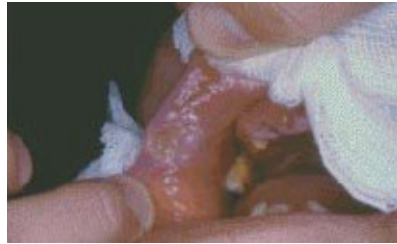
Figura 5: aspecto clínico de câncer de boca de ocorrência no lábio (GREIN, 2005).