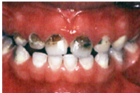
Figura 1: aspecto clínico da cárie atingindo a dentição decídua (BUSSADORI, 2005).

Pode ser encarada sob diversos aspectos: do ponto de vista biológico, comportamental e social. A interação entre esses aspectos é que determina o aparecimento e a progressão da cárie. Na Figura 1 tem-se o aspecto clínico da cárie atingindo a dentição decídua: