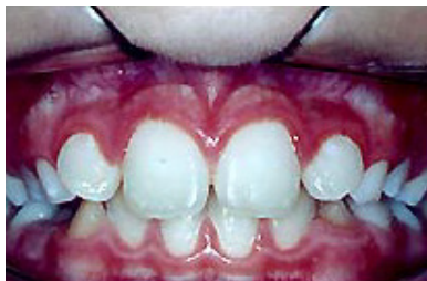
Figura 2: Aspecto clínico da gengivite (TAKEHARA, 2005).

alveolar 2 , ligamento periodontal 3 e cimento 4 ) e têm como causa a placa bacteriana subgingival (HAAS, 2005).