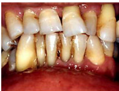
Figura 3: Aspecto clínico da periodontite (TAKEHARA, 2005).

Estudos longitudinais realizados na Inglaterra concluíram que a prevalência da gengivite em relação à idade foi de 5% aos 3 anos, 50% aos 6 anos e 90% aos 11 anos, ocorrendo um agravamento de maneira diferente entre os sexos (PARFIT, 1976 apud SALIS et al., 2002). No Brasil, a média de prevalência de gengivite em crianças de 7 a 12 anos de idade é de 90% (GUEDES-PINTO, 1999). Percebe-se, portanto, que na realidade brasileira ocorre uma alta prevalência em crianças na idade escolar, especialmente entre aquelas cujas faixas etárias correspondem ao ensino fundamental I.