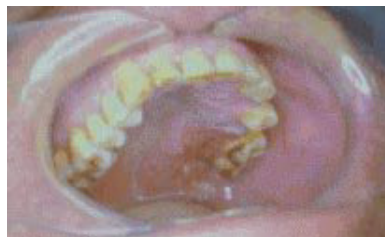
Figura 7: Aspecto clínico de mancha vermelha localizada na região palatina (GREIN, 2005).