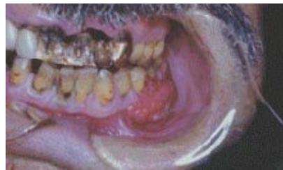
Figura 6: Aspecto clínico de mancha branca junto à gengiva e mucosa oral (GREIN, 2005).